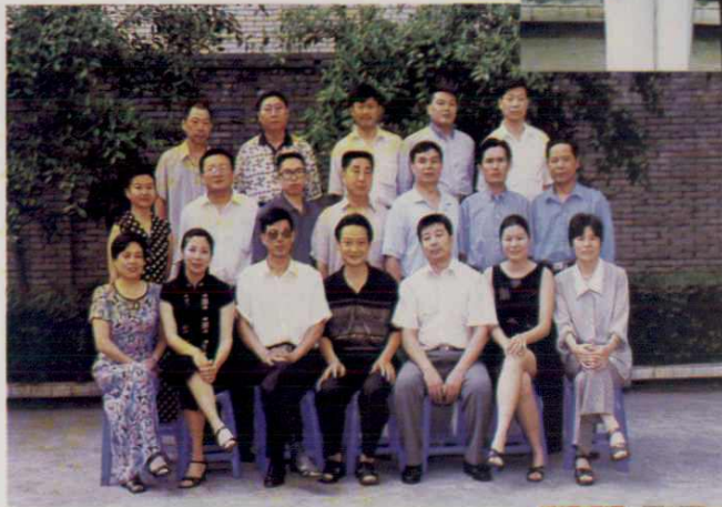
犍为县乡镇企业管理局 1999 年度机关工作人员合影