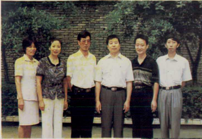
中共犍为县乡镇企业管理局 党组成员合影