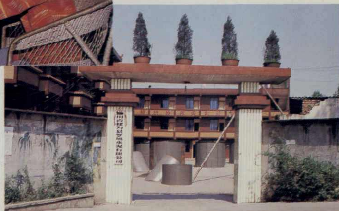
四川省犍为县罗城水泥有限公司