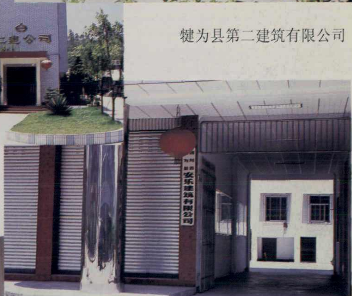
四川省犍为县安乐建筑有限公司