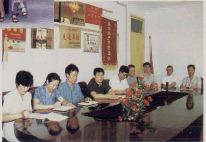
犍为县乡镇企业局局志领导小 组合影