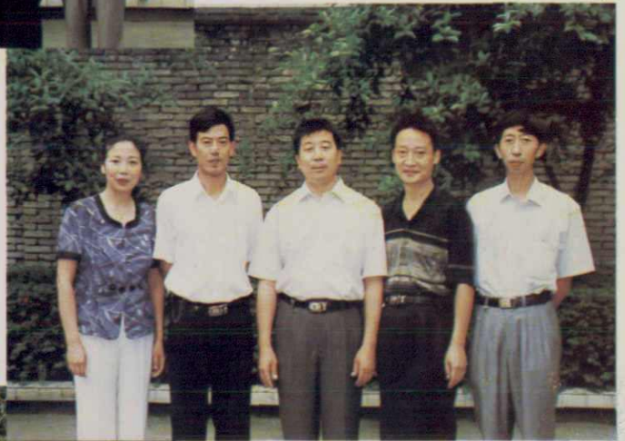
犍为县乡镇企业管理局局长、 副局长合影