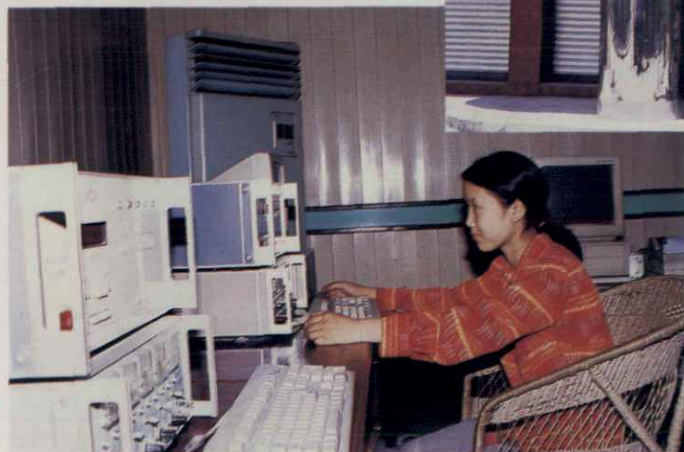
四川省犍为县罗城水泥有限公司 微机调控室