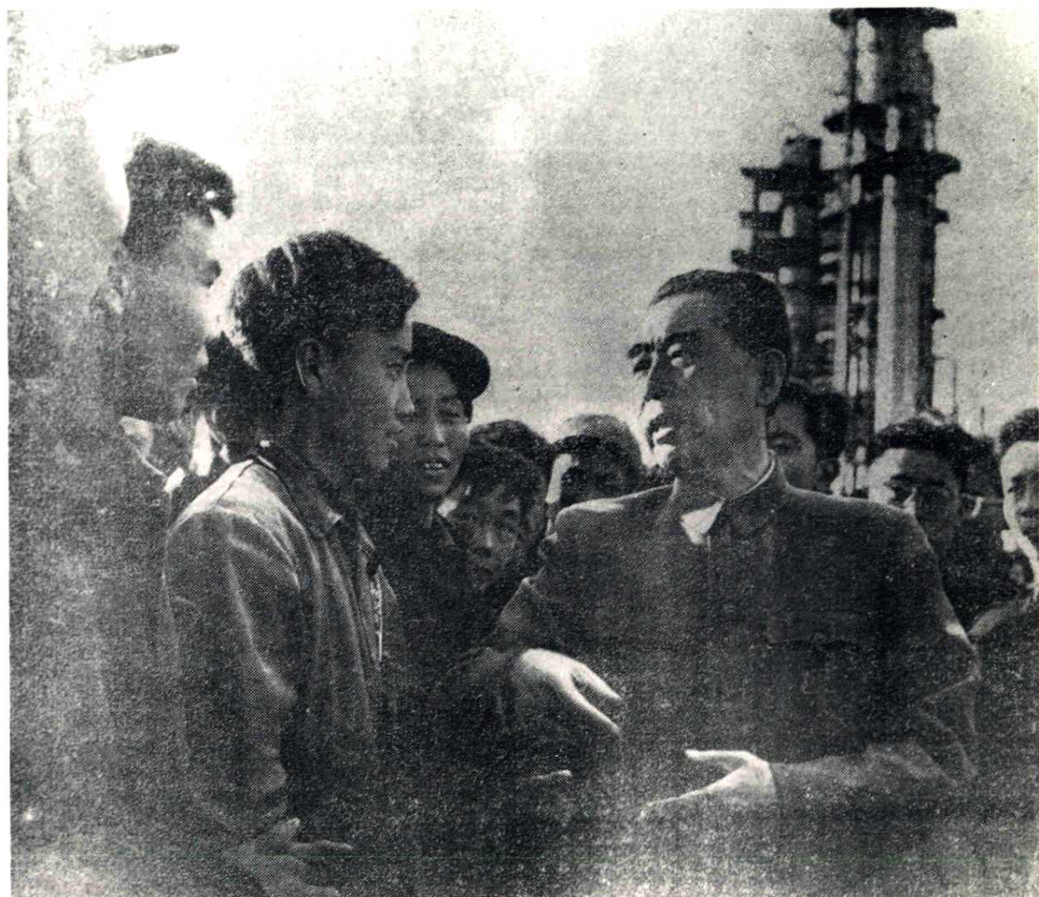
1959年，周恩来总理视察兰州炼油厂时与工人谈话