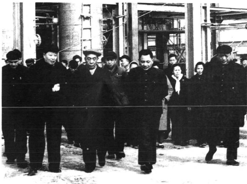
1966年,国家领 导人邓小平、李富春 视察兰化公司