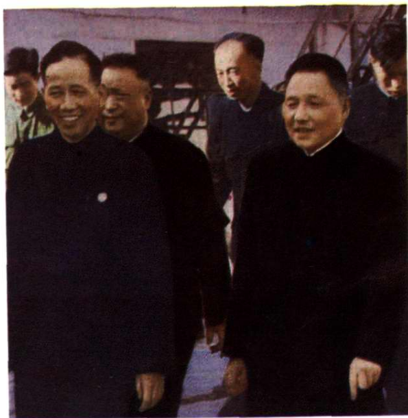
国家领导人邓小平视察兰州炼油厂