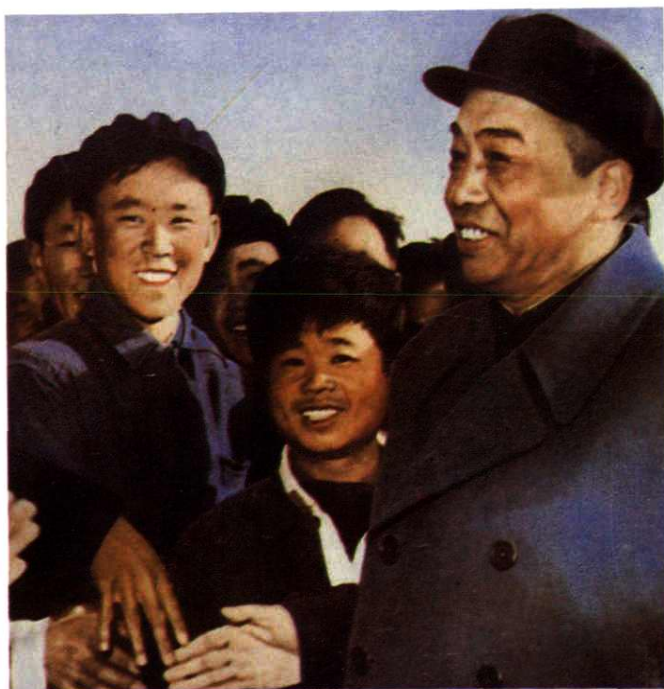
国家领导人彭德怀视察兰州炼油厂