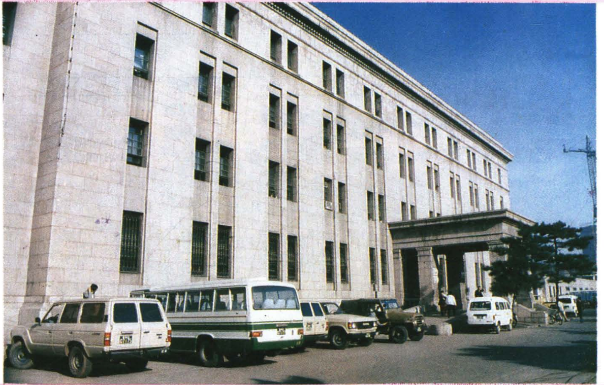
原东北银行专门学校、长春银行学校校址