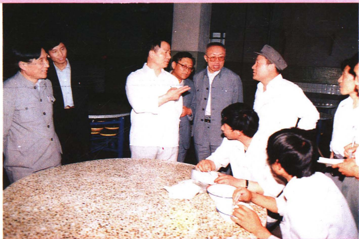
1988年7月，中共吉林省委书记何竹康等 领导同志视察工作