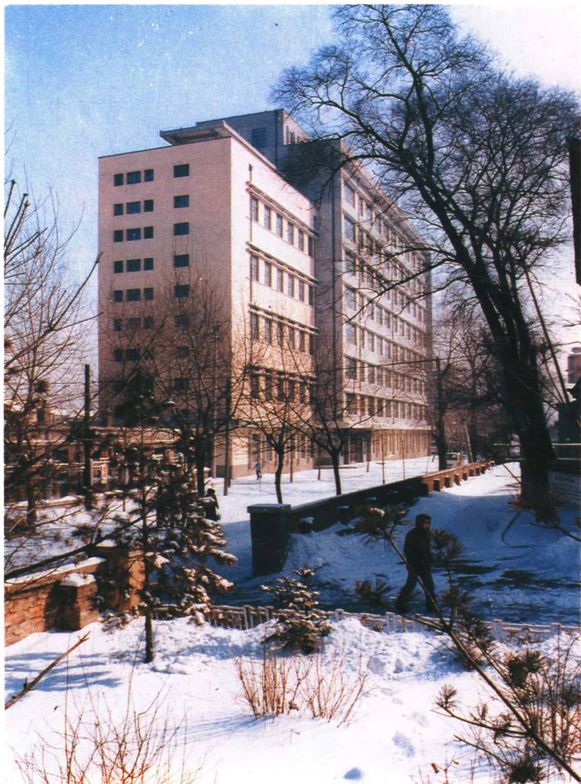
吉林财贸学院教学楼