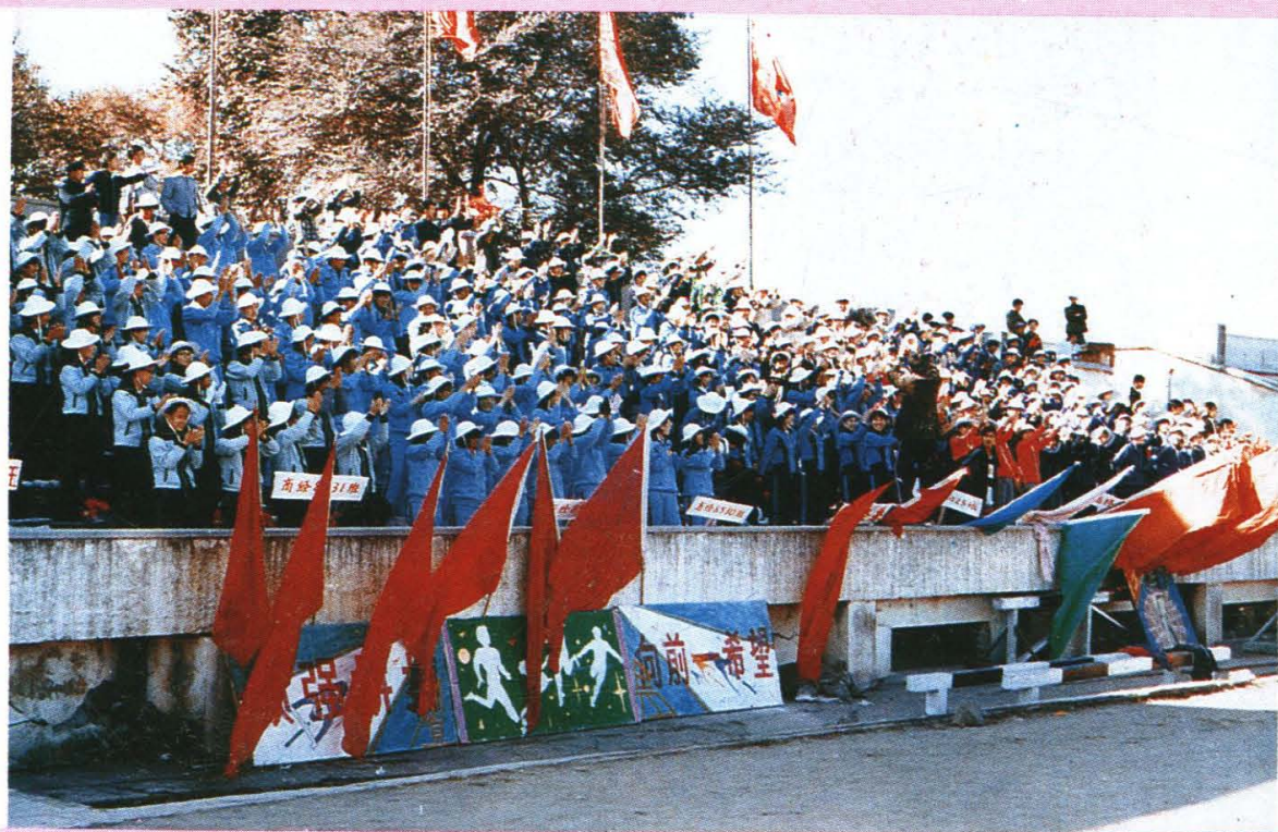
全院教职工，学生参加田径运动会