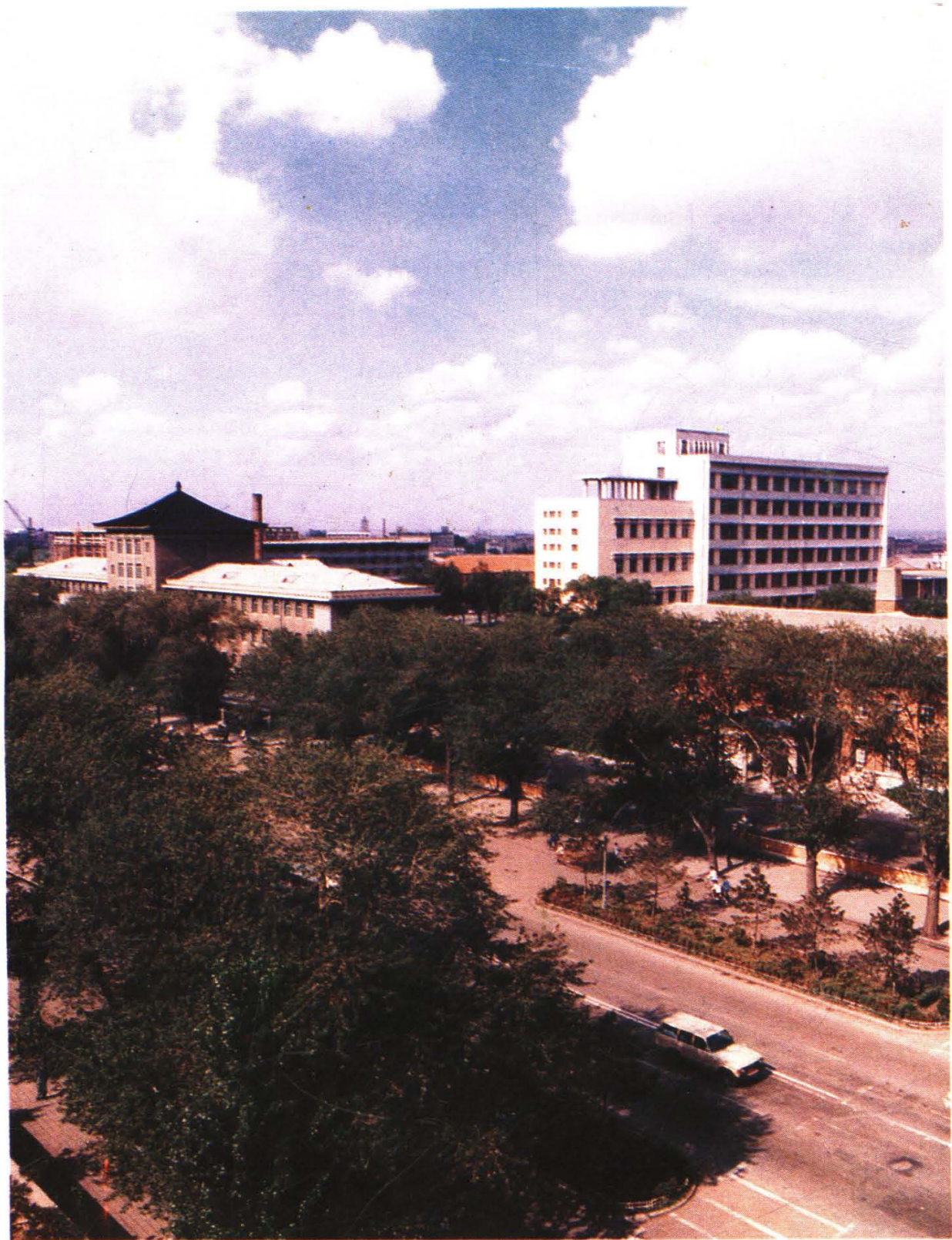
吉林财贸学院全景（长春市斯大林大街84号）