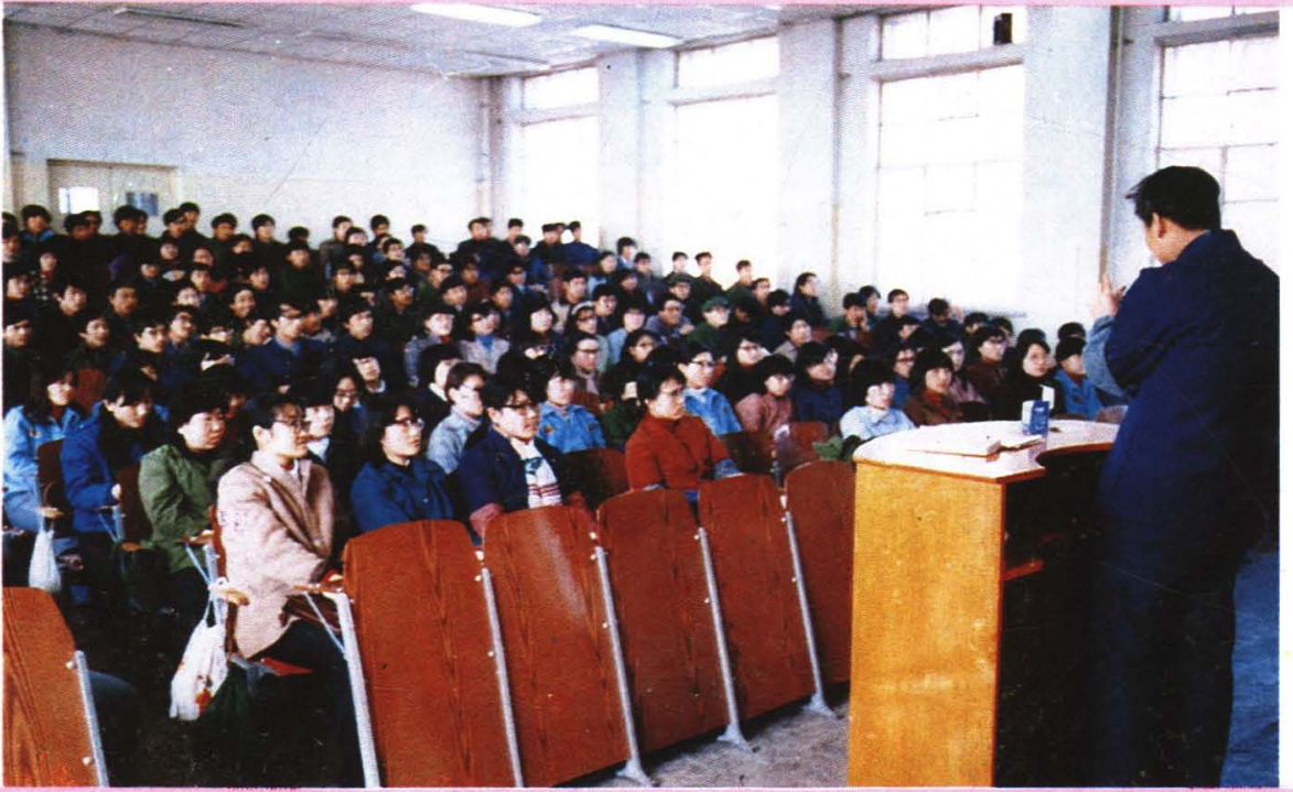
学生在阶梯教室听课