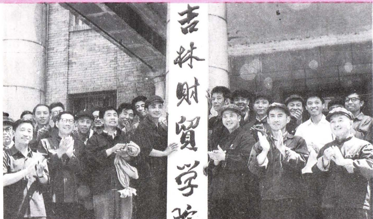
1978年经国务院批准，恢复吉林财贸学院