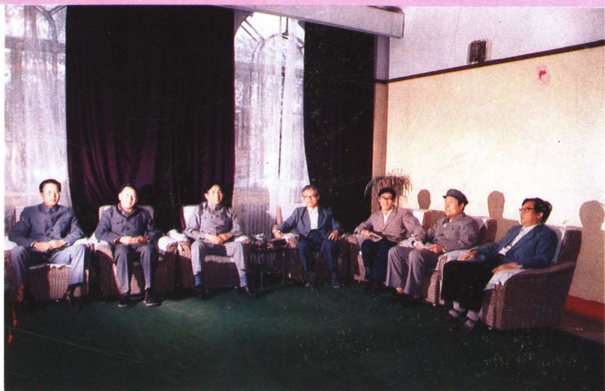
现任党政领导讨论深化教育改革