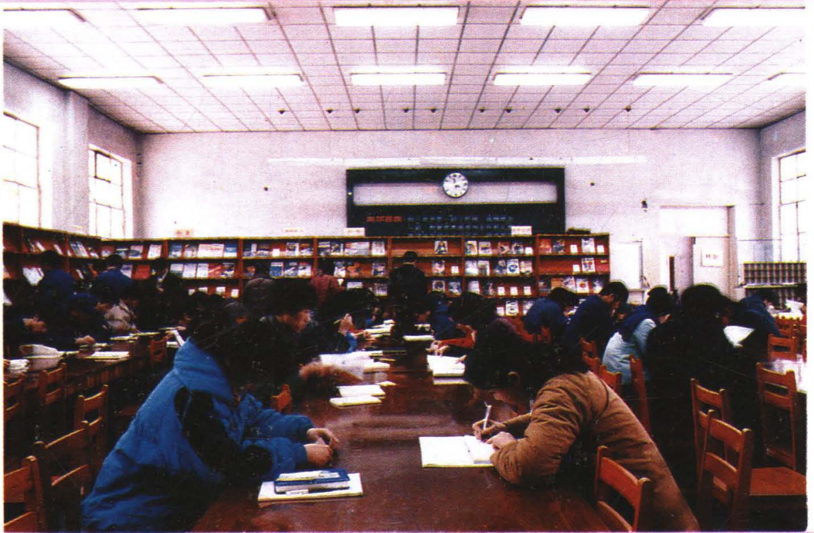
学生在图书馆读书、阅览