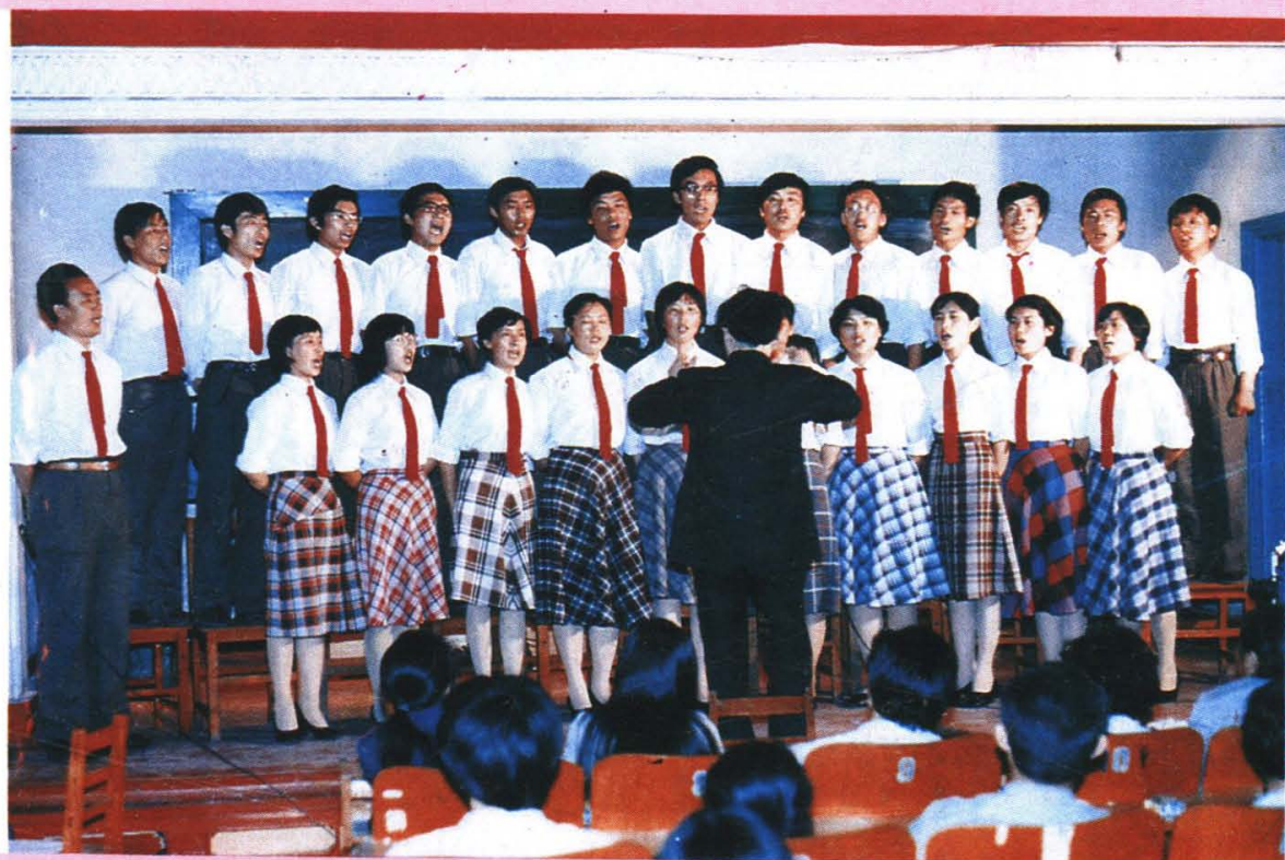
教职工、学生参加文艺比赛活动