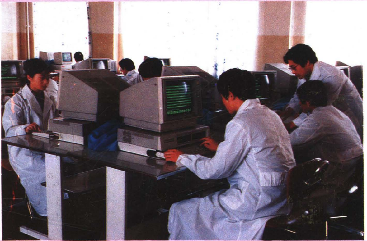
学生在电教中心进行计算机操作