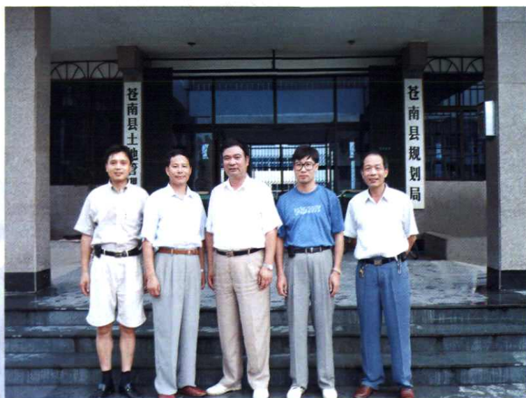
苍南县土地管理局 领导班子合影