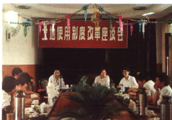
土地使用制度改革座谈会