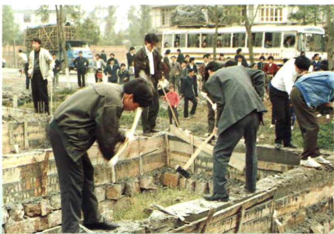
强制拆除违章建筑