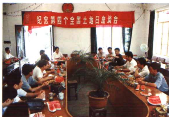
第四个土地日座谈会