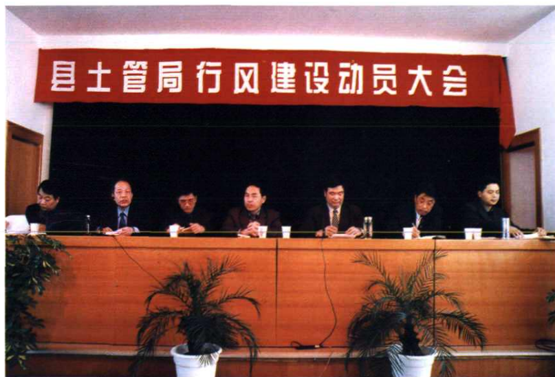
县土管局行风建设动员大会