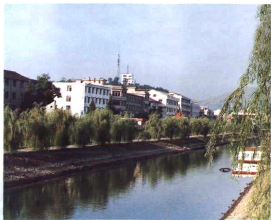
县城滨河公园一角