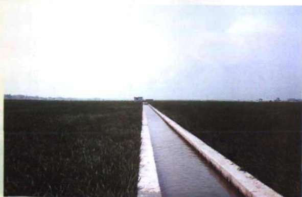
农地整理后的标准园区