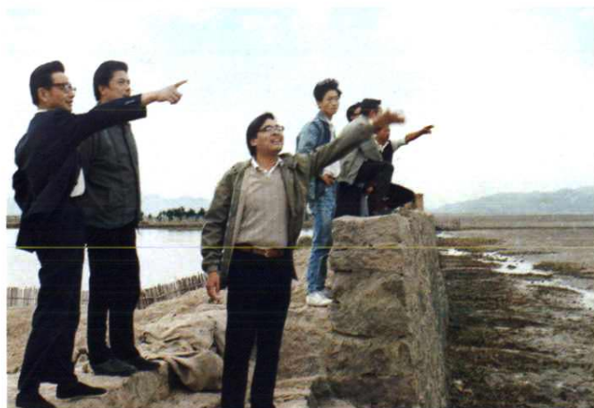
省、市、县领导视察海涂围垦