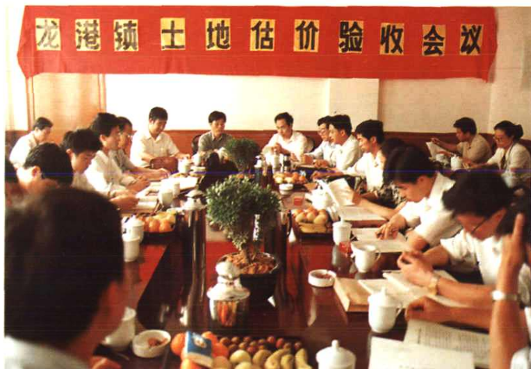
龙港镇土地估价验收会议