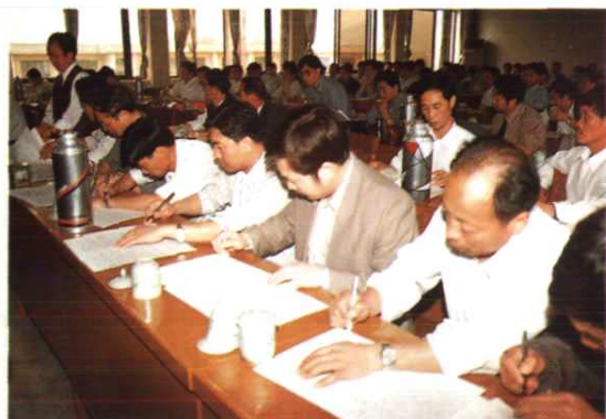
苍南县各乡镇领导在签定土地管理责任书