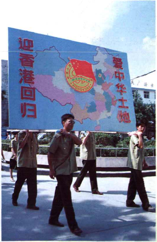
爱国土迎回归游行