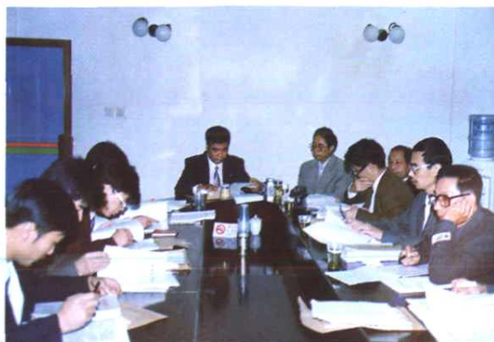
《苍南县土地志》审稿会