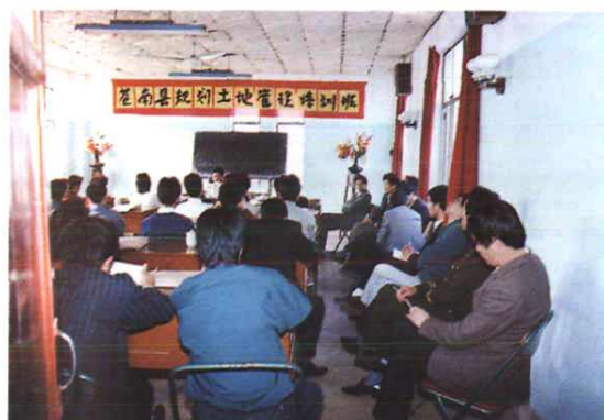
苍南县规划土地管理培训班