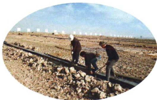
龙港白沙改地造田