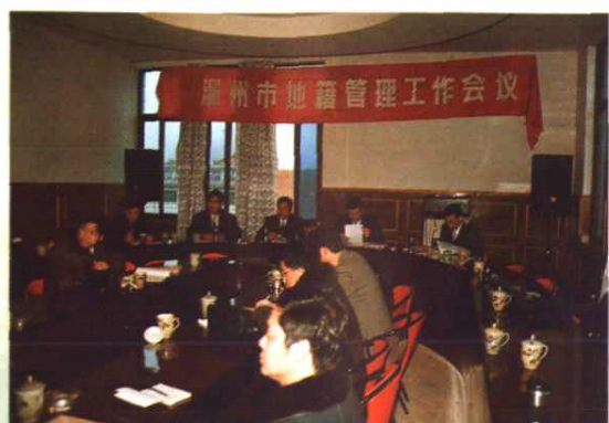
在苍南县召开的市地籍管理工作会议现场