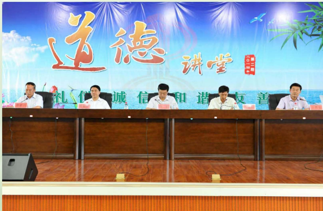
2014年7月,自治区国税局局长佟伟(左三)来伊犁州宣布王勇实(右一)局长任职。