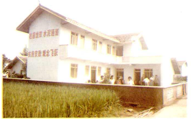
塘坝乡跃进新农村一角