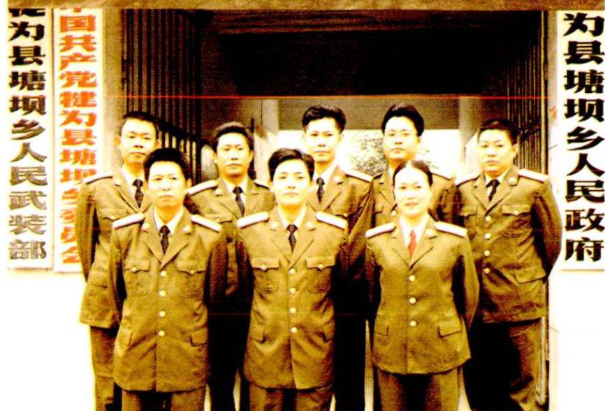
中国人民解放军乐山陆军预备役旅 炮兵团一营二连全体预备役军官合影