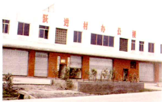
塘坝乡跃进村办公楼