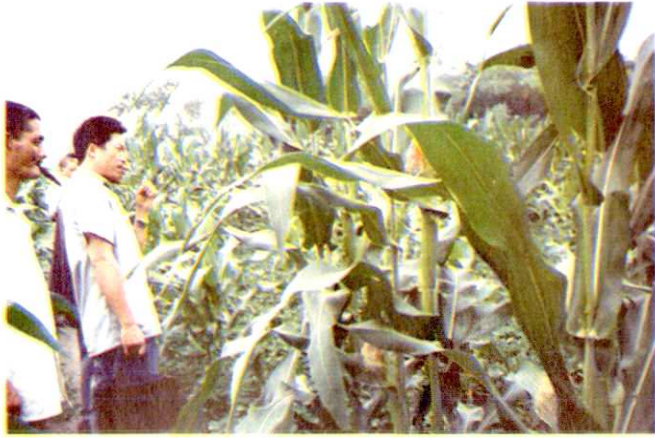
塘坝乡高产玉米长势良好