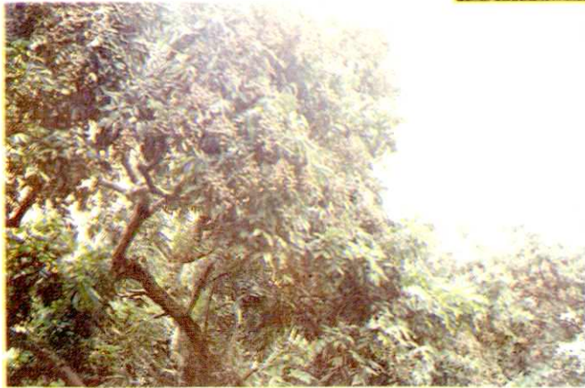
硕果累累——塘坝桂圆一角