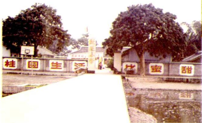
地处塘坝乡桂圆基地的跃进村小学校