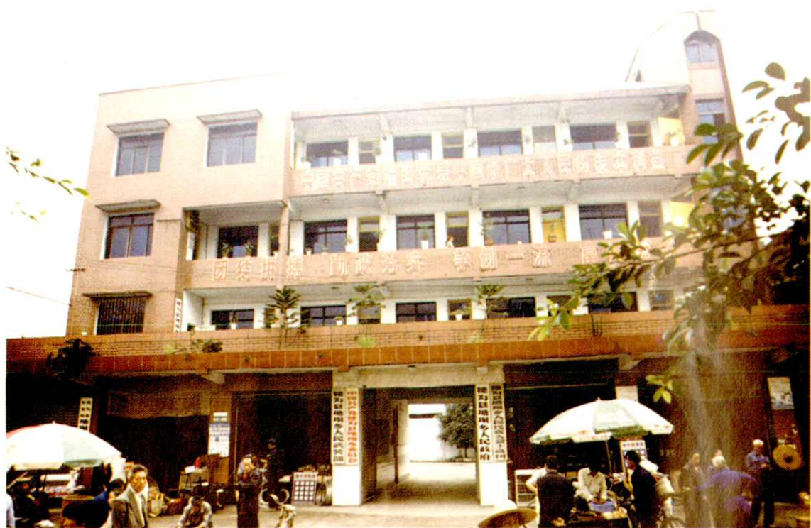
塘坝乡人民政府办公楼