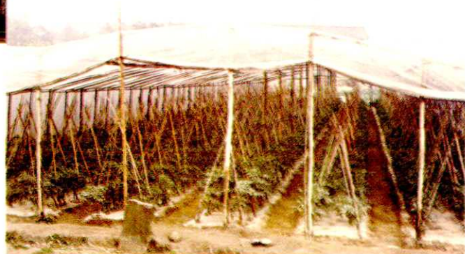
塘坝乡镇江村大棚蔬菜基地