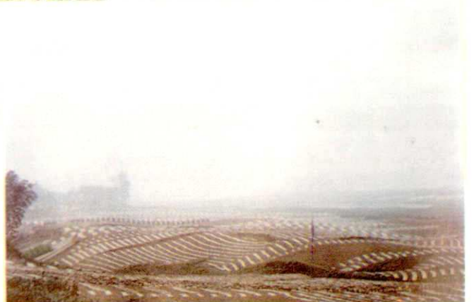
玉米地膜覆盖高产栽培示范片区