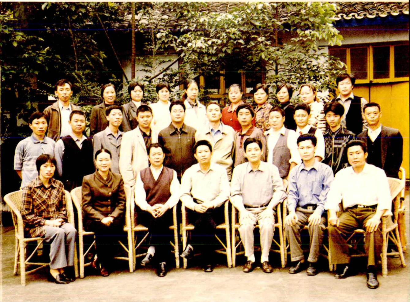
塘坝乡全体干部职工合影