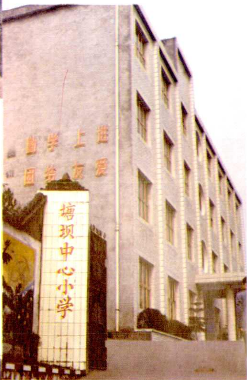
塘坝乡中心小学一角