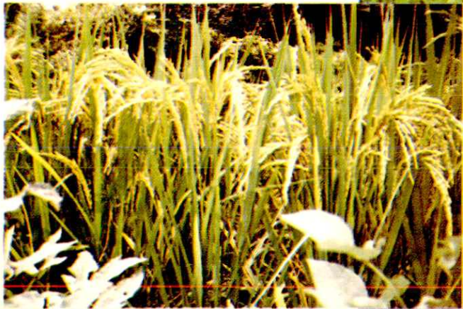
塘坝乡高产水稻栽培