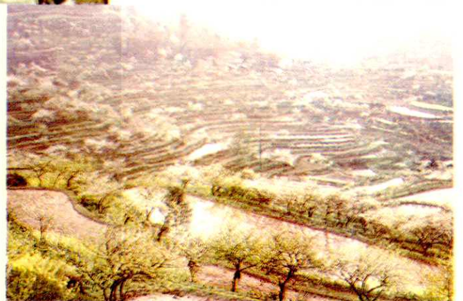
塘坝乡新房村李子基地