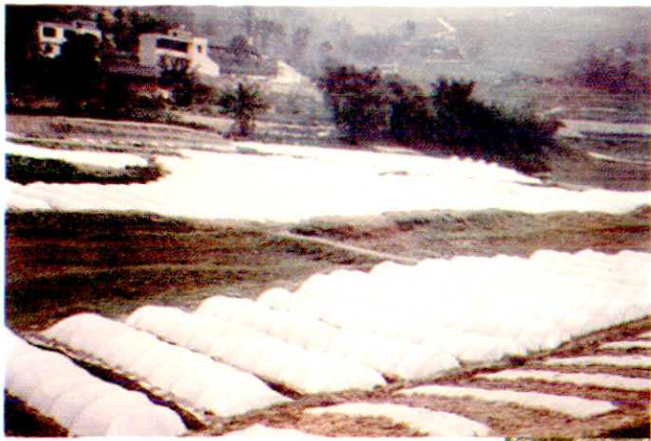
塘坝乡水稻旱育秧现场