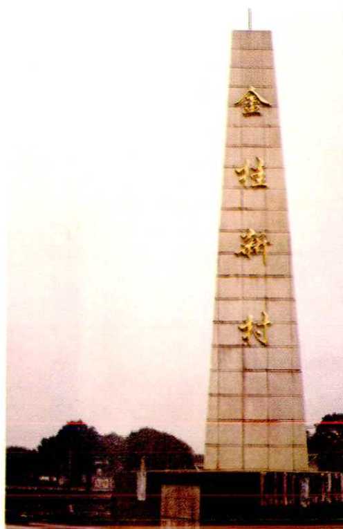
塘坝乡跃进桂圆基地——金桂新村碑