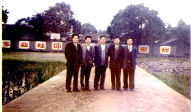
省级领导来塘坝乡视察跃进新村与桂圆基地