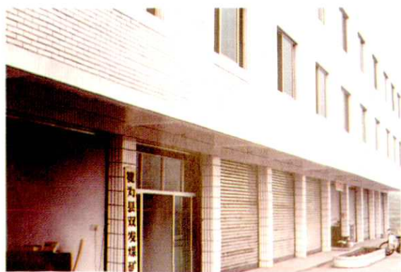
犍为县双发煤矿办公楼