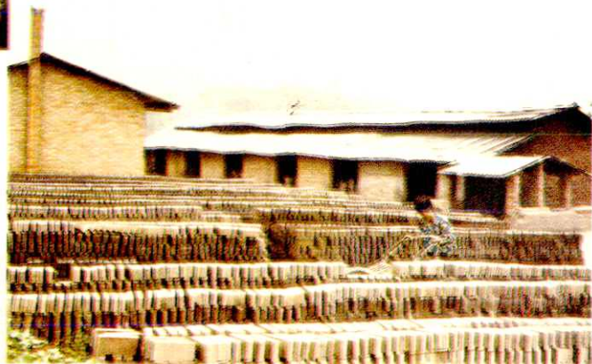
塘坝乡红光村机砖厂