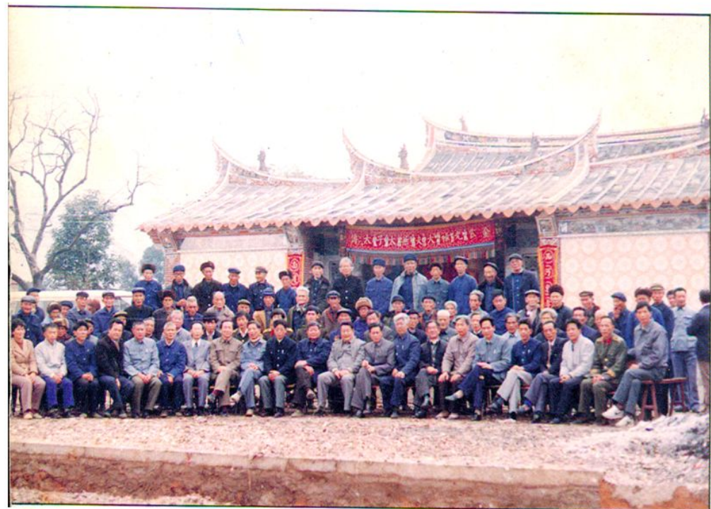
蓮兜美老年人協會 會員及來賓