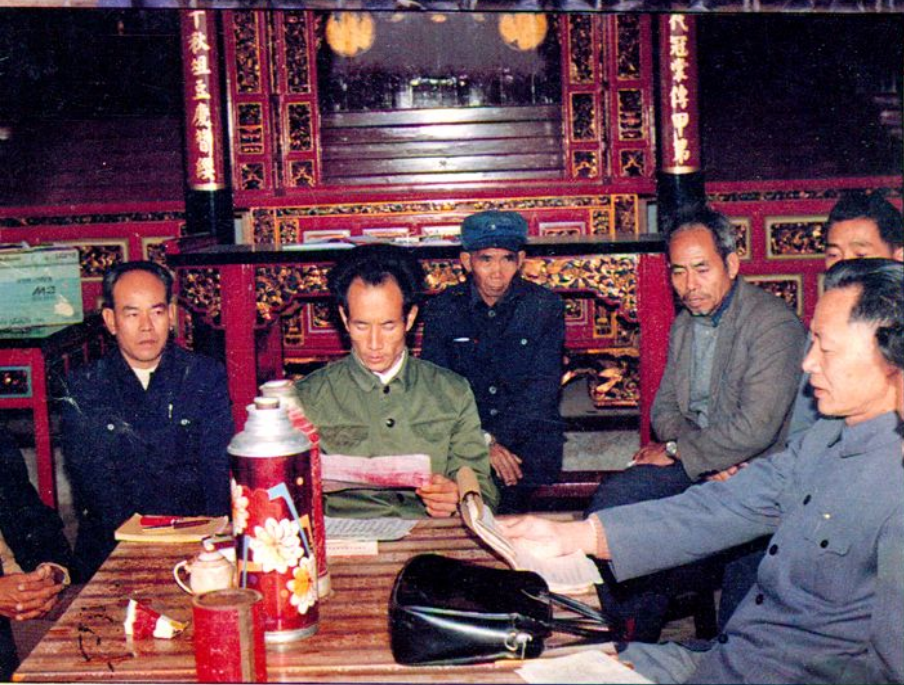
祖祠建設委員會開會場景