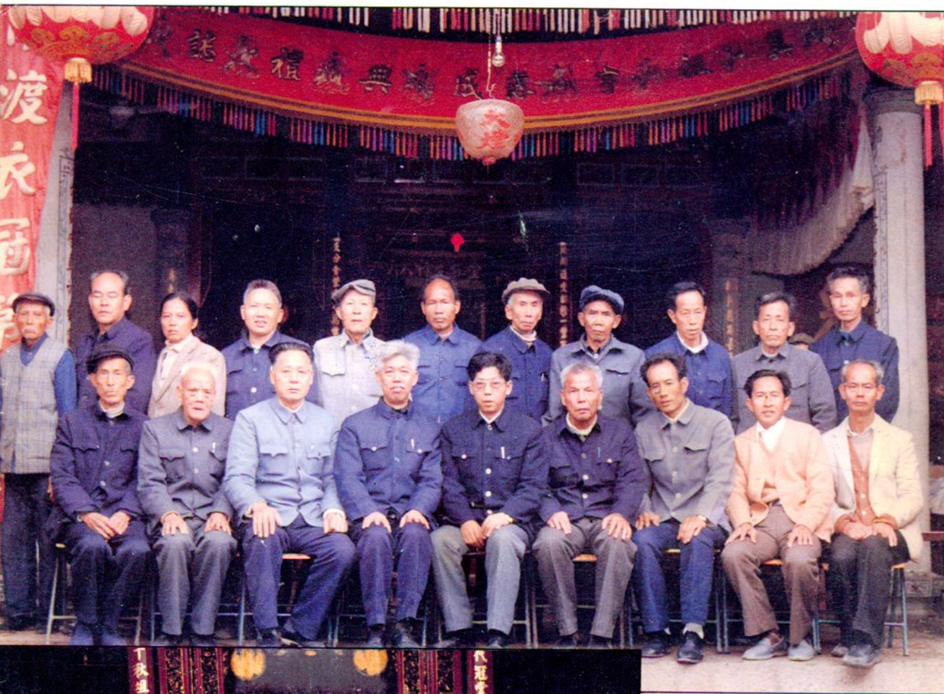
建祠委員會全體成員合影