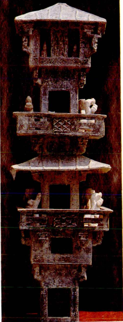
运城汉墓百戏楼模型