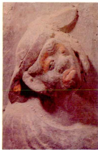
稷山马村8号金墓戏剧砖雕