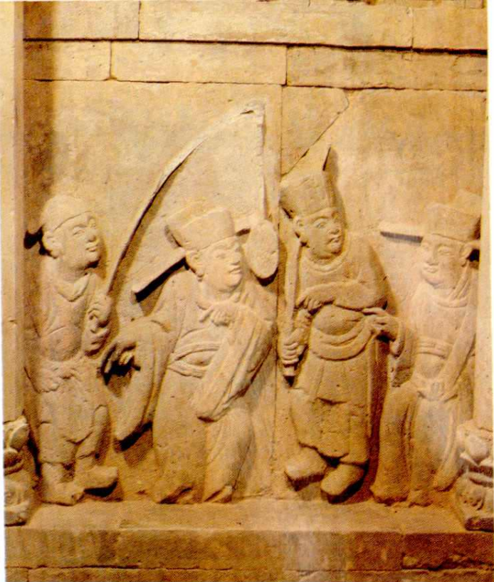
稷山马村 2 号金墓戏剧砖雕