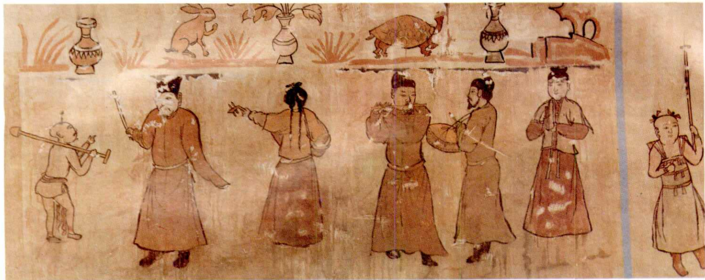
运城西里村元墓戏剧壁画