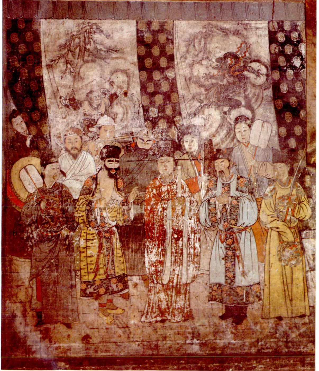
洪洞广胜寺明应王殿元代戏剧壁画