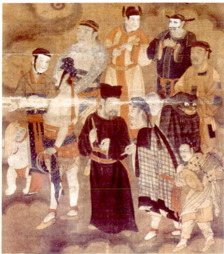
右玉宝宁寺明代水陆画中戏剧人物