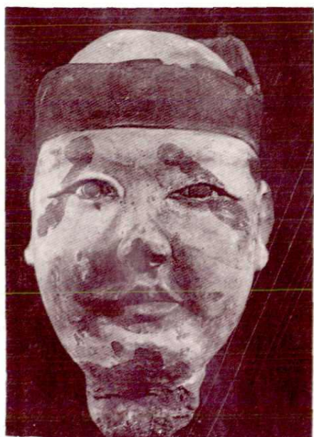
稷山马村 1 号金墓戏剧残俑