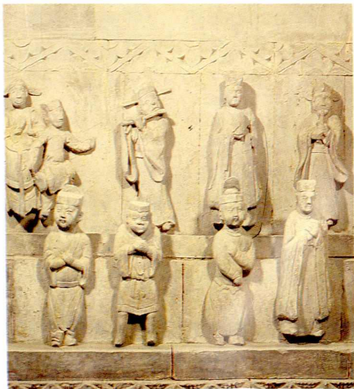
稷山马村 4 号金墓戏剧砖雕