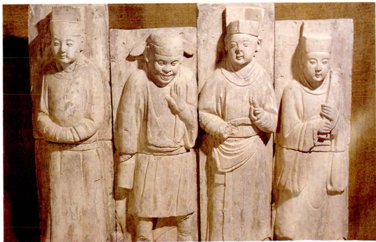
稷山苗圃金墓戏剧砖雕