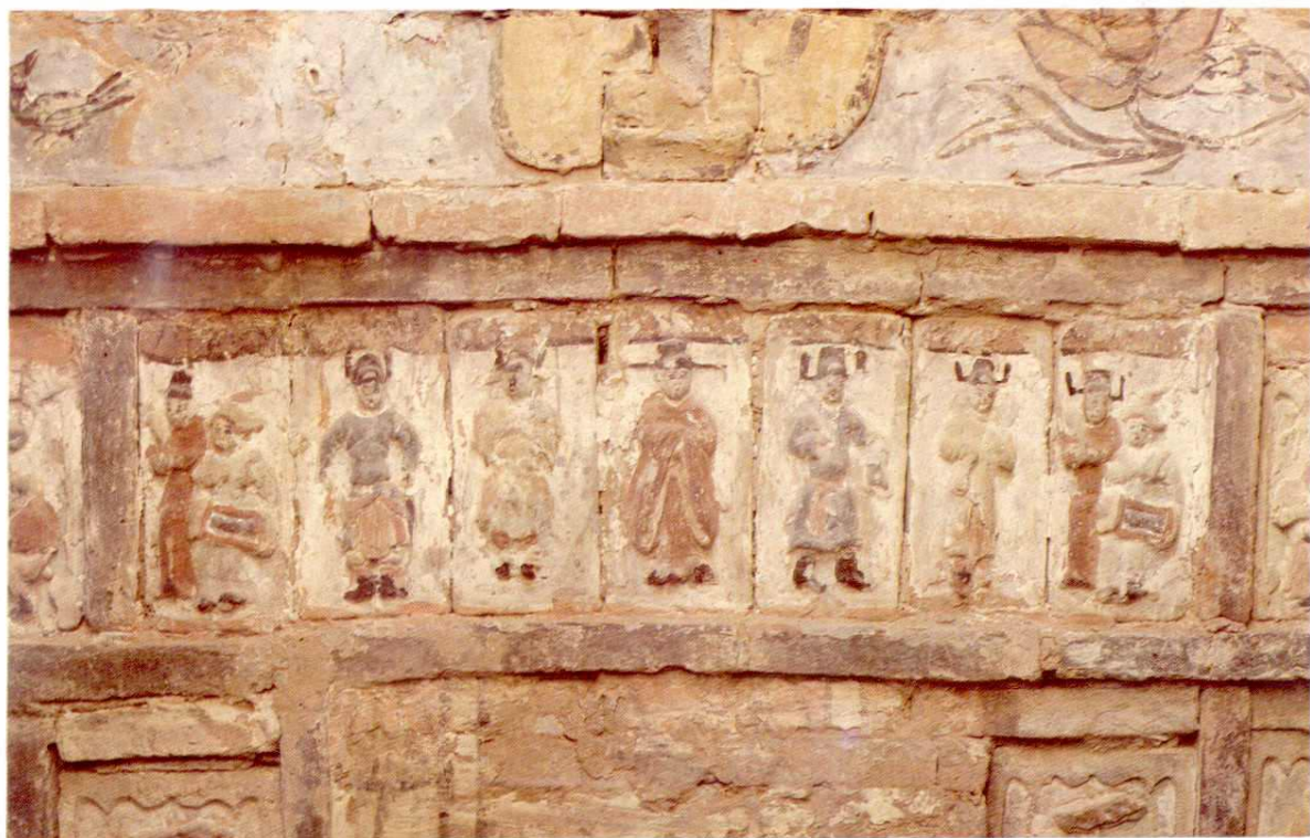
新绛吴岭庄元墓戏剧砖雕