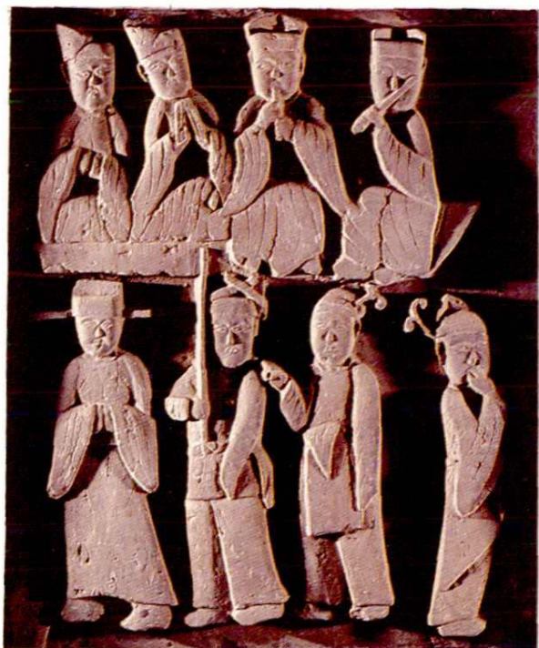
稷山马村 5 号金墓戏剧砖雕