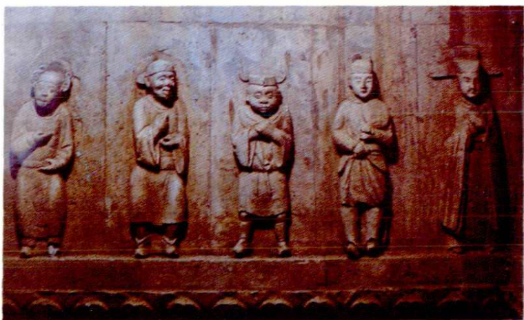
稷山化峪 2 号金墓戏剧砖雕