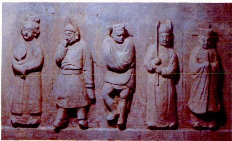
稷山化峪 3 号金墓戏剧砖雕