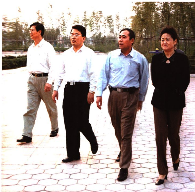
市委书记、市人大常委会主任刘慧晏（左二）视察胜利社区