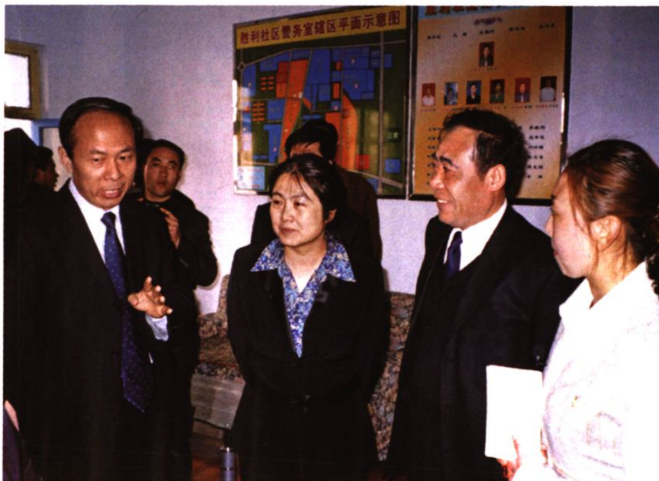
团中央领导（右三）视察胜利青年中心建设情况