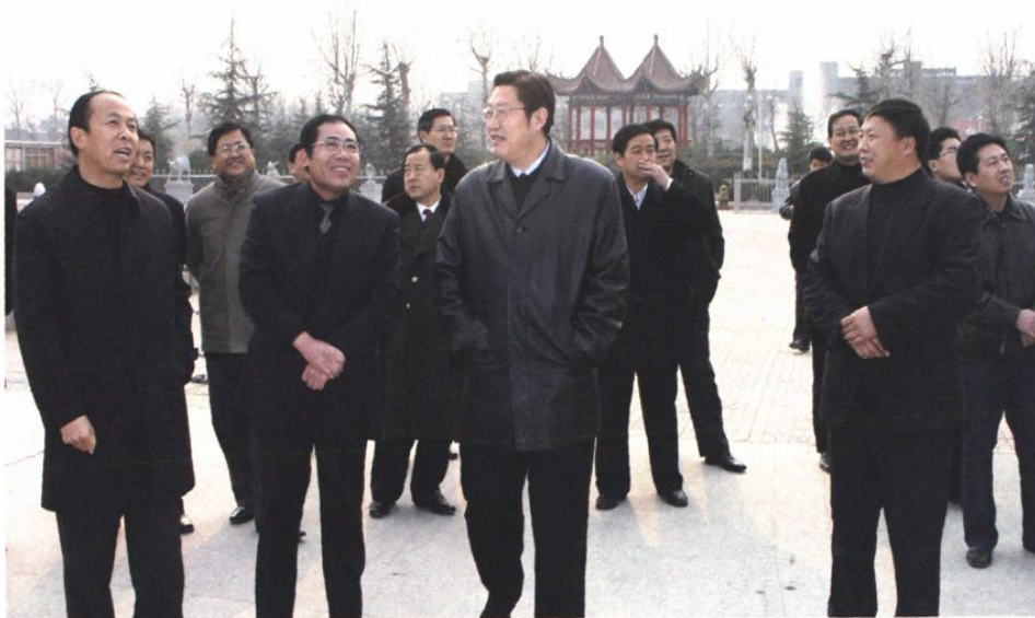
2005年12月26日市委书记、市人大常委会主任张建国在胜利社区检查工作