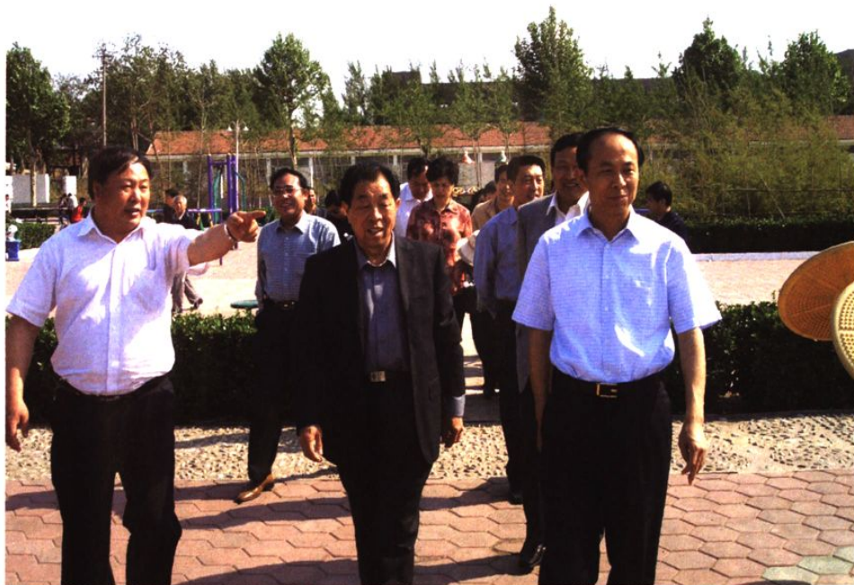
2006年5月13日省人大领导（中）视察社区工作