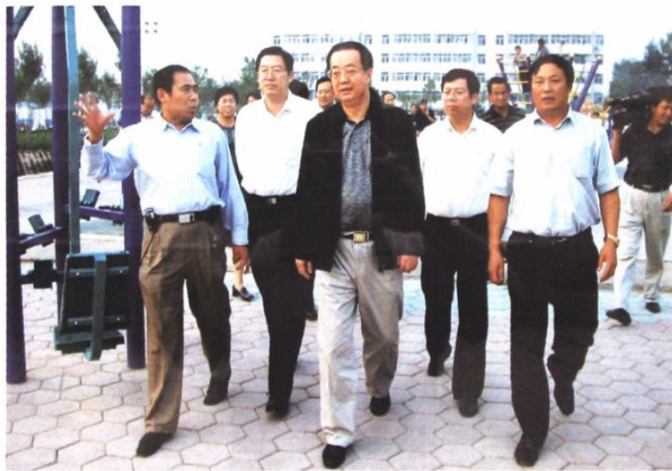
省人大常委会副主任邵桂芳（中）在胜利社区视察工作