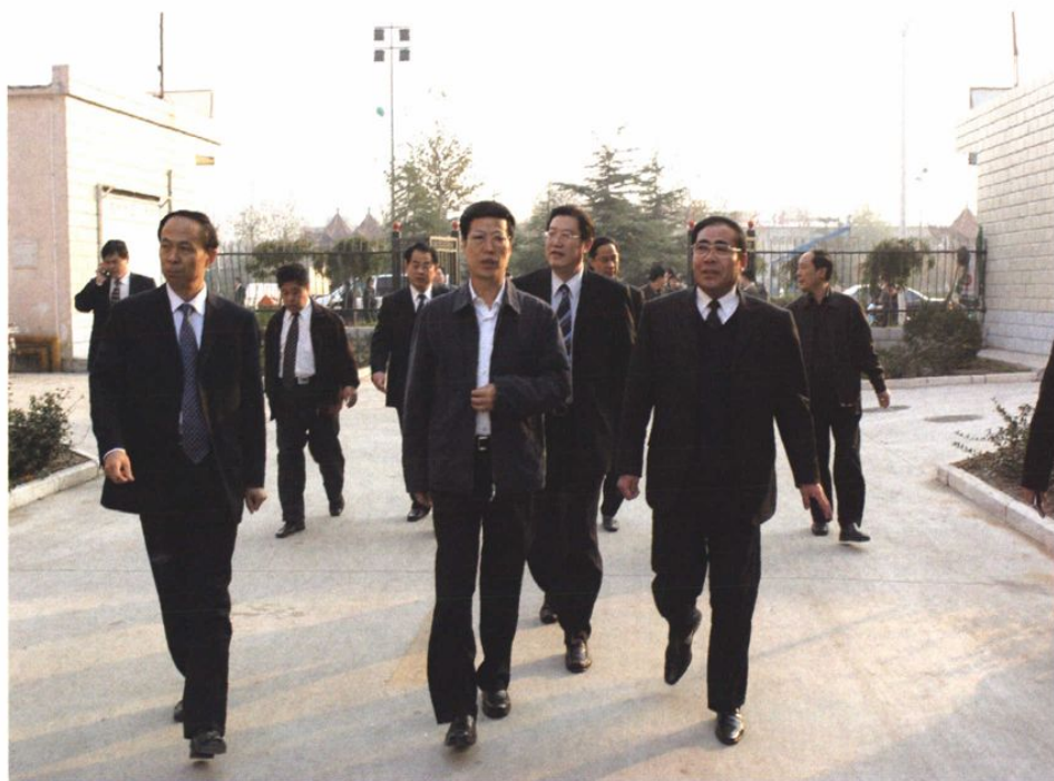
省委书记、省人大常委会主任张高丽在市区领导陪同下视察胜利广场居民生活区