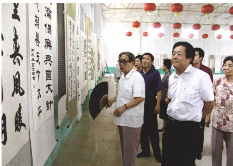
2007年7月3日原副省长马连礼（左一）在胜利社区视察工作时参观书画展