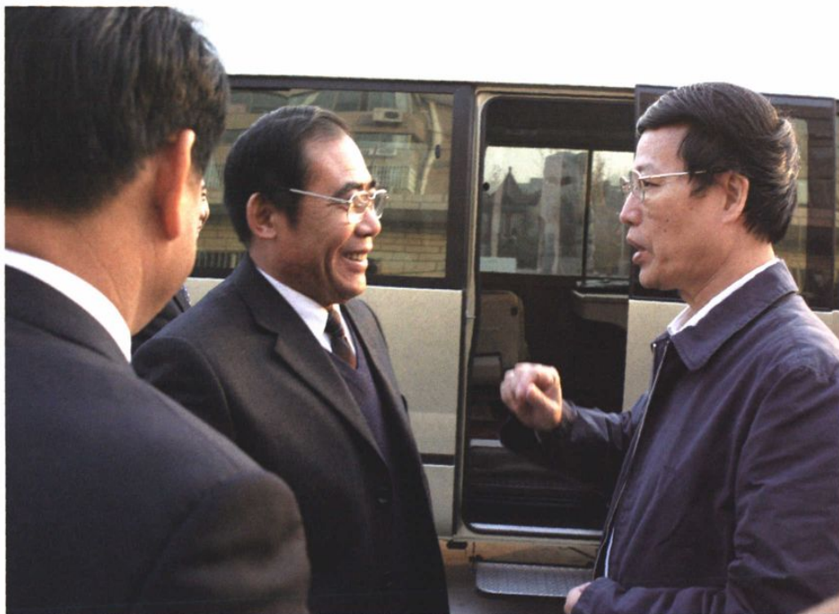
2006年11月29日省委书记、省人大常委会主任张高丽（右一）视察胜利社区时与社区领导亲切交谈