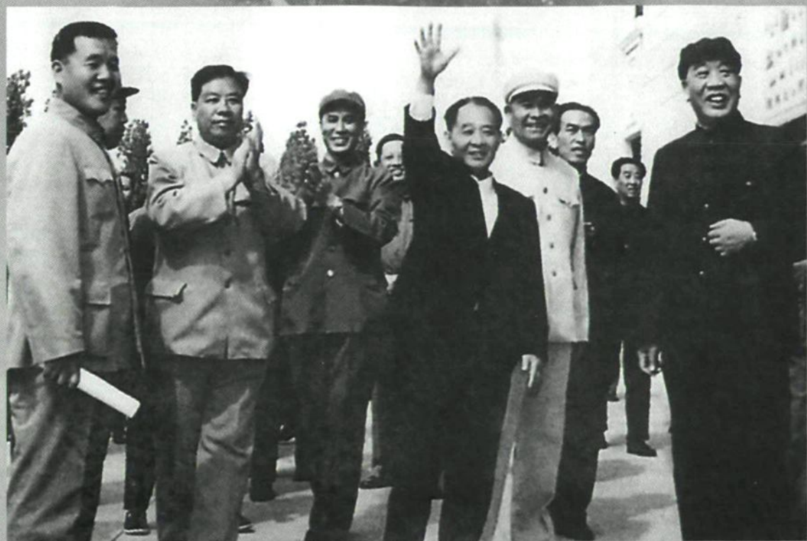
1983年5月,中共中央总书记胡耀邦(前中)视察兵团农六师五家渠垦区时强调要懂得农林牧相结合的重要性,除种粮食外,必须想办法种草种树(右一:王思茂)