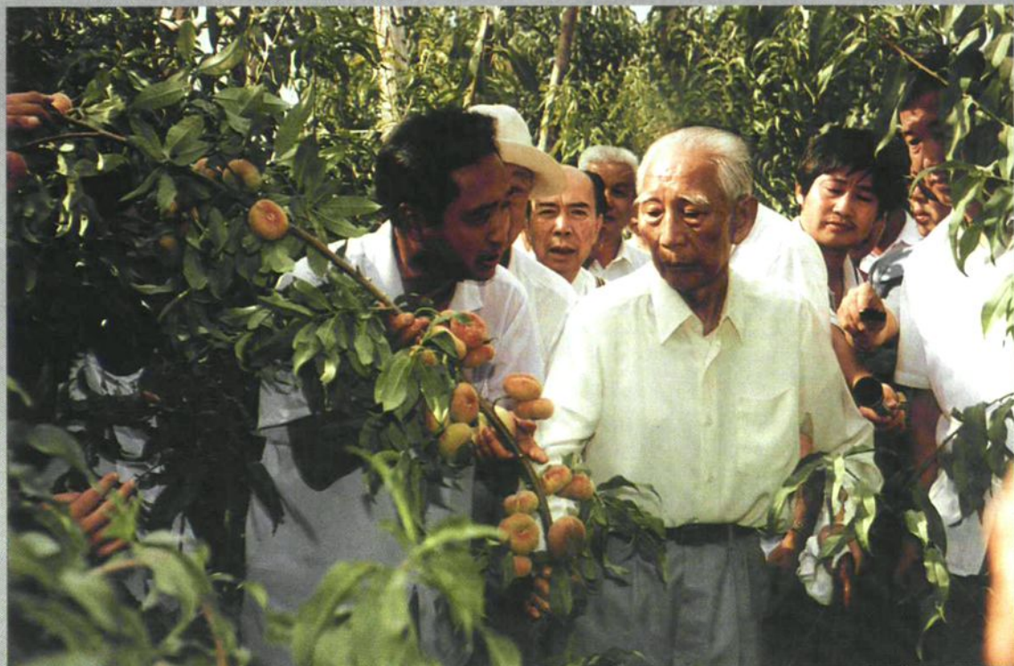
1991年8月,国家副主席王震(前中)视察石河子垦区,一四三团团团长秦昌汉(左一)陪同参观蟠桃园