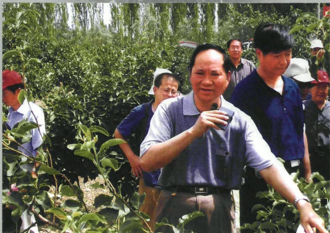
2004年6月,兵团副司令员胡兆璋(前中)在农二师二十九团香梨园检查指导矮化密植技术