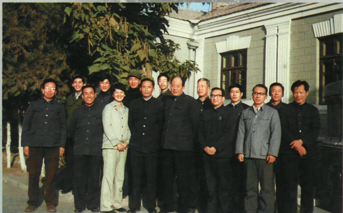
1982年10月,国家计划委员会副主任王铎(前排左四)、农林水利处处长上官长君(前排右三)率工作组,在兵团副参谋长王文喜(前排右四)陪同下考察石河子、伊犁、阿克苏、库尔勒等垦区的水利、林业建设