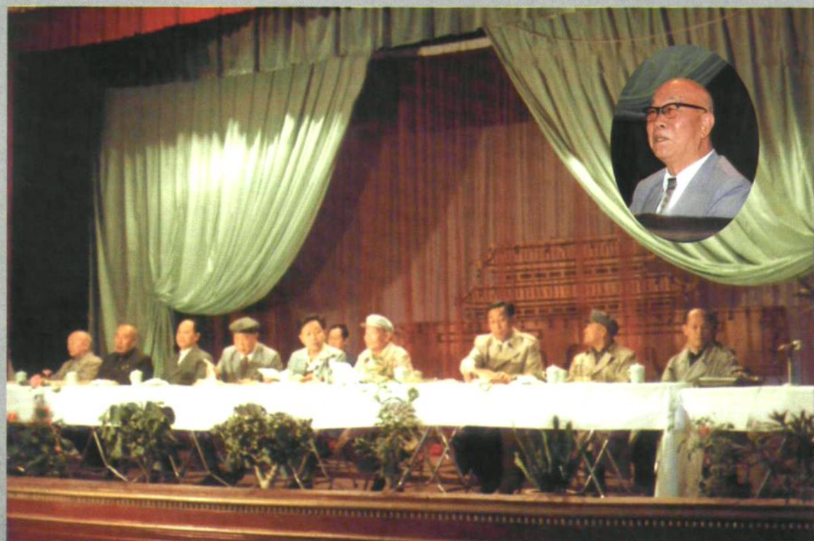
1986年9月1日,兵团边境农场经济发展工作现场会议在伊宁市农四师举行,自治区党委书记王恩茂在会上讲话