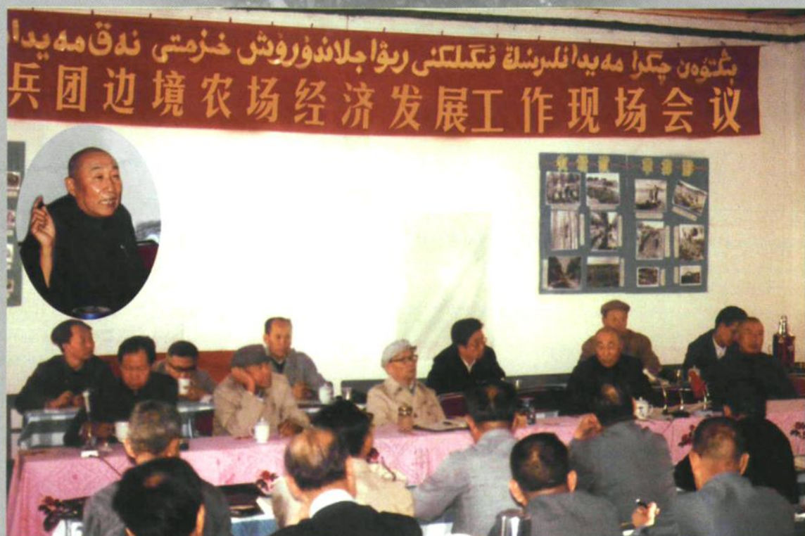
1986年8月29日,兵团边境农场经济发展工作现场会议在农四师六十四团开幕。兵团司令员陈实讲话,强调发展林业、兴办家庭林场对农场经济发展,职工致富的重要性