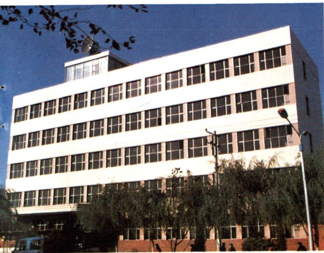
▲ 东方红百货大楼 ▲ 邮电大楼