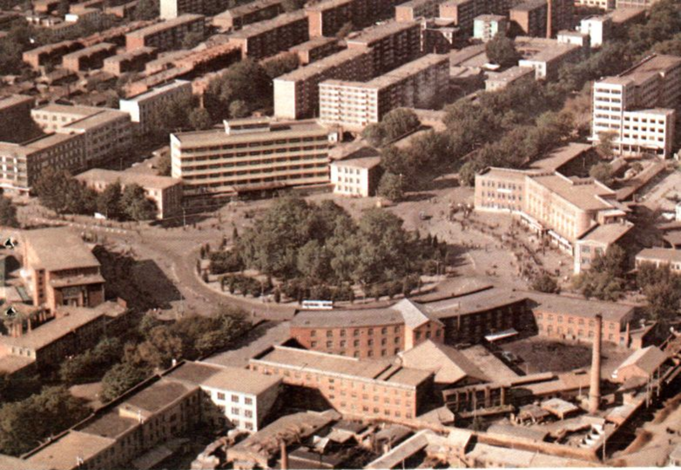
朝阳市中心——转盘街