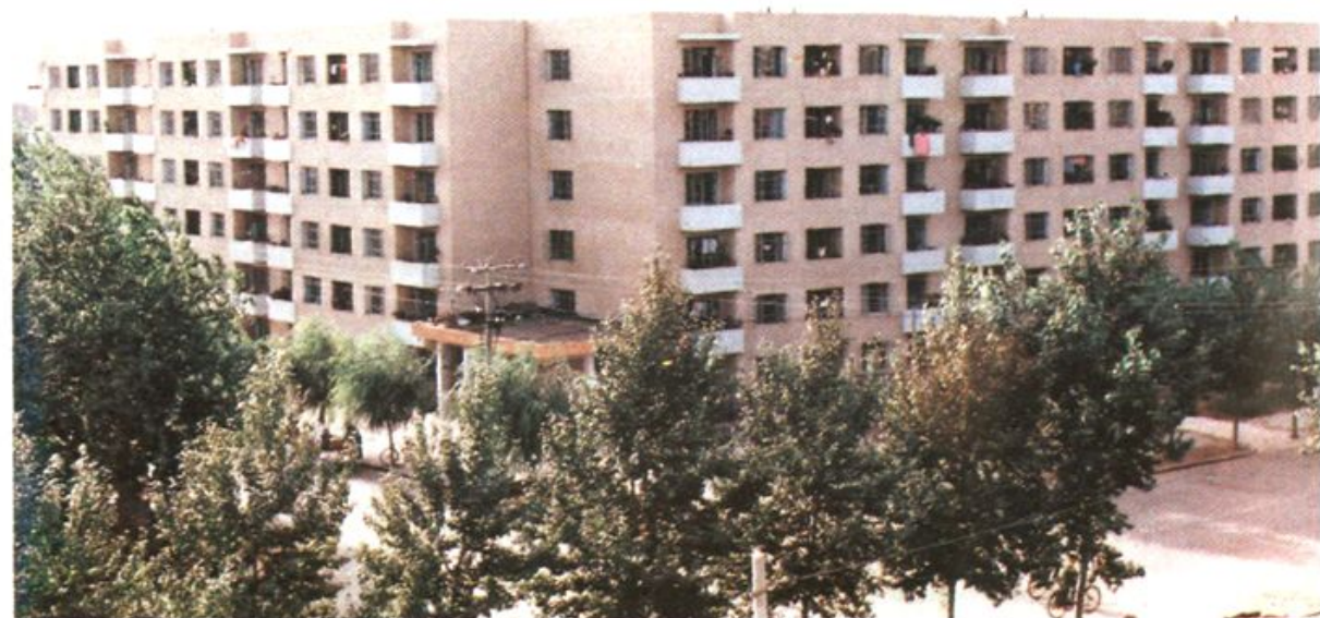
辽化十区26号住宅楼