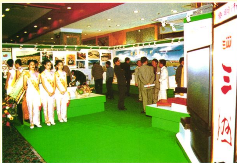
1999年高明市 举办招商会