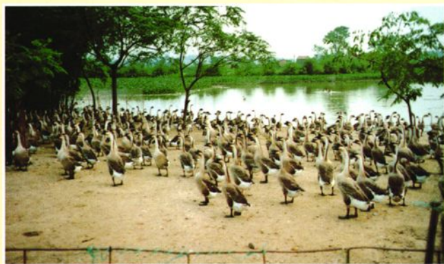
享誉海外的三洲黑鹅