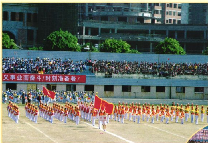
每年端午节的龙 舟赛活动