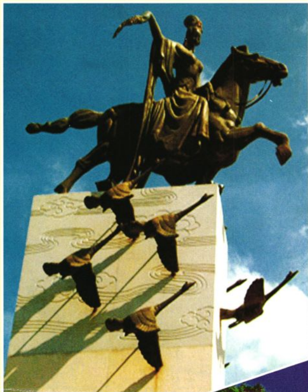
大型雕塑“牧鹅仙女”座落在三洲区的高明大道口