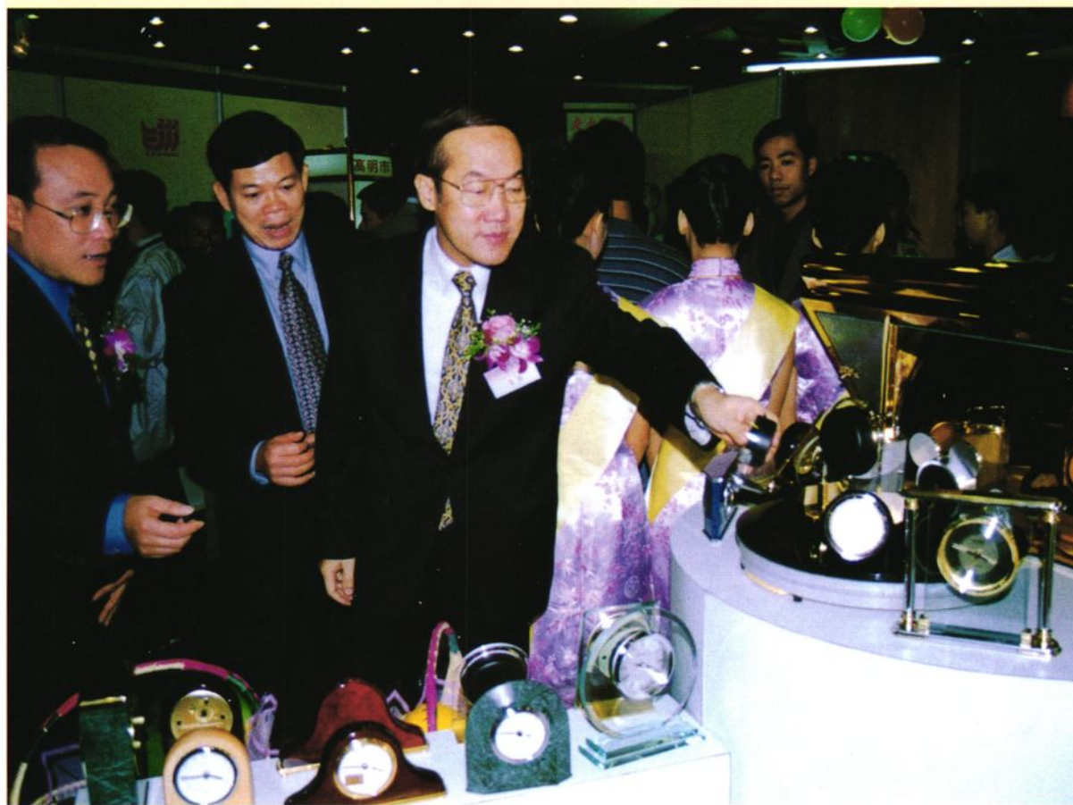
佛山市市长梁绍棠视察我区展品