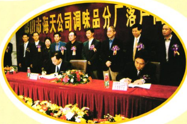
2002年11月7日下午,在三洲区隆重举行佛山市海天公司调味品分厂落户沧江工业园签约仪式