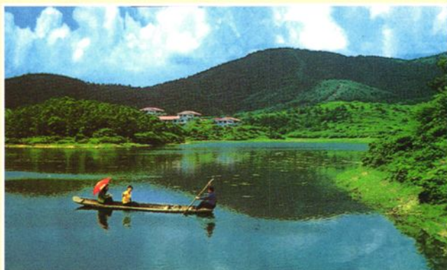
风景优美的黎峡坪水库