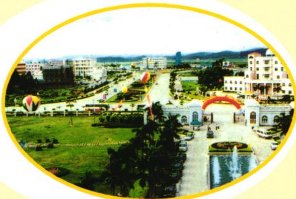
沧江工业园东园 (三洲区域)一角