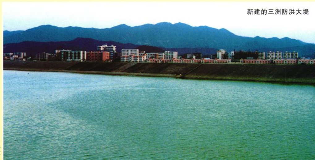
新建的三洲防洪大堤