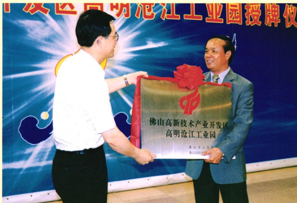
佛山高新技术产业开发区高明沧江工业园授牌仪式