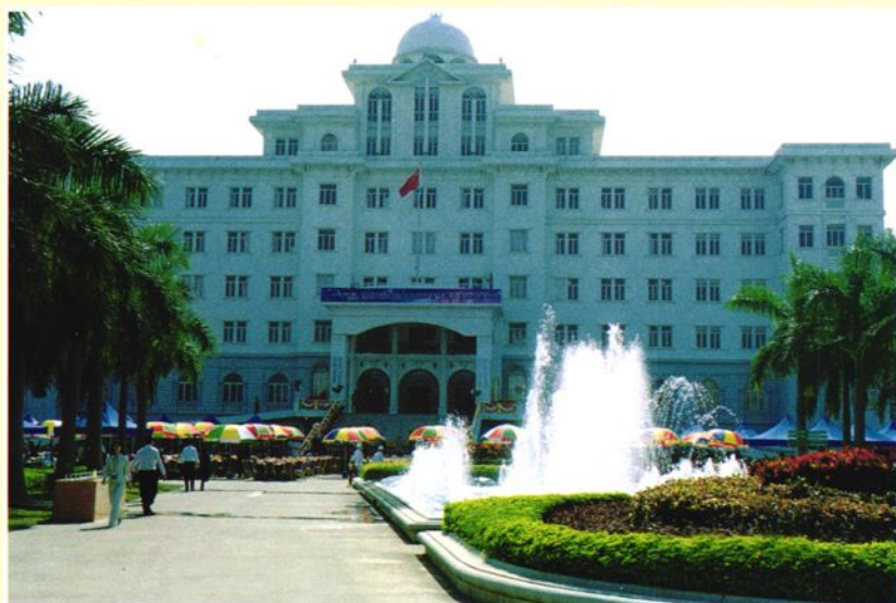
三洲区新办公大楼