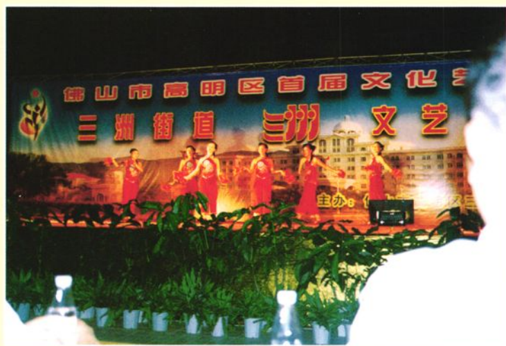
举办首届文化艺术节