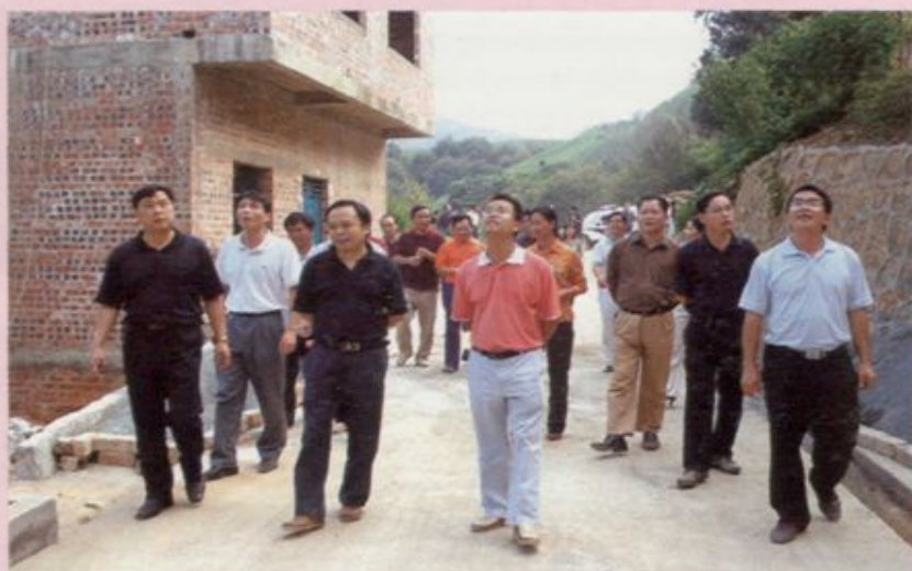
领导视察新农村建设