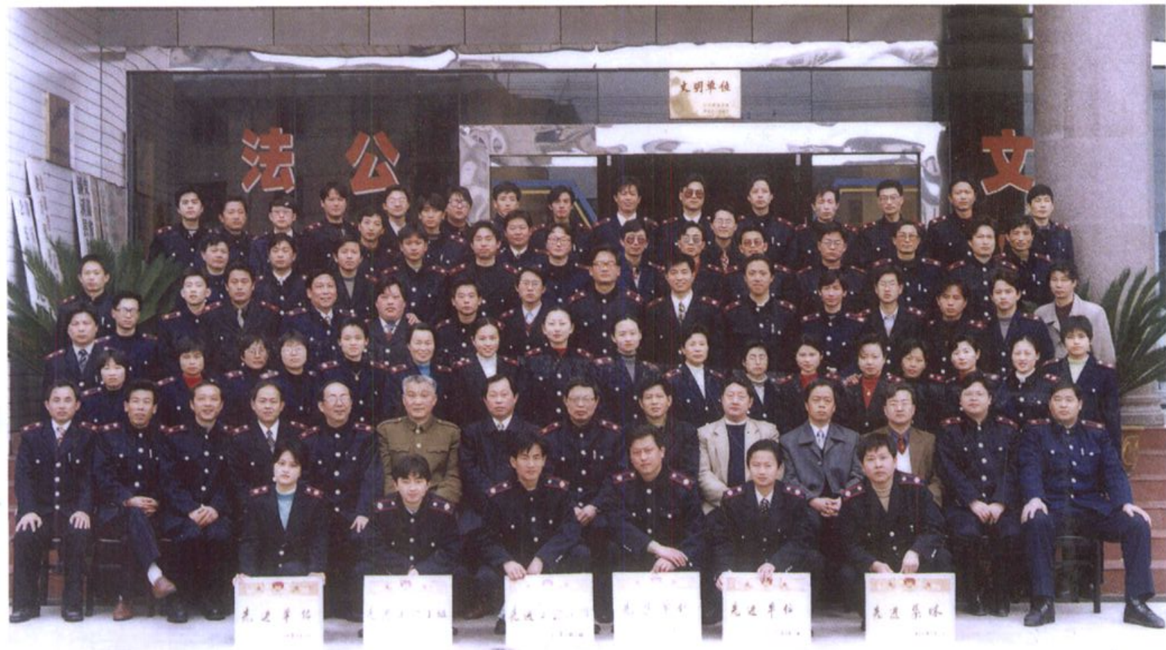
1999年绩溪县地税工作会议与会人员合影