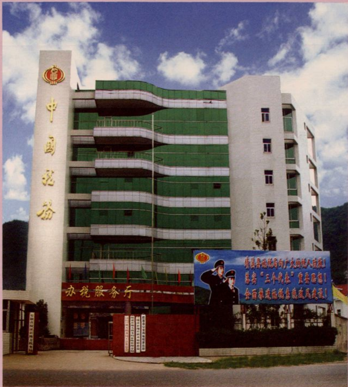
图为改造前的地方税务局办公大楼。该楼于1996年动工兴建，为7层全框架结构，建筑面积2480平方米。县局机关于1997年11月8日搬进大楼办公。