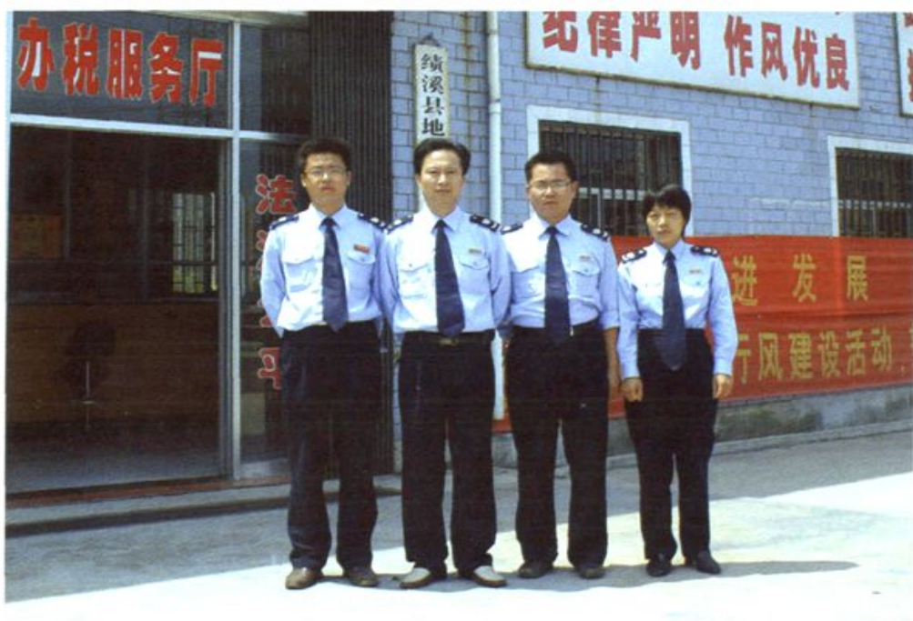
绩溪县地税局临溪分局