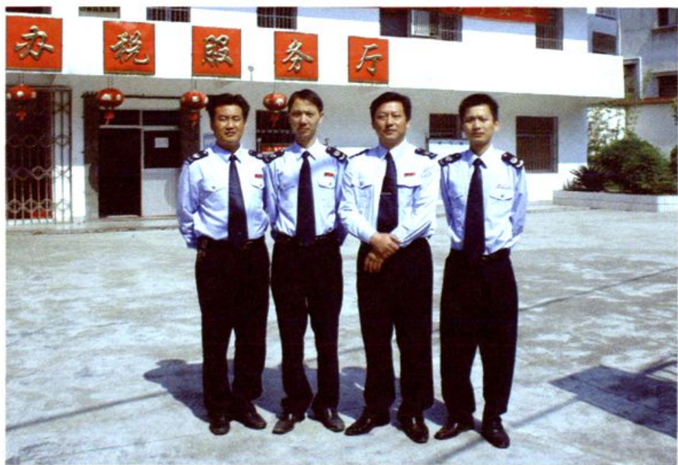
绩溪县地税局长安分局