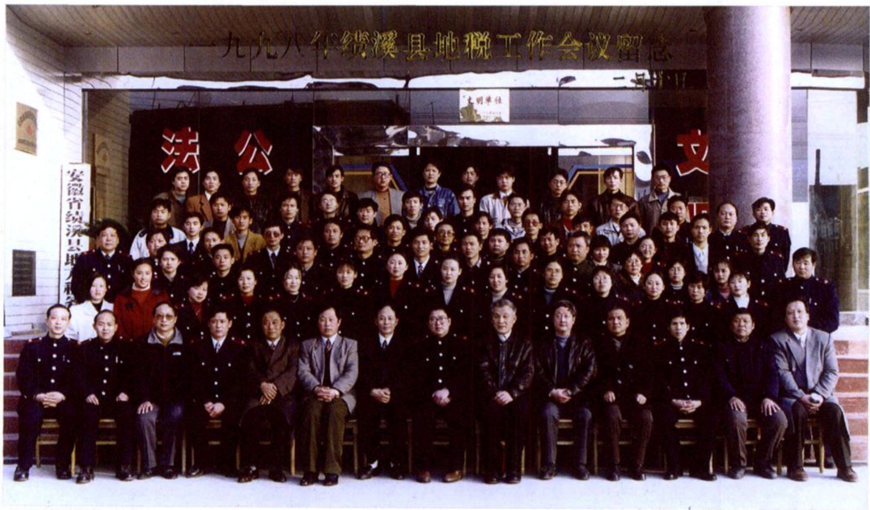
1998年绩溪县地税工作会议与会人员合影