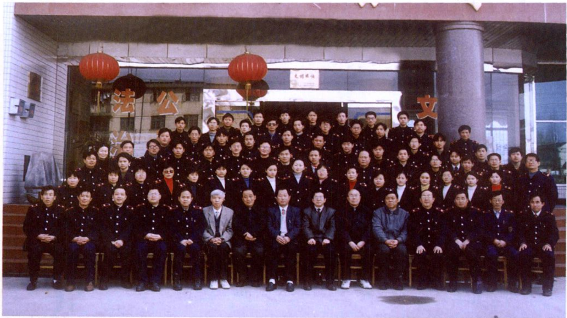
2000年绩溪县地税工作会议与会人员合影