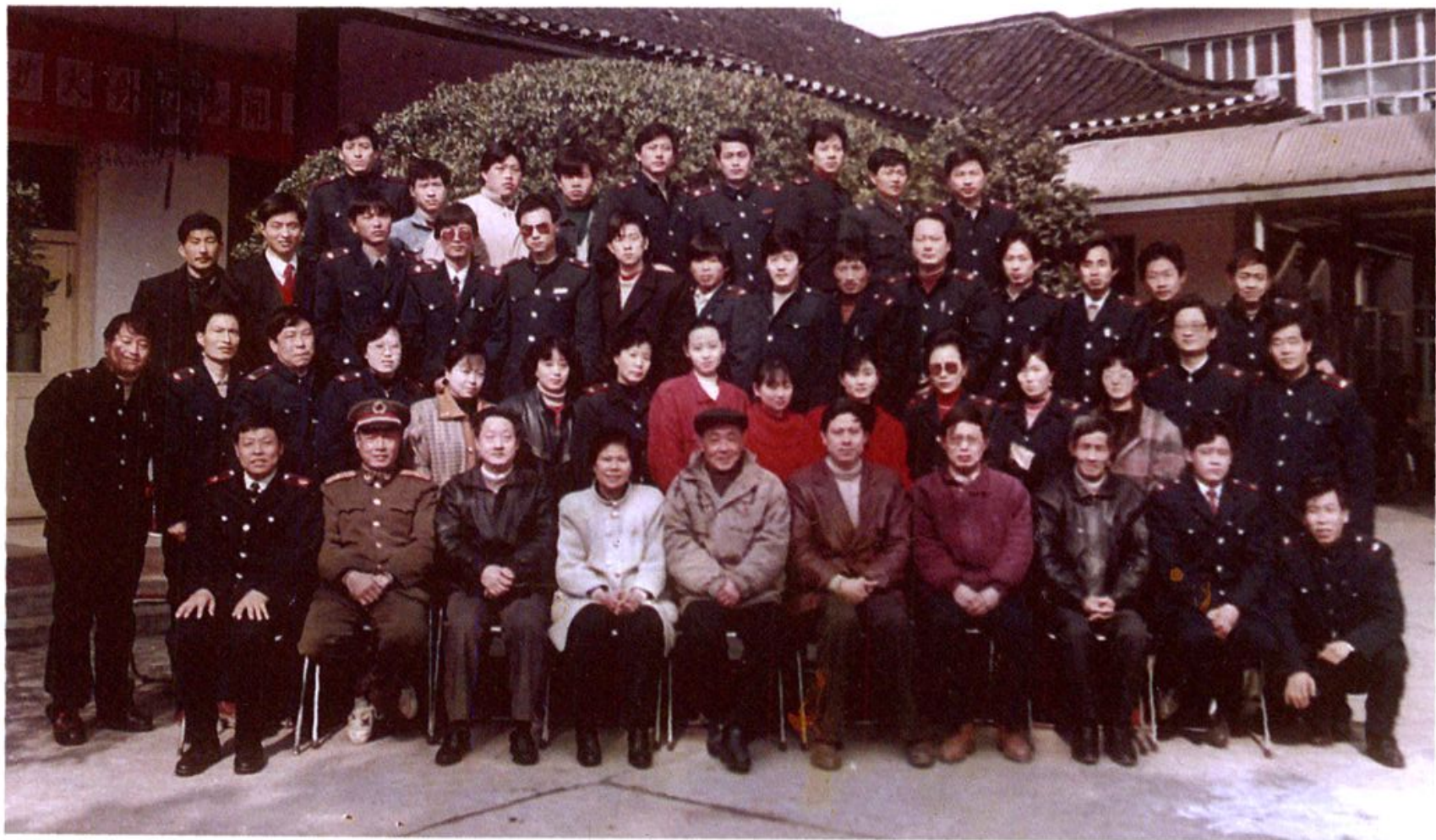
1995年绩溪县地税工作会议与会人员合影