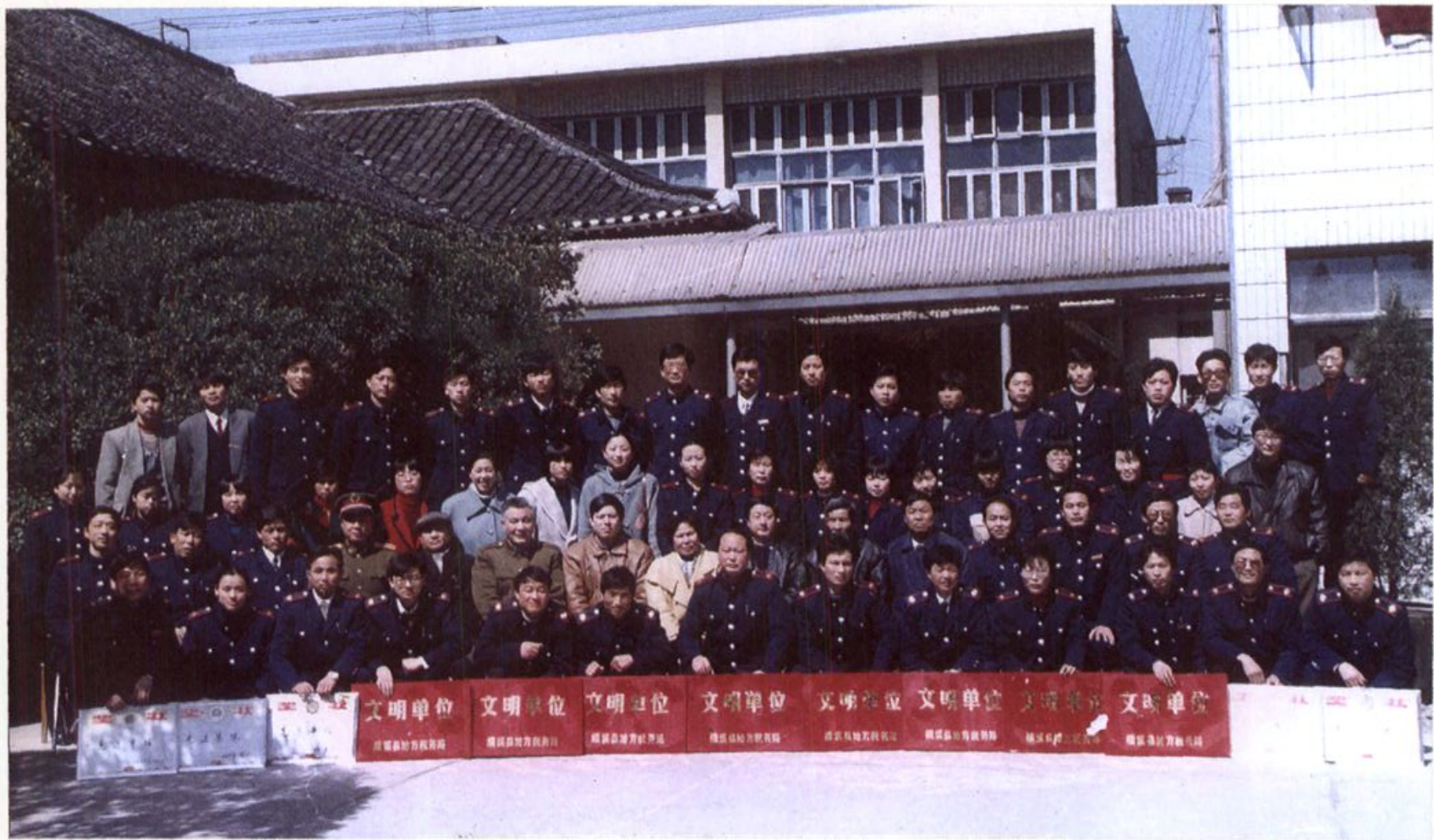
1996年绩溪县地税工作会议与会人员合影