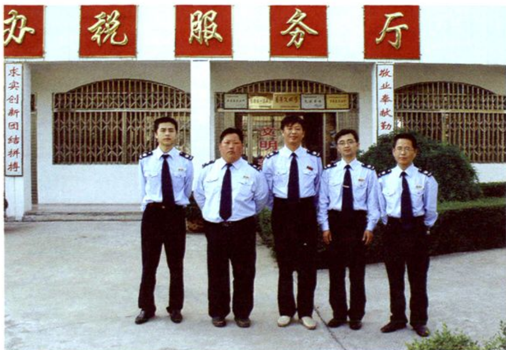
绩溪县地税局扬溪分局