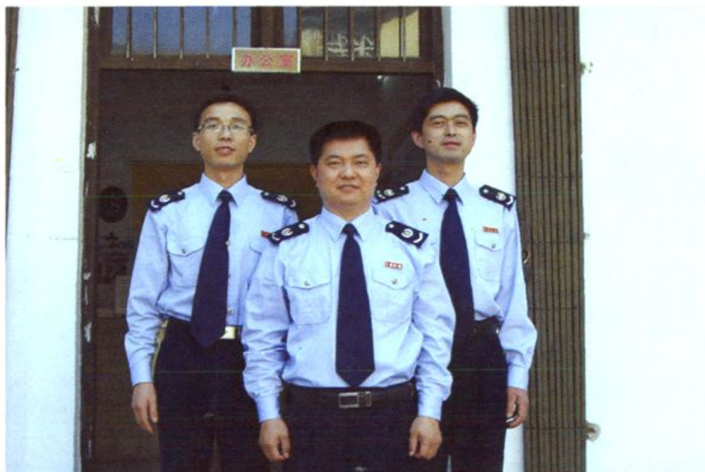
绩溪县地税局伏岭分局