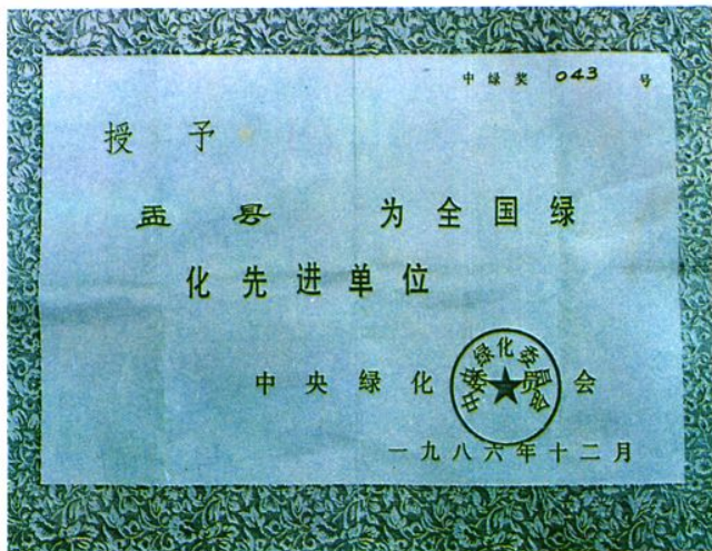
中央绿化委员会授予孟县为 全国绿化先进单位

驻阳泉部队官兵每年都积极参加义务植树,至1987年底已累计造林17万株。图为解放军某部驻阳泉军营绿化一角