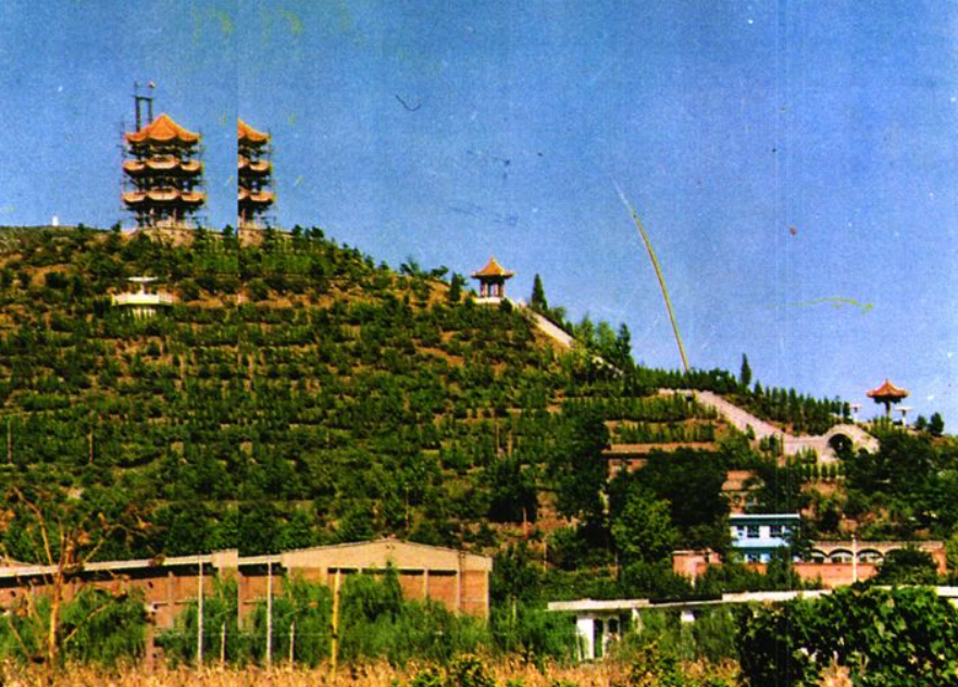
生活富裕,促进了人们环境美的追求。图为建设中的冶西镇农民森林公园