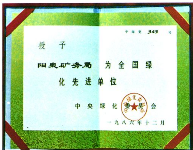
中央绿化委员会授予阳泉矿务局为 全国绿化先进单位