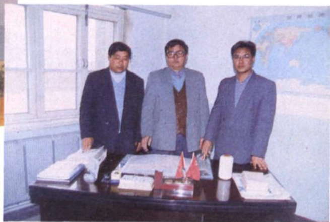
▶ 旗交通局领导班子成员在规划全旗公路建设网络