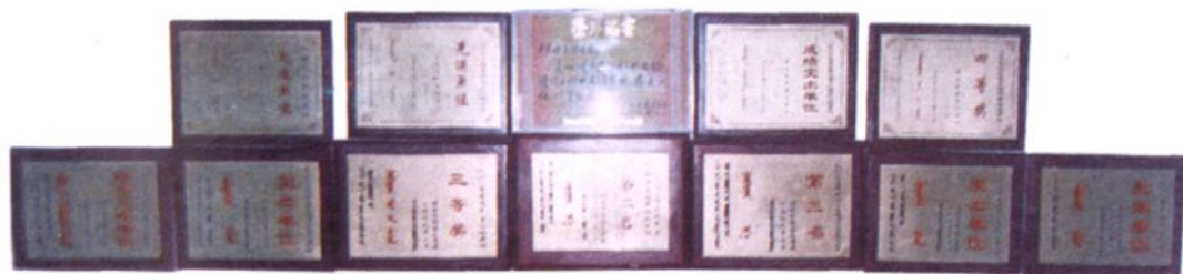
▲旗交通局荣获的奖牌、奖匾