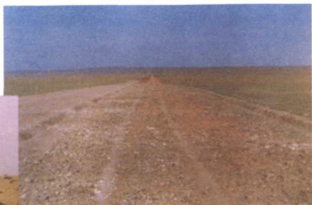
▲ 定线后的草原简易公路