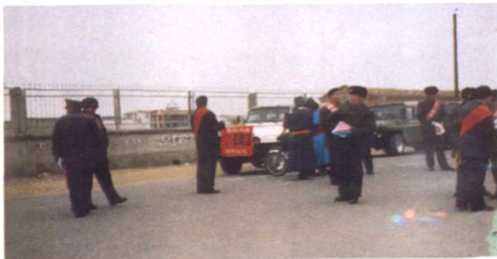
▶ 交通单位在街头宣传《公路法》