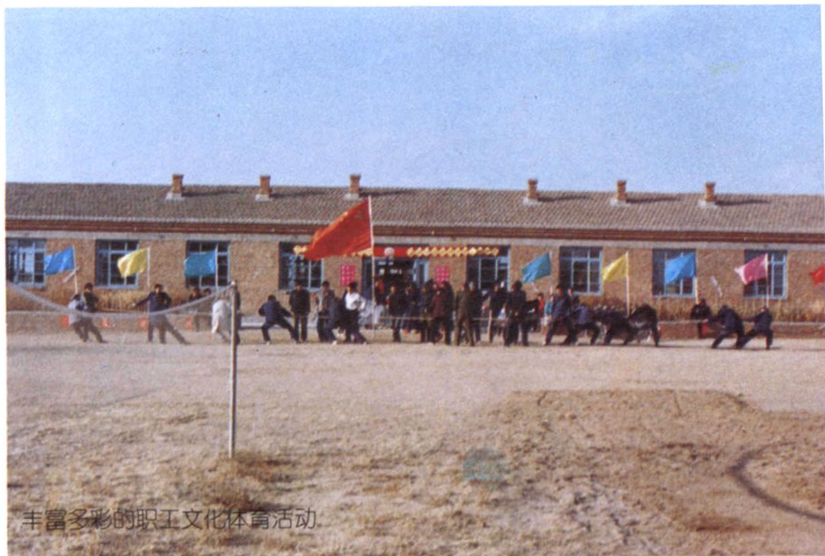
丰富多彩的职工文化体育活动