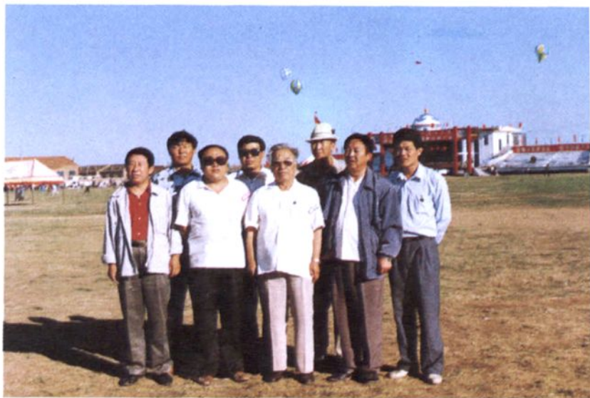
◀ 旗委、政府、政协领导同志在全旗苏木公路建设工作会议上