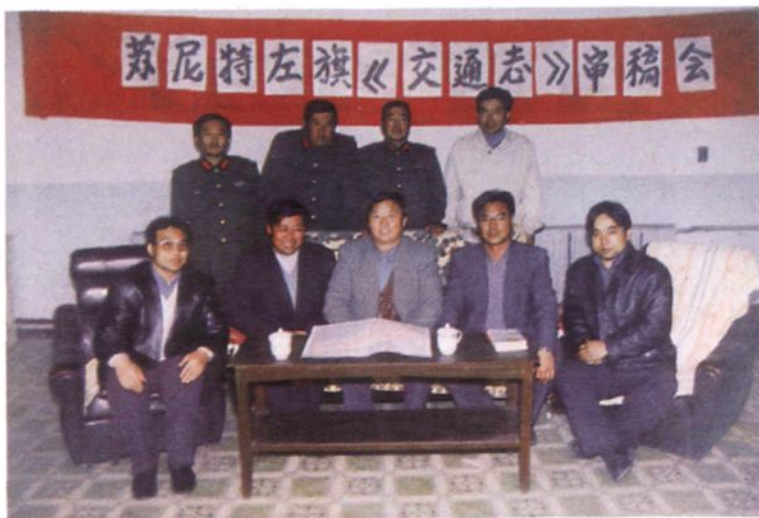
◀ 交通志编审人员 在审稿会上