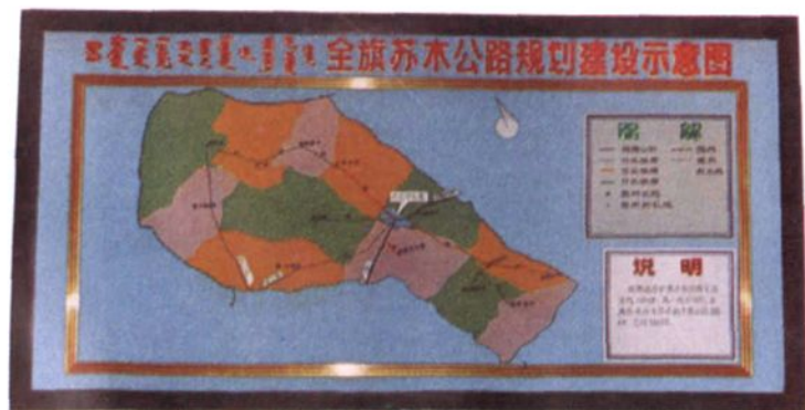
▶ 旗交通局领导班子成员在规划全旗公路建设网络