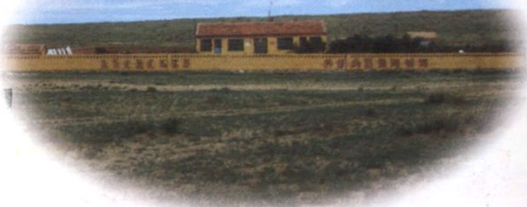
▶ 座落在呼霍线上的 乌兰淖道班全貌