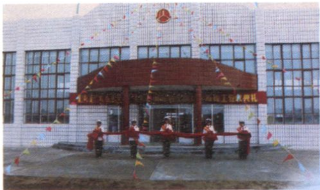
◀ 苏尼特左旗新落成的汽车站