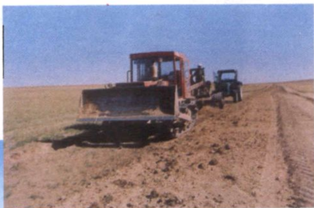
▶ 施工机械在草原定线路上作业