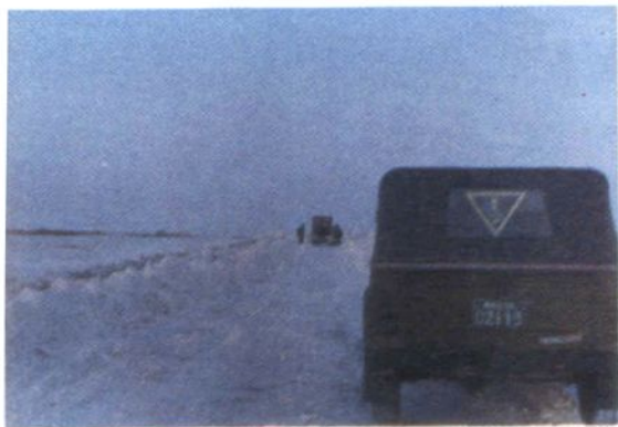
◀ 公路养护人员清除道路雪阻