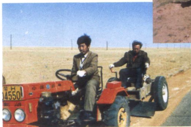
◀ 养路工人进行路肩养护生产作业