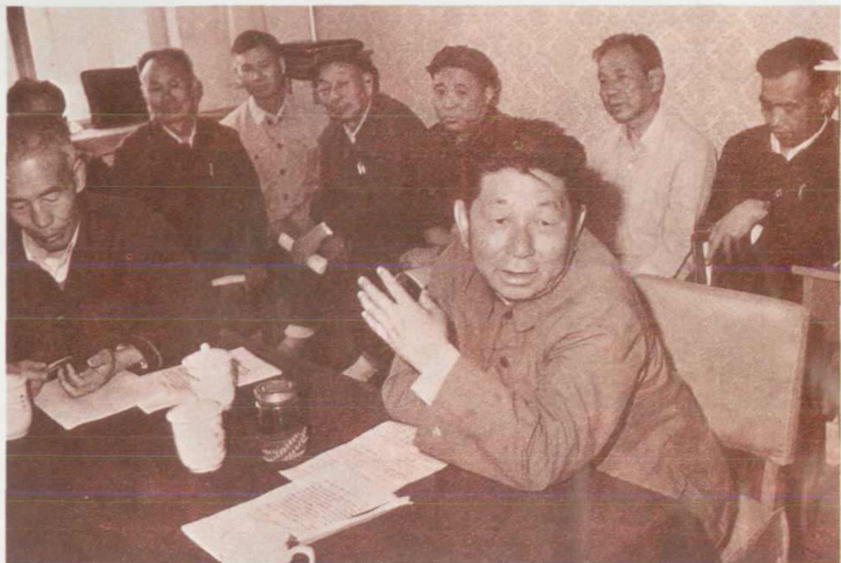
甘肃省委书记李子奇在油田汇报会上作指示（1984年）