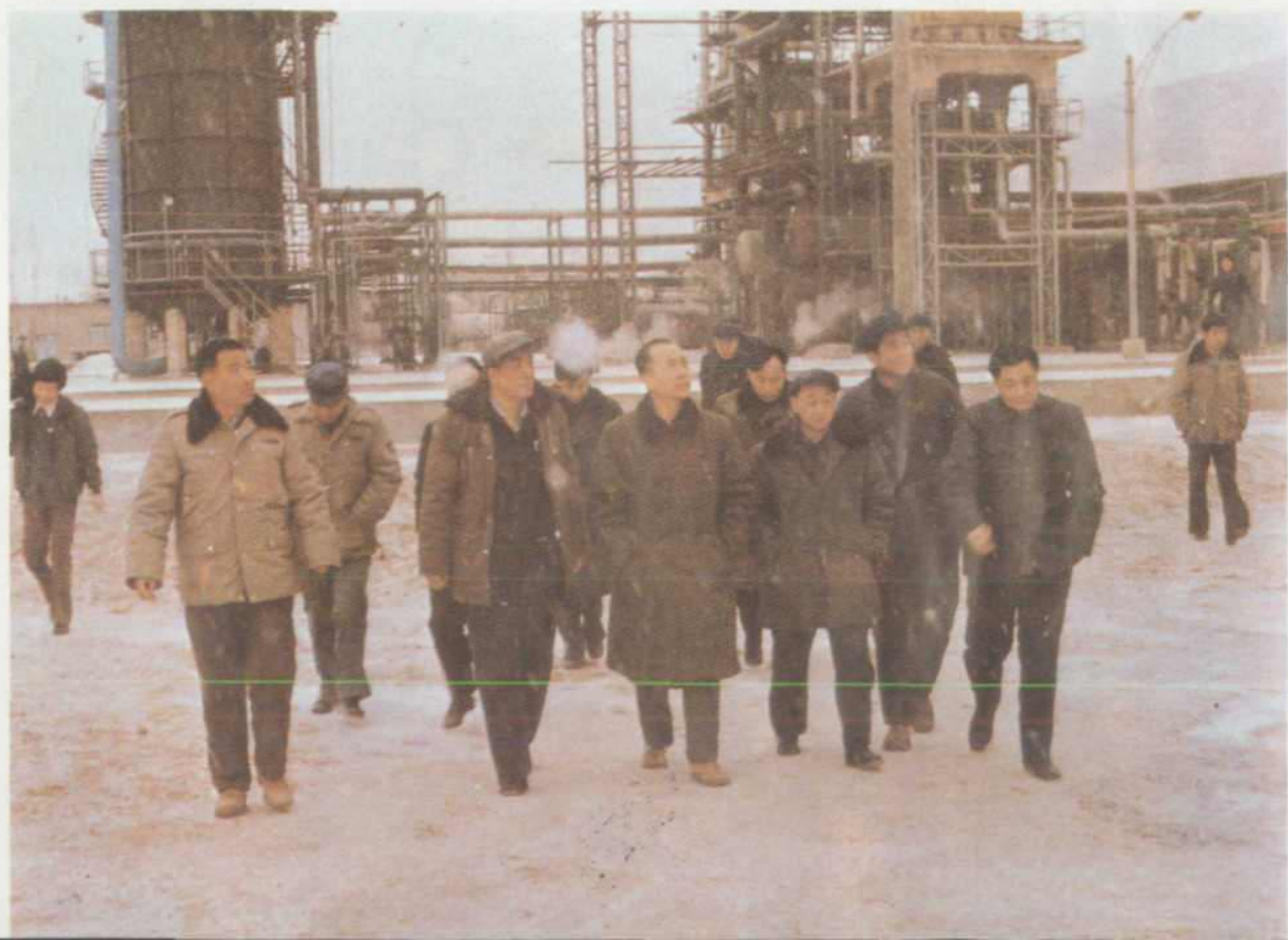
甘肃省省长陈光毅视察马岭炼油厂（1985年）