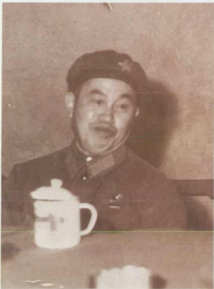
兰州军区司令员皮定 均到油田检查工作（1971 年）