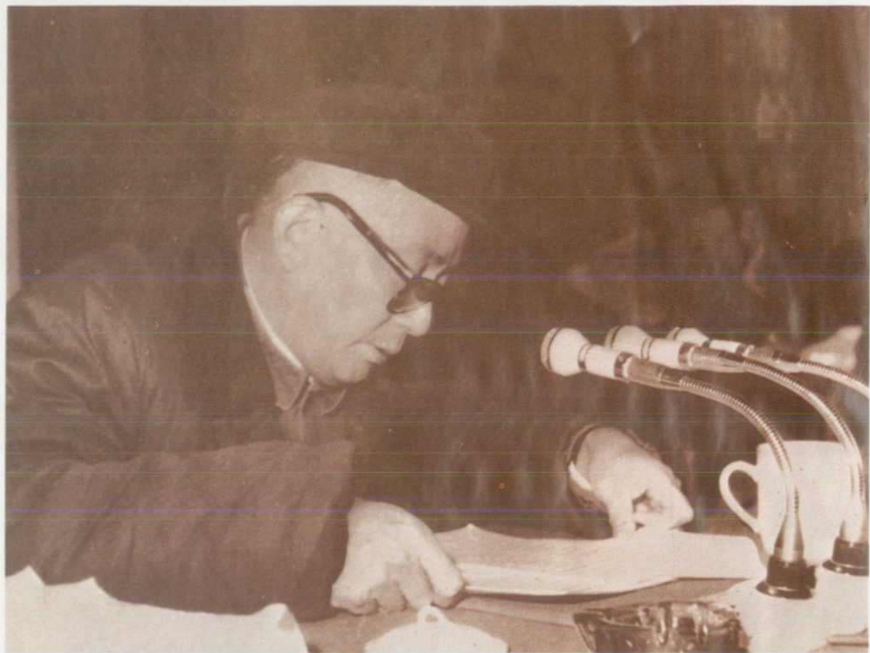
石油部副部长唐克在 陕甘宁石油会战协作会议 上讲话（1970年）