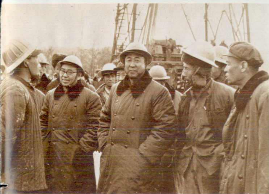
石油部部长宋振明 在钻井队检查工作 (1977 年)