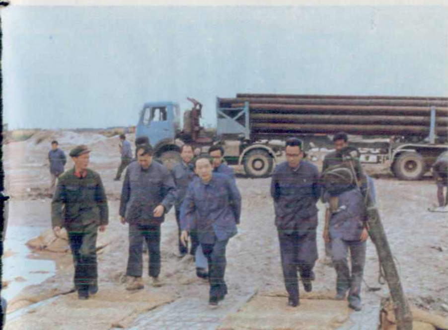
石油部副部长李天 相在“抢修穿黄输油管 道”工地检查工作（1983 年）