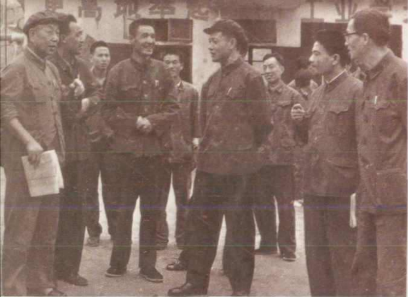
石油部副部长闵豫来 油田检查工作（1978年）