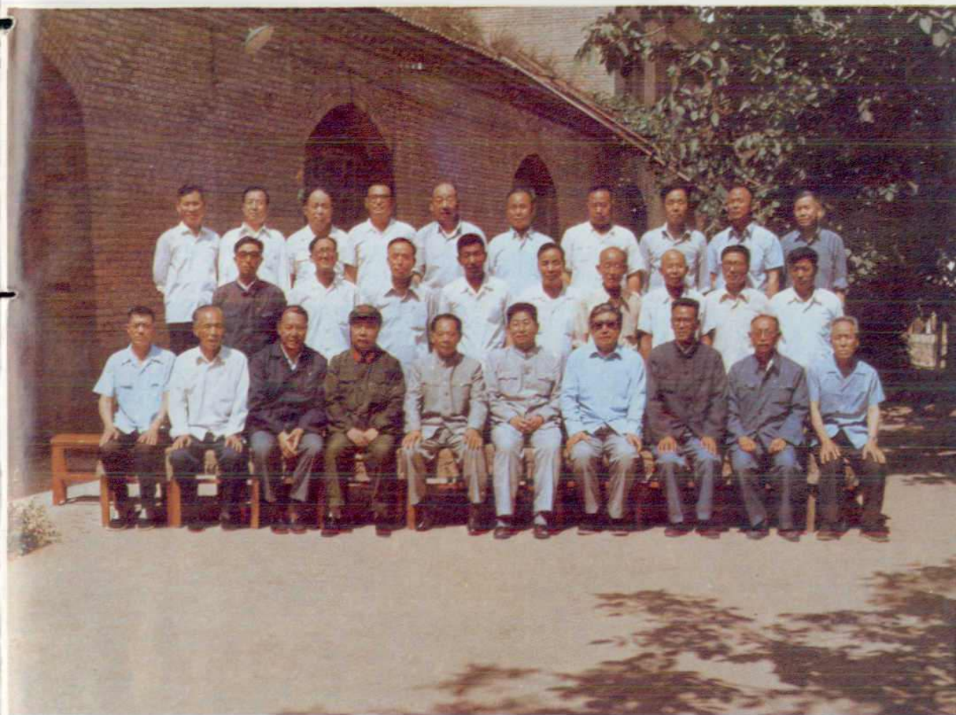
1983年7月20日中共中央总书记胡耀邦（前左五），全国政协副主席、中央统战部部长、国家民族委员会副主任杨静仁（前左七），全国政协副主席、兰州军区政委肖华（前左四），以及甘肃省委书记李子奇（前左六）等来油田视察时与油田干部合影