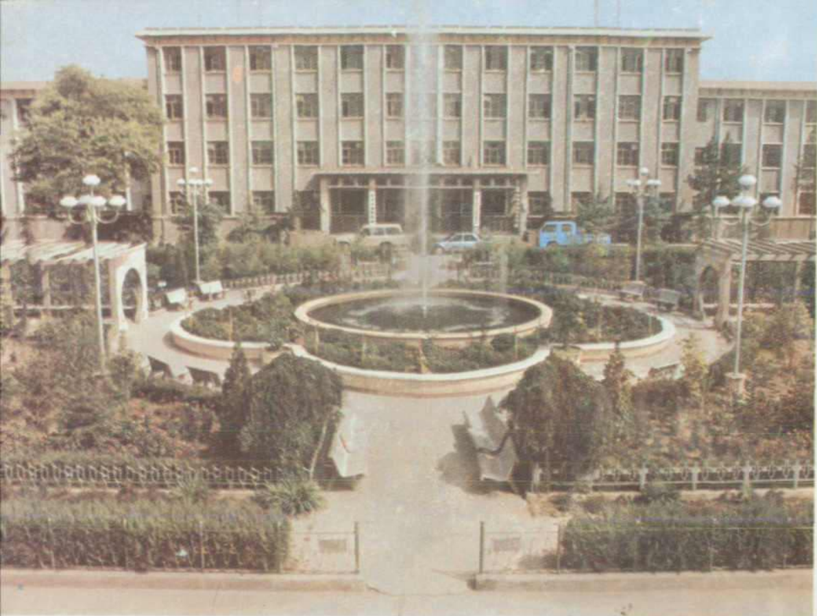
勘探局机关办公大楼