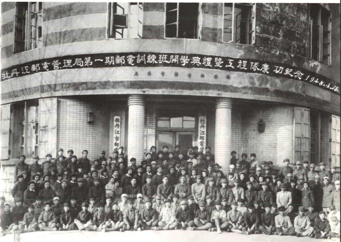
第一期邮电训练班开学典礼暨工程队庆功纪念