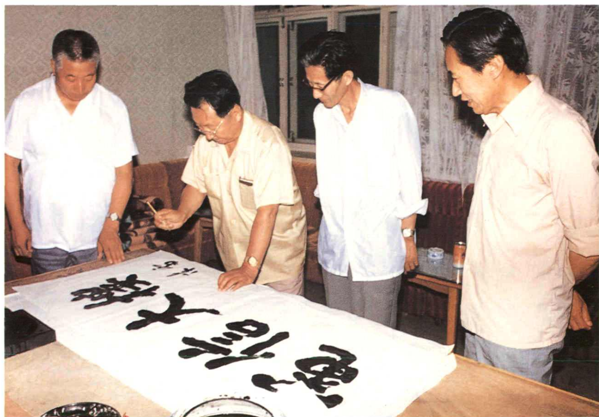
原黑龙江省省长陈雷为电信大楼题字