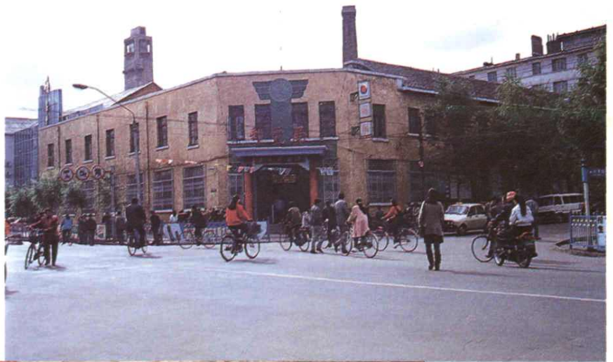
东北沦陷时期建造的邮政楼