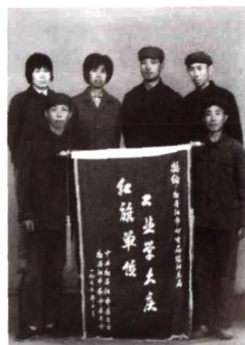
工业学大庆红旗班组