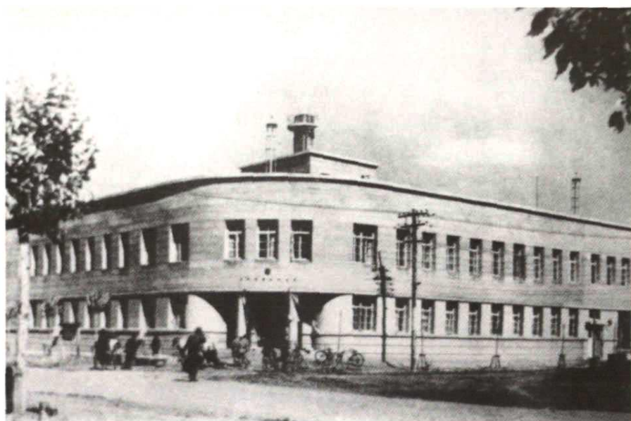
1936年建成的牡丹江电报电话局