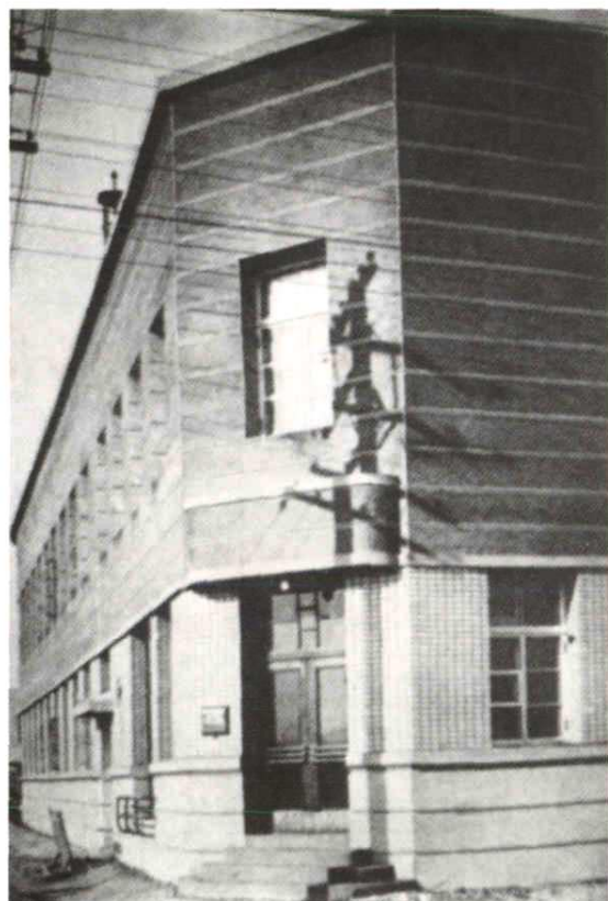
东北沦陷时期的牡丹江放送局