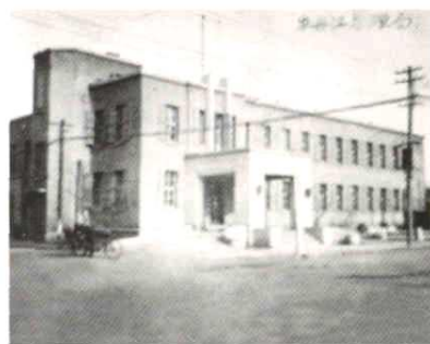
牡丹江市邮电局旧址