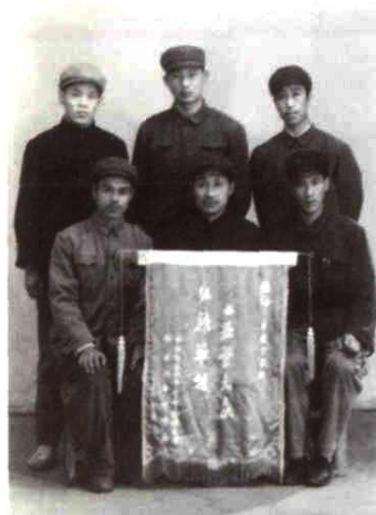
工业学大庆红旗班组