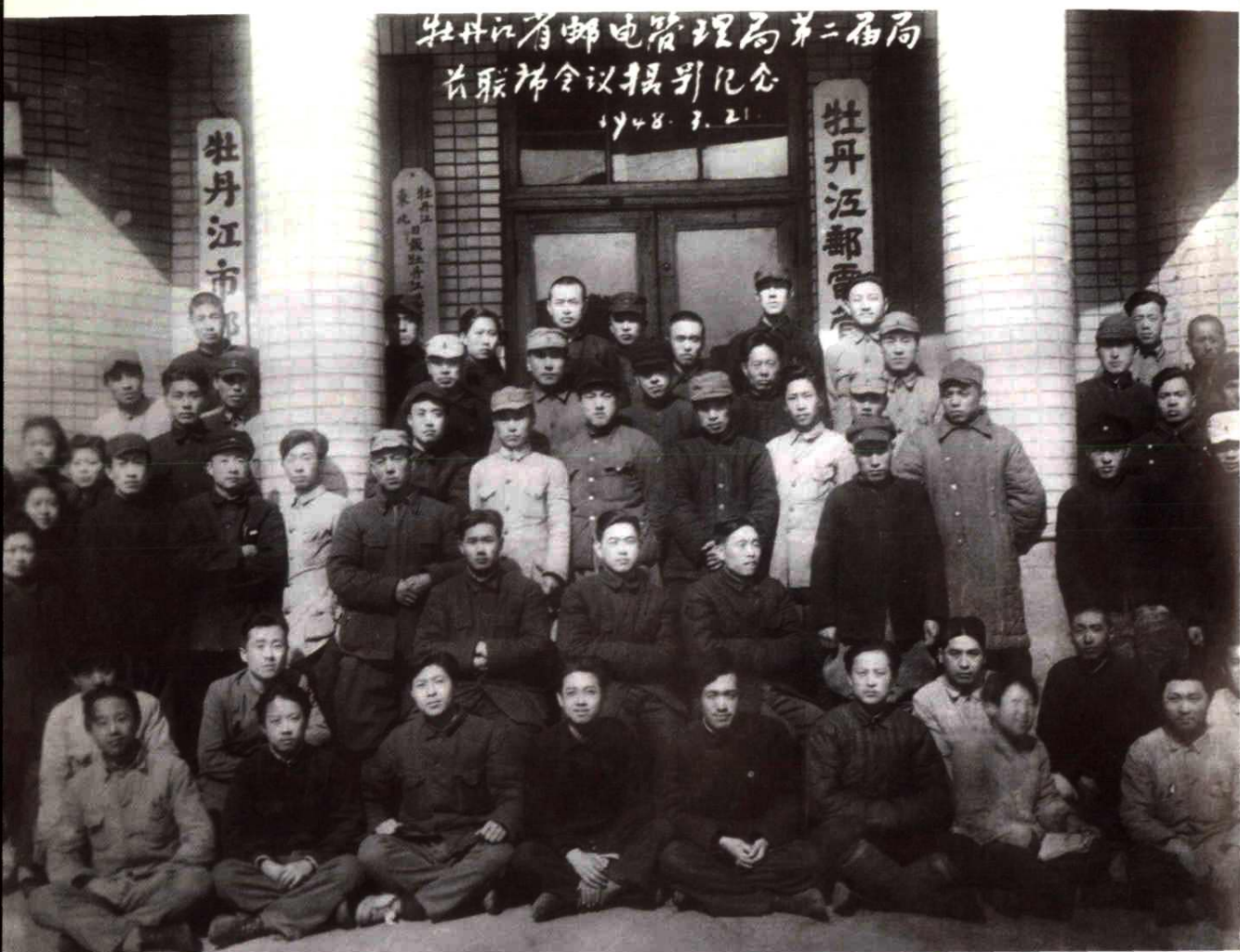
牡丹江省邮电管理局第二届局长联席会议