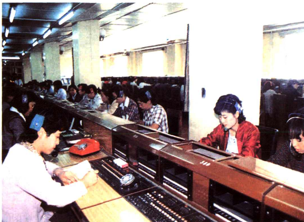
八十年代末的长途电话接续台