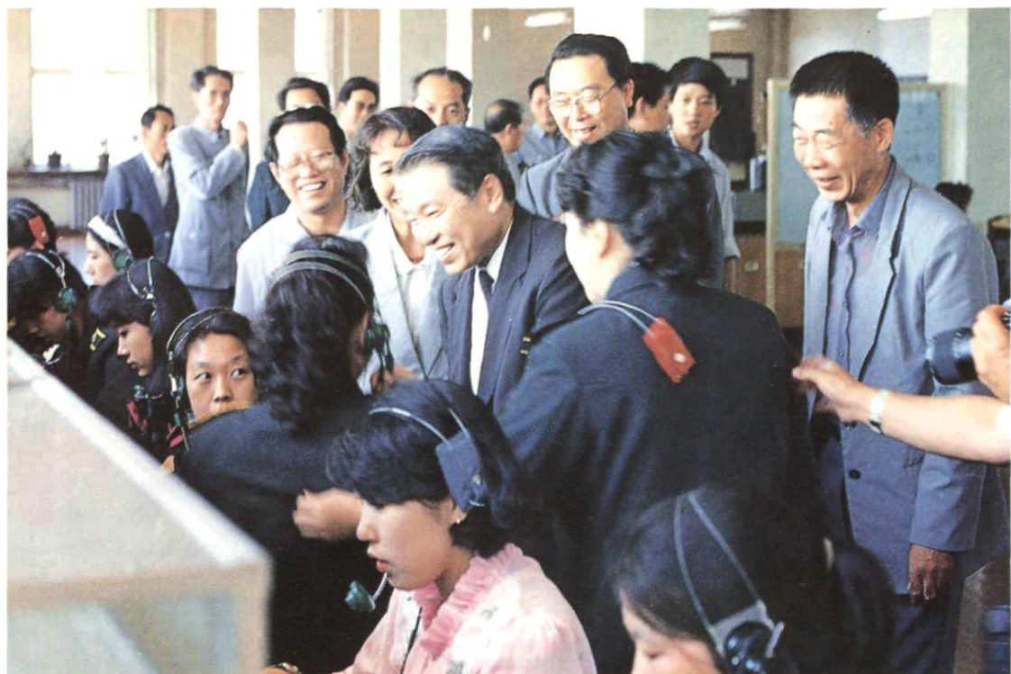
原邮电部部长杨泰芳视察牡丹江市邮电局