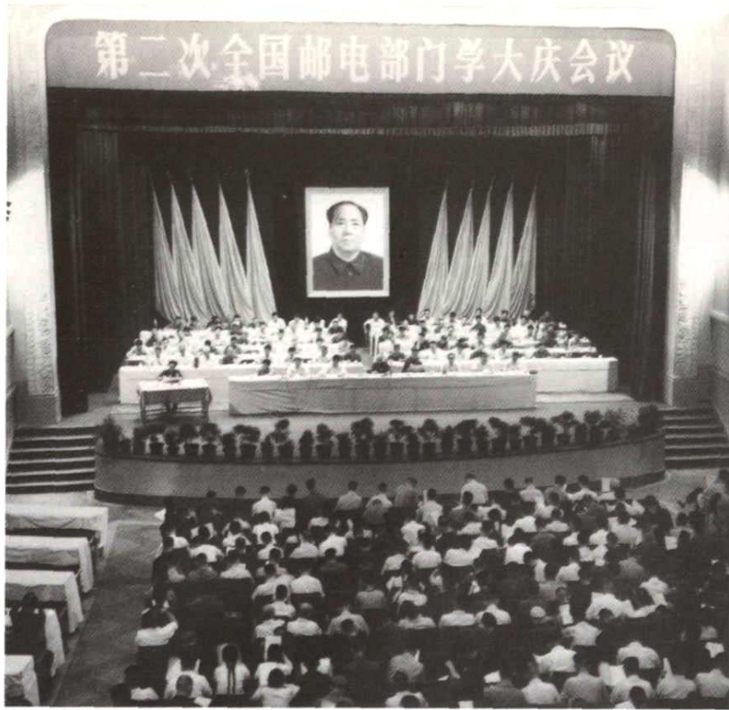
第二次全国 邮电部门学大庆 会议在牡丹江市 隆重开幕