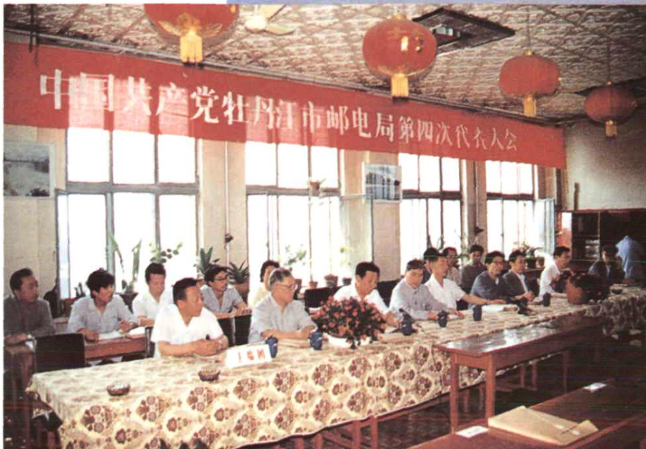
中共牡丹江市邮电局第四次党代会