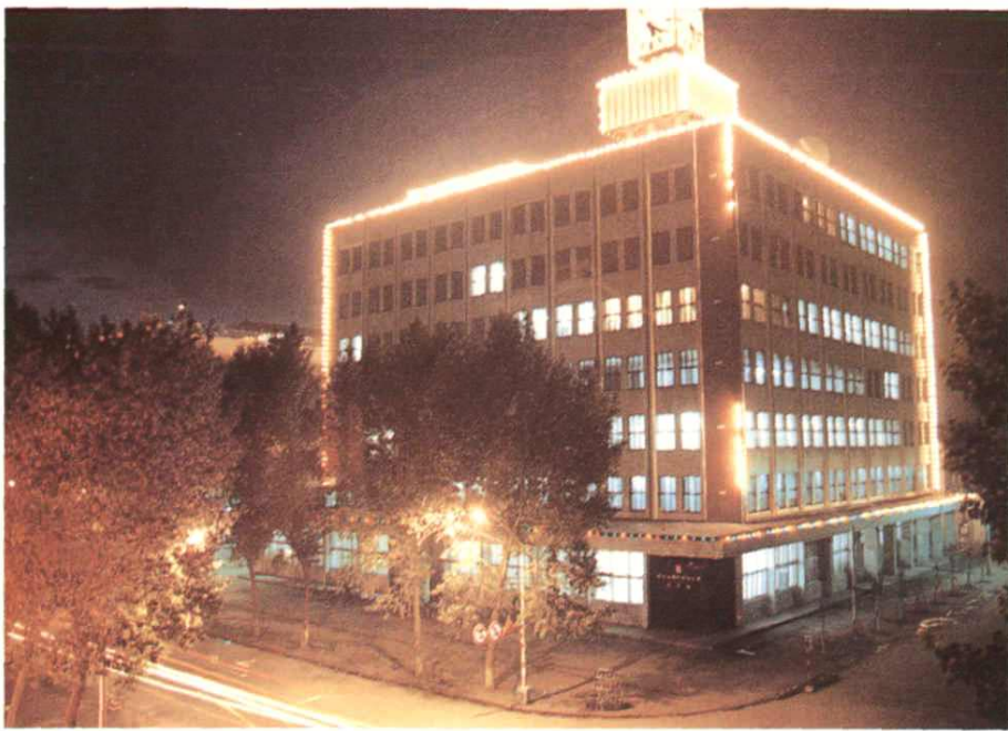
1985 年落成投产的电信大楼