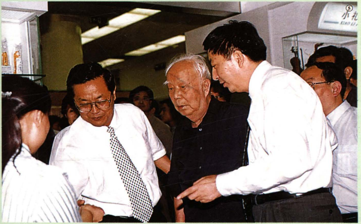
1999年8月，前人大常委会委员长万里同志视察重张开业的百货大楼。