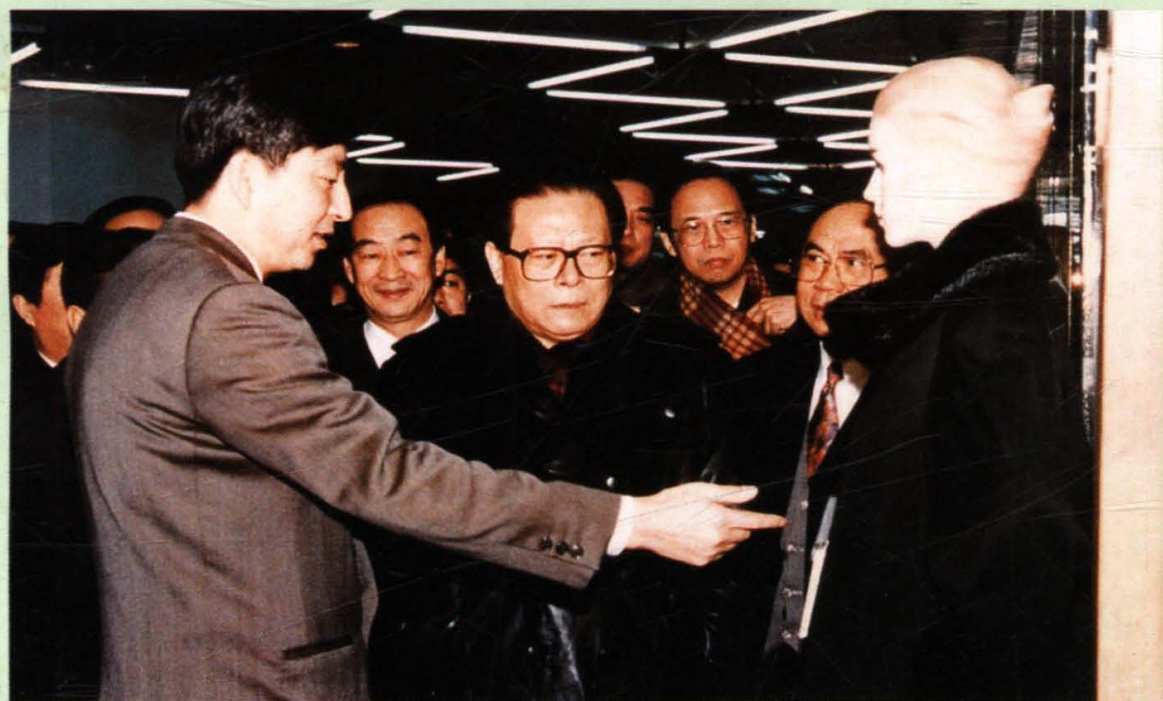
1994年1月8日，中共中央总书记江泽民在董事长郭传周、总经理郑万河的陪同下参观视察百货大楼。