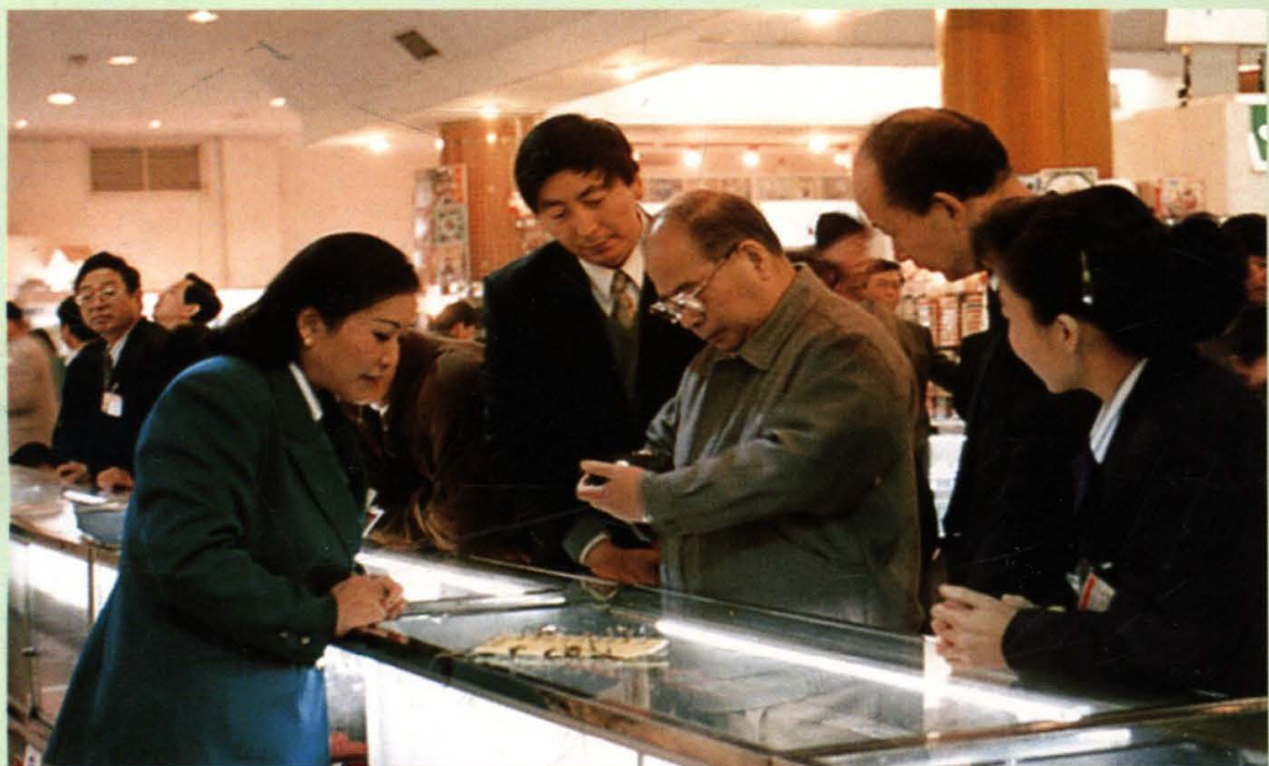
1996年11月，中共中央政治局常委、 北京市市委书记尉健行到百货大楼视察。