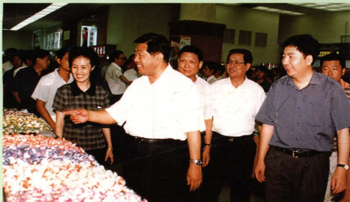
1999年8月27日，时任中共中央政治局委员、北京市委书记 贾庆林同市长刘淇一道视察即将重张开业的北京市百货大楼。