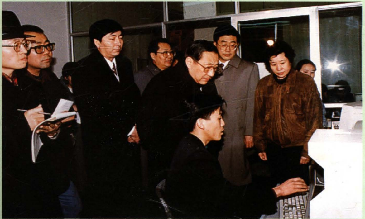
1997年2月5日，中共中央政治局常委、国务院副总理李岚清视察了王府井百货的一个配送中心。