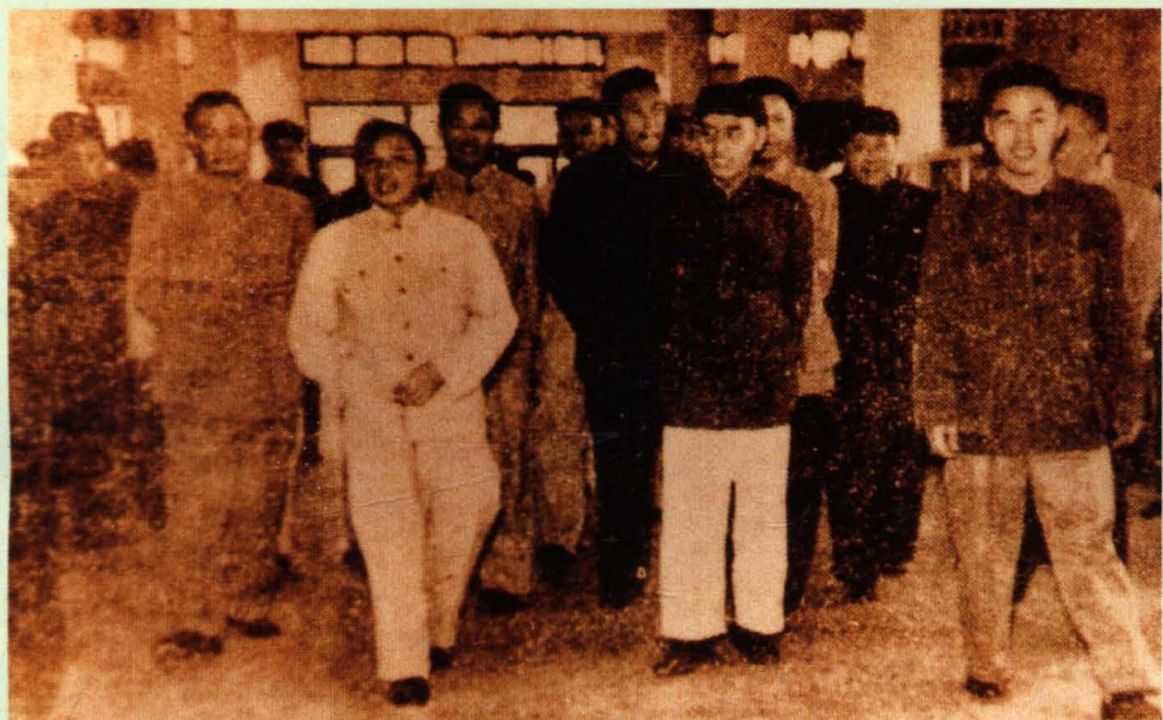
1955年9月，时任国务院副总理的邓小平同志视察即将开业的百货大楼。