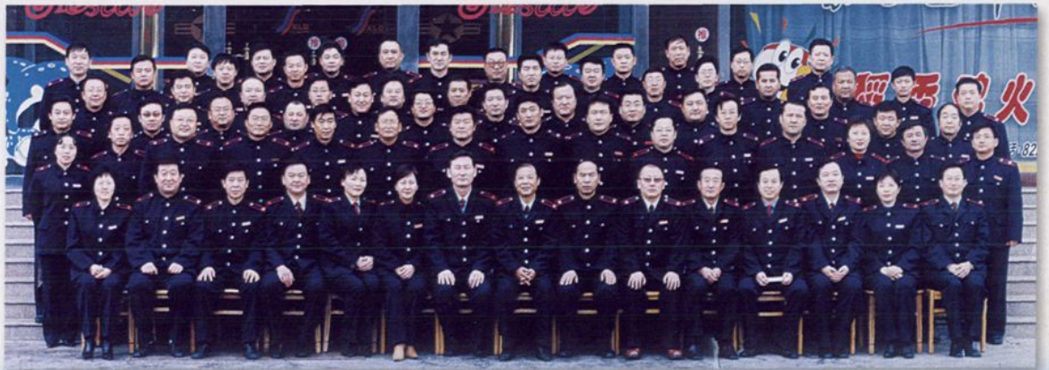
2004年1月,伊犁州直地税系统税收工作会议代表合影留念。