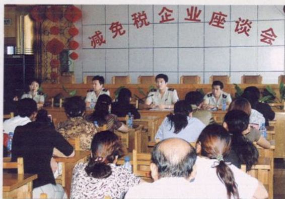
召开企业减免税座谈会