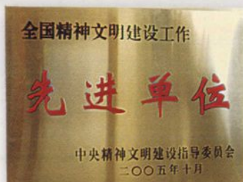
伊宁市地税局获2005年度全国精神文明建设先进单位