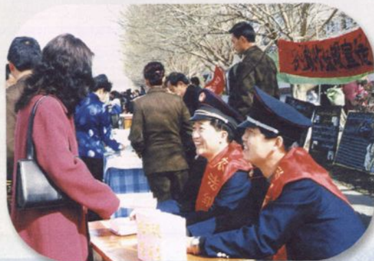
耐心解答群众提出的问题