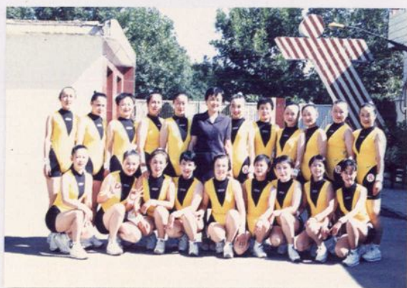
获健美操比赛团体第一名