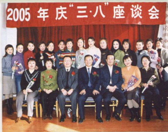
庆“三八”国际妇女节