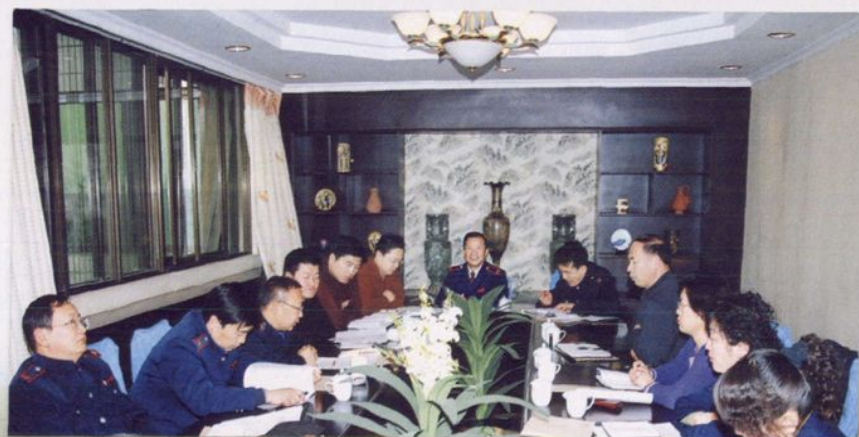
2005年11月,伊犁州地税局召开税收收入形势分析会。