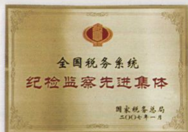
伊犁州地税局获2006年度全国税务系统纪检监察先进集体