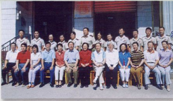
2006年7月,国家税务总局、自治区地税、国税领导与基层一线地税干部合影留念。