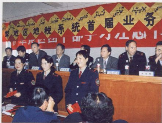
首届业务大比武总结表彰大会