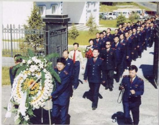
向独库公路烈士纪念碑敬献花圈