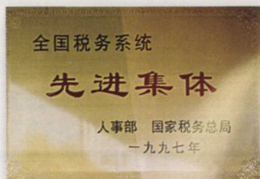
伊宁市地税局获1997年度全国税务系统先进集体