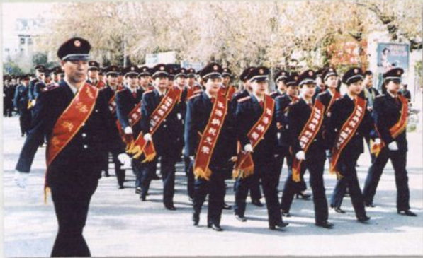
开展税法宣传活动