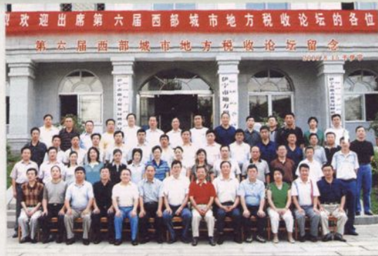
第六届西部城市地方税收论坛在伊犁召开