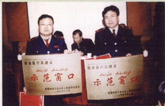
2003年特克斯县、昭苏县地税局荣获自治区行风建设“示范窗口”。