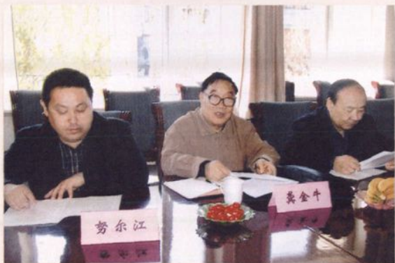
自治区政府参事,原自治区财政厅厅长、自治区地税局局长龚金牛(中)在伊犁调研。