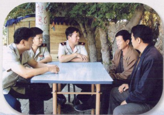
深入基层开展税收征管工作