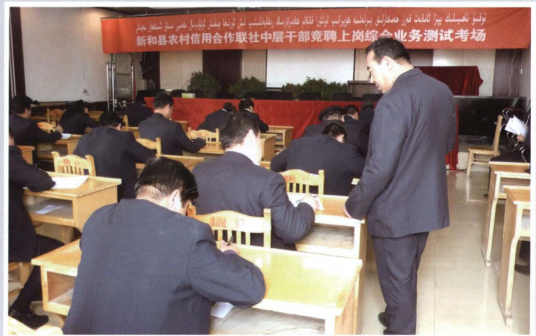
2011年3月28日，县联 社举办中层干部竞聘综合业 务测试