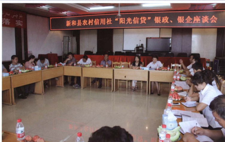
2012年7月18日，县联社 召开“阳光信贷”银政、银 企座谈会