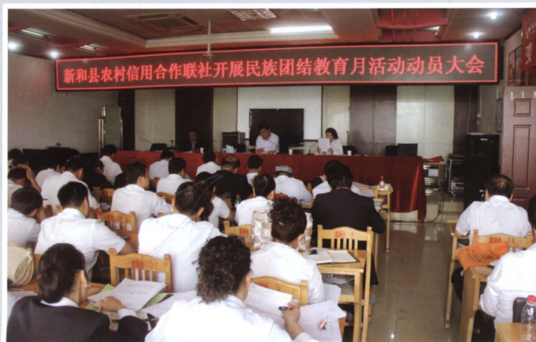
2013年4月27日，县联社 开展民族团结教育月活动动 员大会