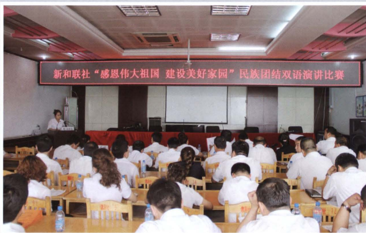
2013年5月29日，县联社 举办“感恩伟大祖国·建设 美好家园”民族团结双语演 讲比赛