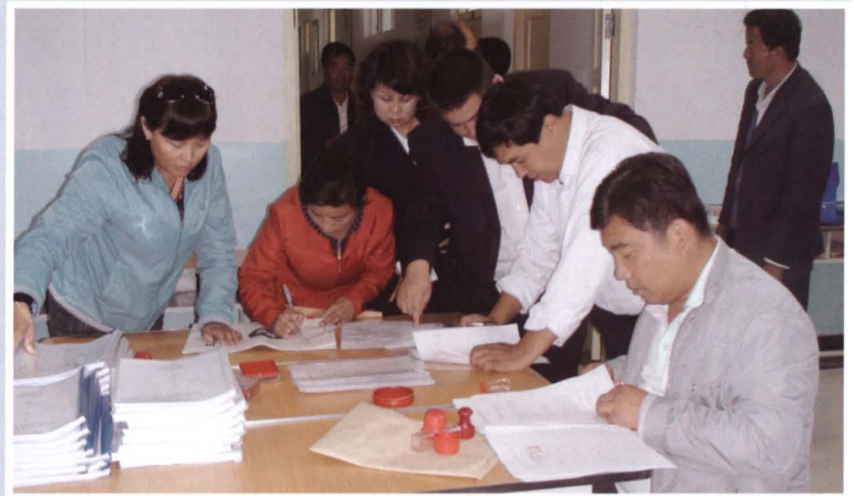
2010年9月29日，县联社支持县域中小企业贷款签约仪式