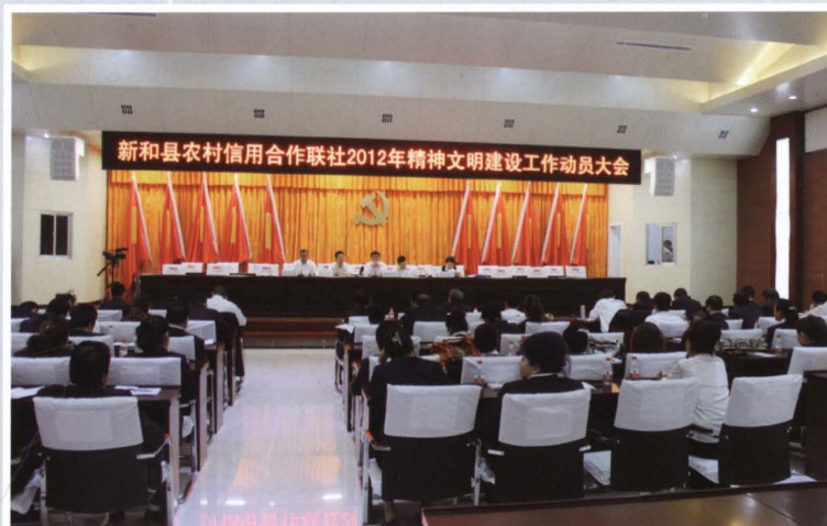
2012年5月9日，县联社 召开精神文明建设工作动员 大会