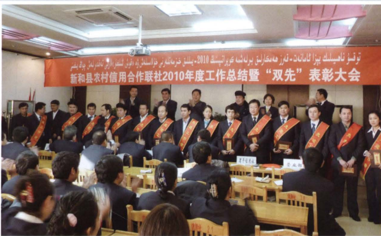
2011年1月12日，县联社召开2010年度工作总结暨“双先”表彰大会