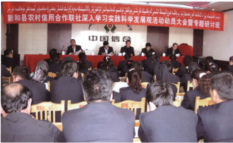
2008年10月22日，县联社召开学习实践科学发展观活动动员大会暨专题研讨班