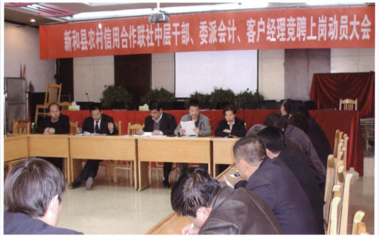
2011年3月3日，县联社 召开中层干部、委派会计、 客户经理竞聘上岗动员大会