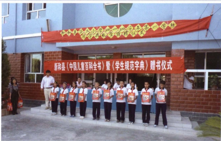
2011年9月13日，县联社向县第二小学贫困学生赠书仪式现场