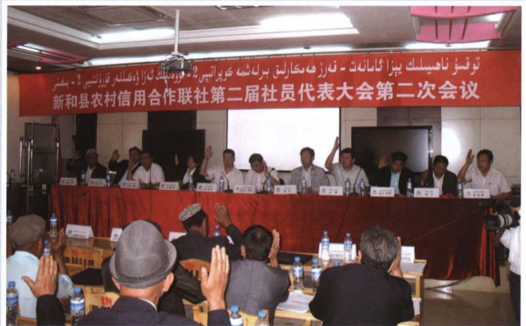
2011年5月20日，县联社召开第二届社员代表大会第二次会议