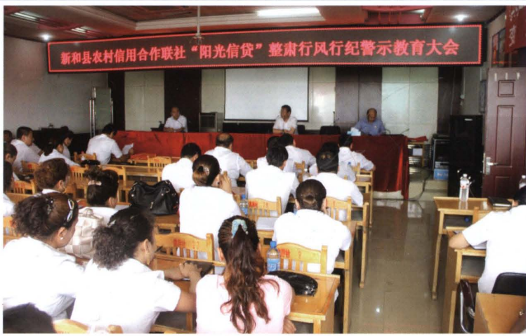
2013年5月22日，县联社 召开“阳光信贷”整肃行风 行纪警示教育大会