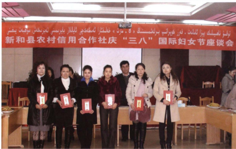
2011年3月8日，县联 社召开庆三八国际妇女节座 谈会