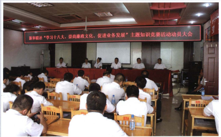
2013年5月29日，县联社 召开“学习十八大、崇尚廉 政文化、促进业务发展”主 题知识竞赛活动动员大会