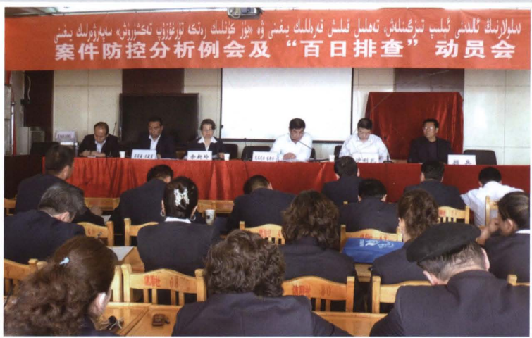
2011年4月13日，县联社召开案件防控分析例会及“百日排查”动员会