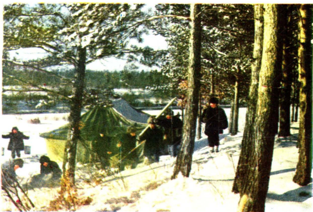
勘察设计人员在林区