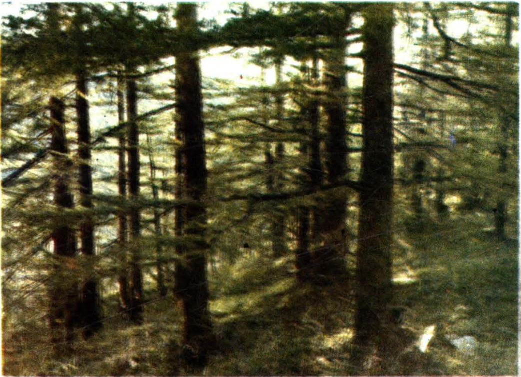
长白林海——云冷杉针叶林