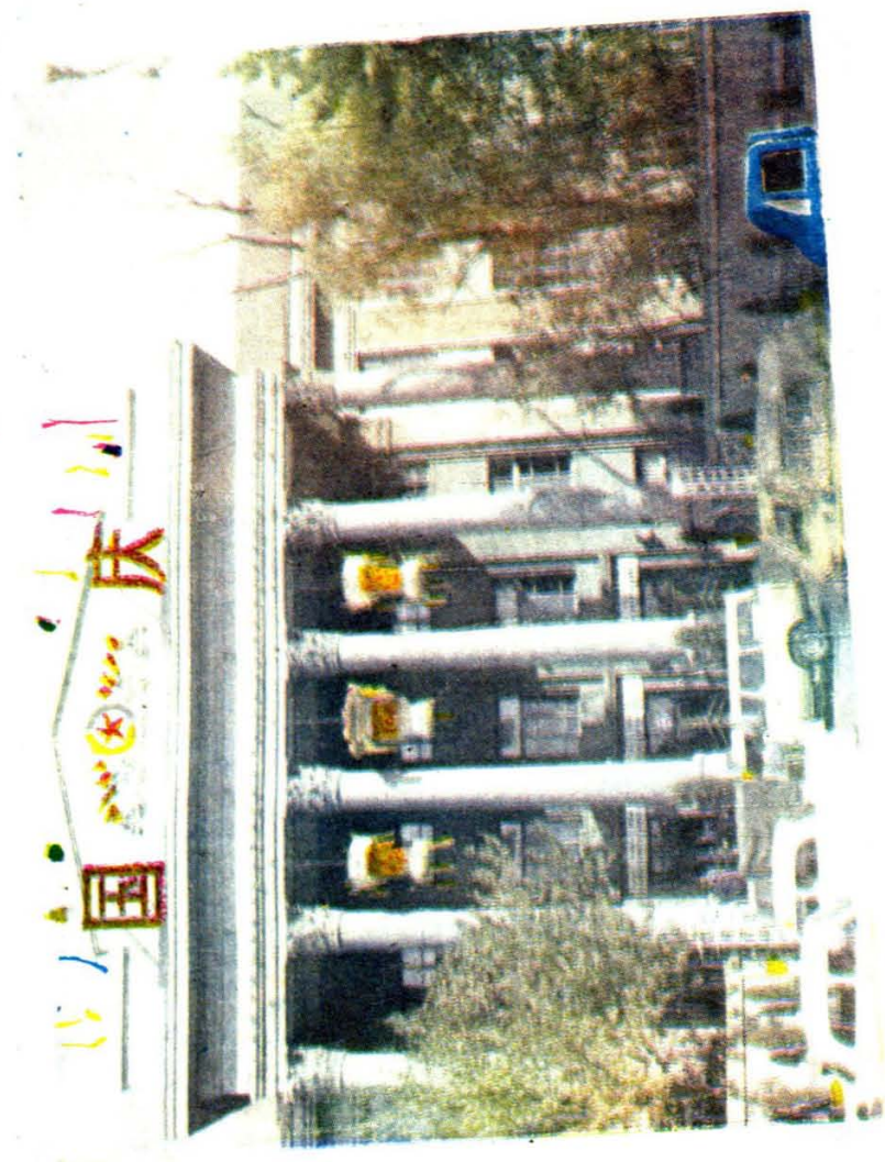
吉林省林业厅办公楼