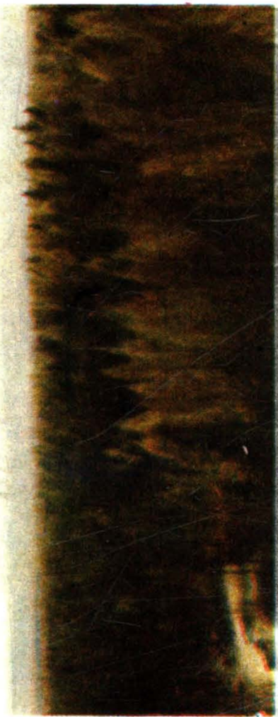
长白林海——落叶松林