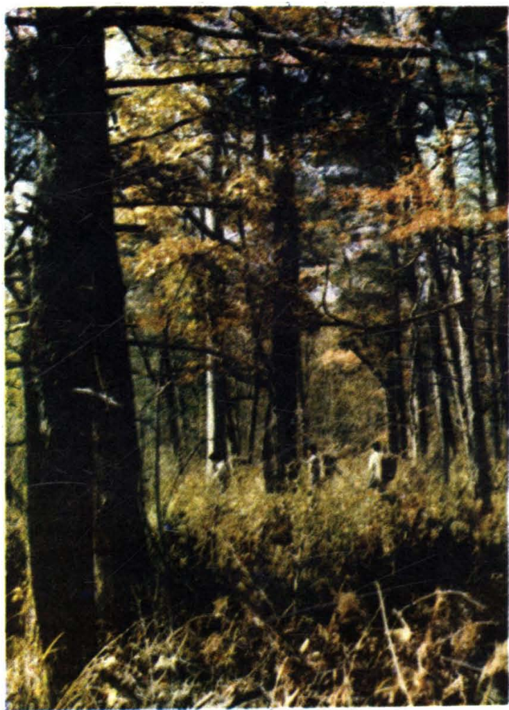
针阔混交林(过伐林)