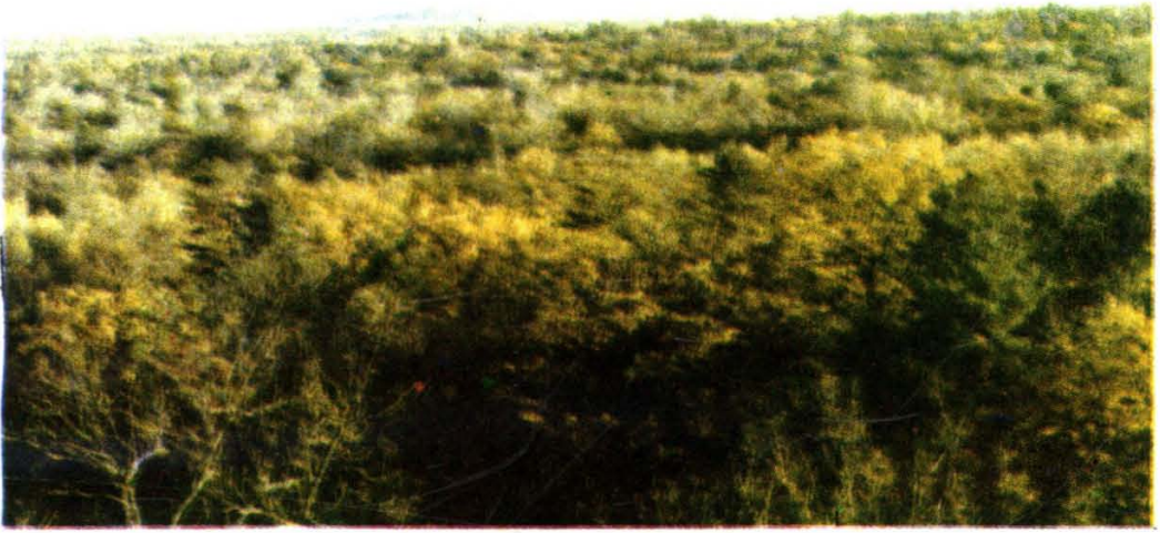
长白林海——针阔混交林