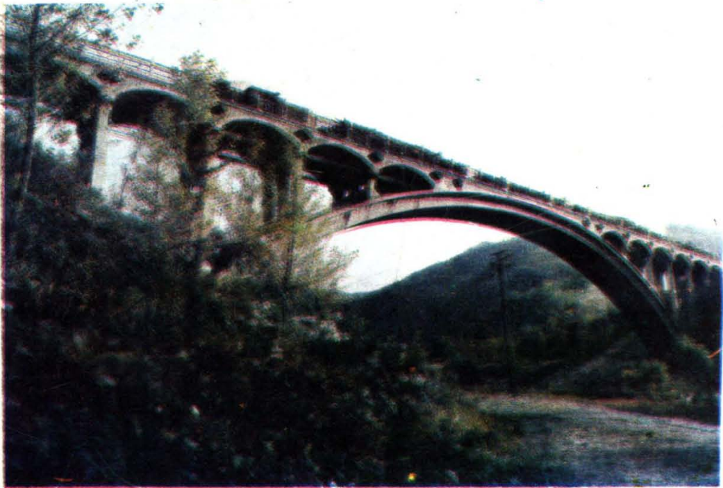
自行设计施工的临江森铁大桥