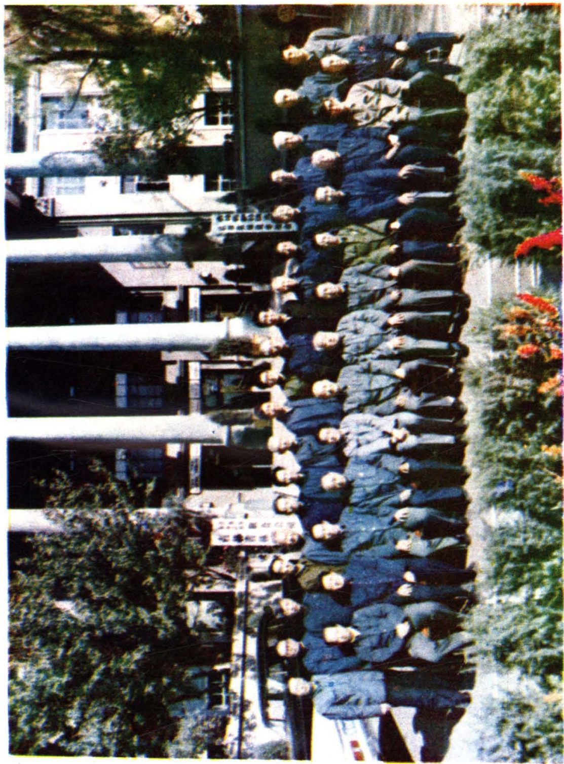
本书作者与省林业厅领导合影