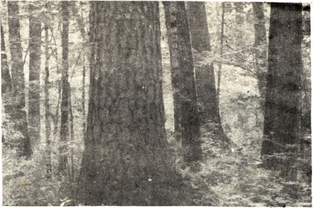
红松阔叶林(原始林)