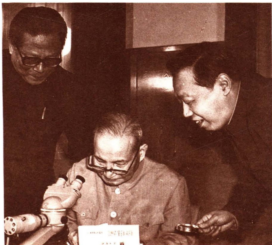
1984年3月陈云同志听取北京东光电工厂总工程师俞忠钰汇报工作并观看该厂产品。