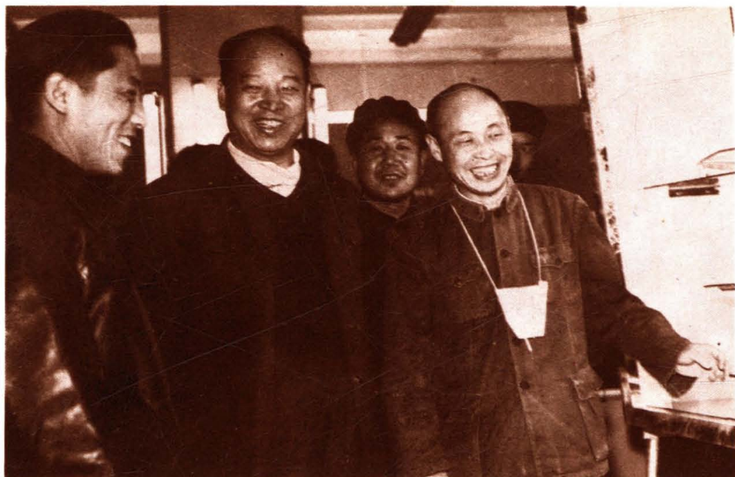
1961年彭真同志视察华北无线电器材联合厂。