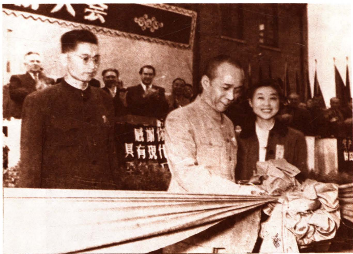
1956年10月国务院副总理李富春为北京电子管厂开工剪彩。