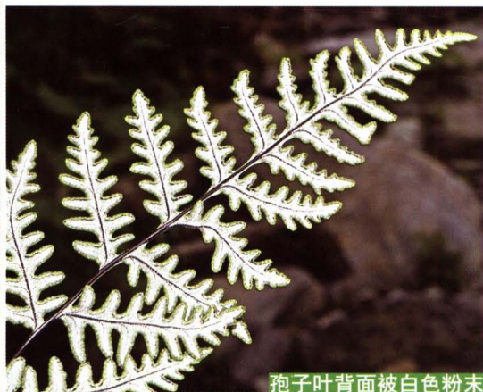
孢子叶背面被白色粉末