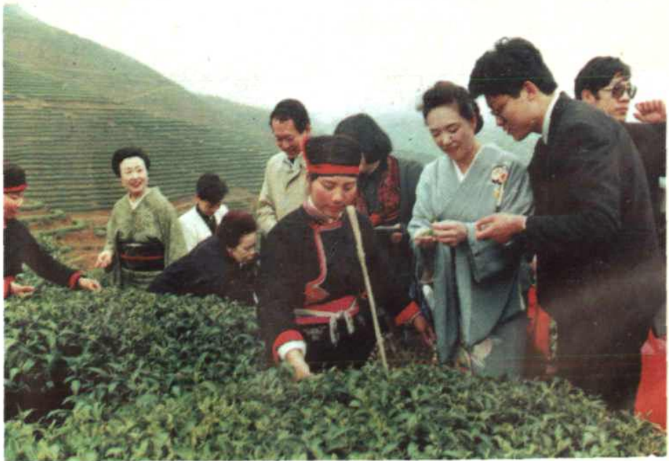
日本茶道团参观畲族茶山