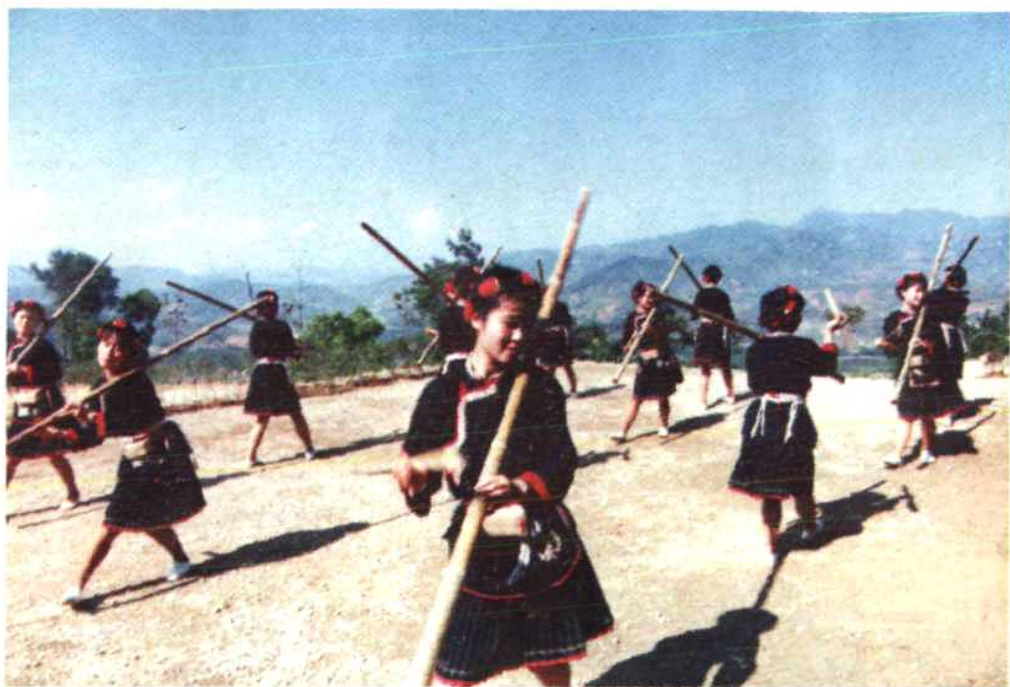
畲族传统体育——打枪担（荣获第四届全国 少数民族体育运动会一等奖）