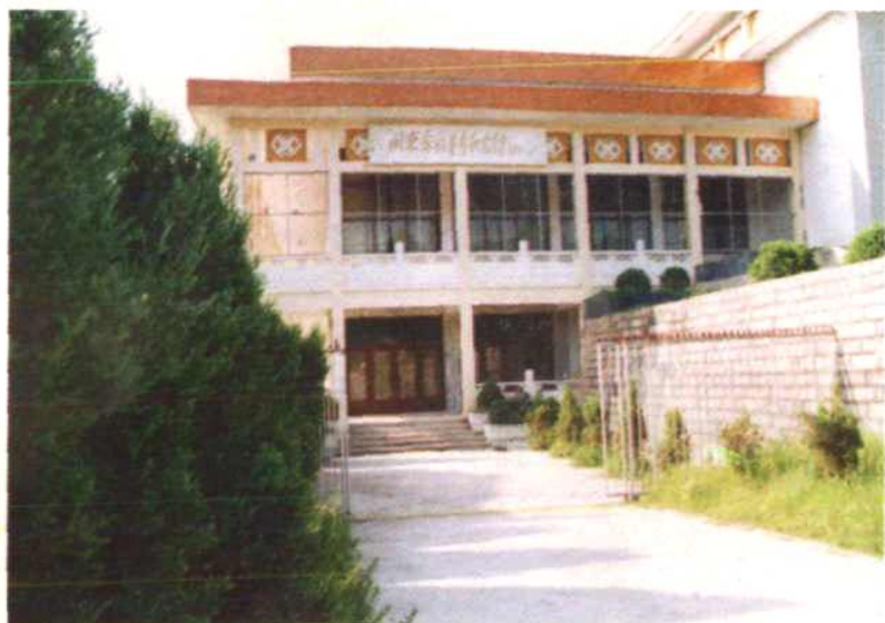
位于福安烈士陵园的闽东畲族革命纪念馆