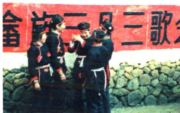
赛歌之前