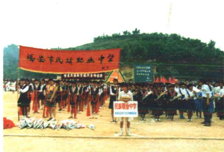
福安市民族职 业中学师生参加穆 阳畲族歌会