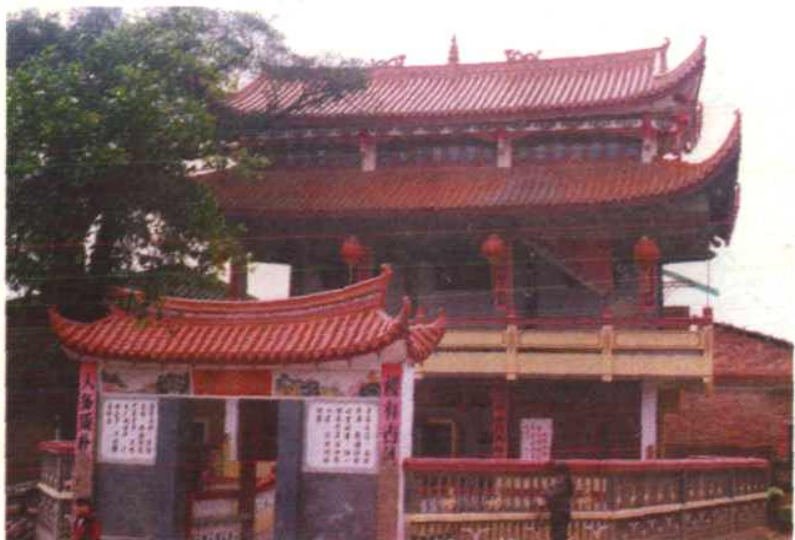
康厝畲族乡中心文化站