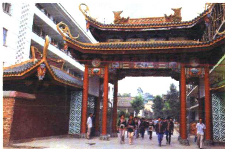
位于福安的宁 德地区民族中学