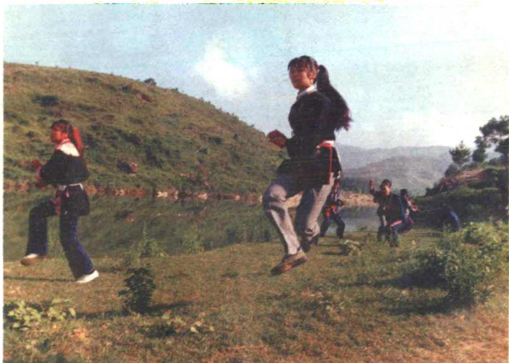
康厝畲族乡金斗洋拳术