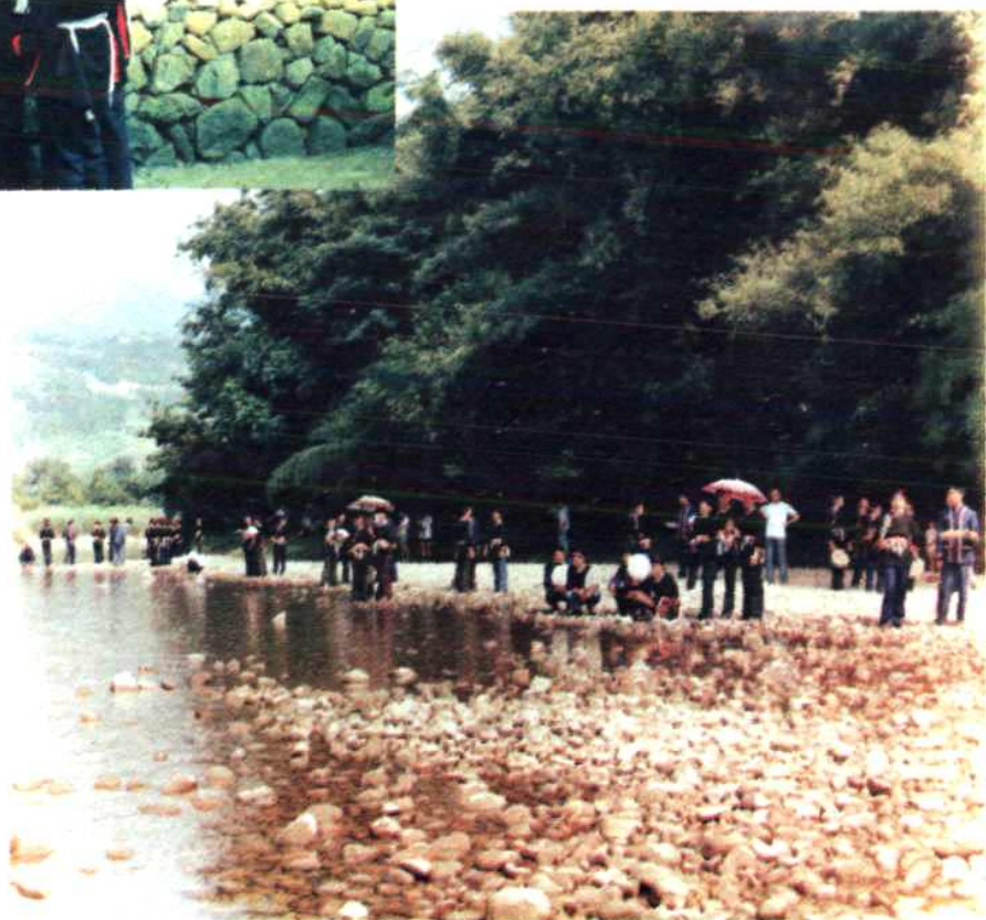
1986年6月 福建省首届畲 族歌会富春溪 畔歌场