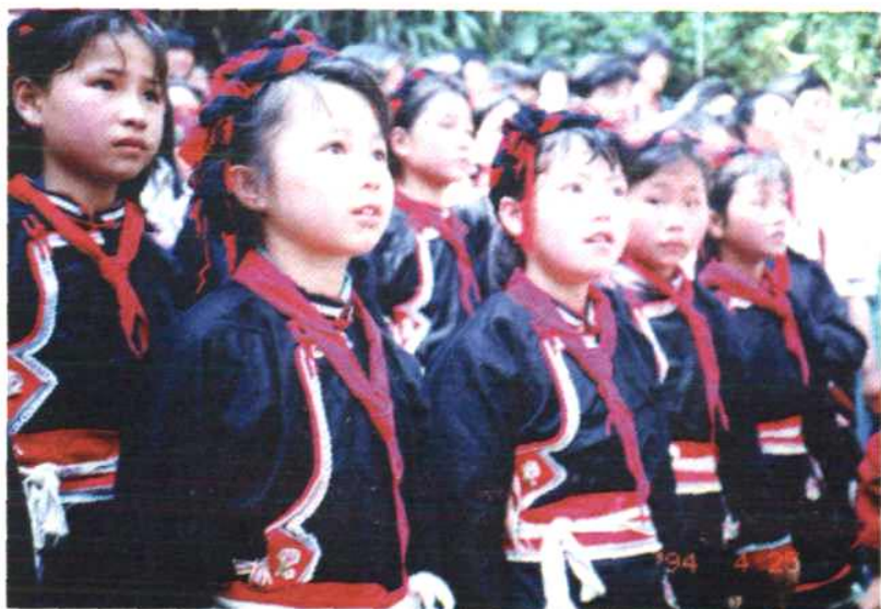
福安市民族 实验小学学生