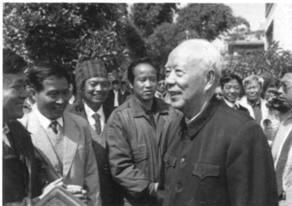
万里委员长视察瑞丽