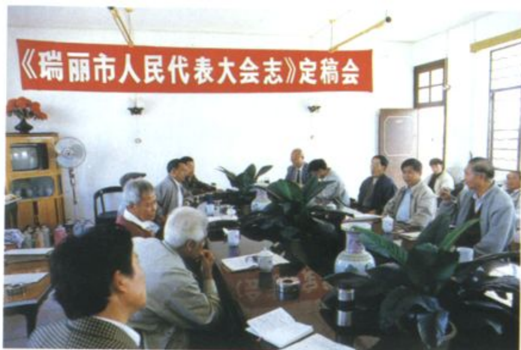
《瑞丽市人民代表大会志》定稿会会场