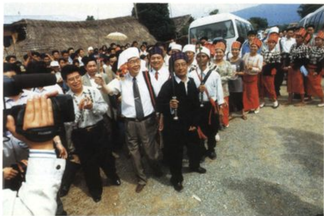
李鹏总理在瑞丽市视察与户育乡尹山村景颇族群众一起欢乐跳起“目脑纵歌”。