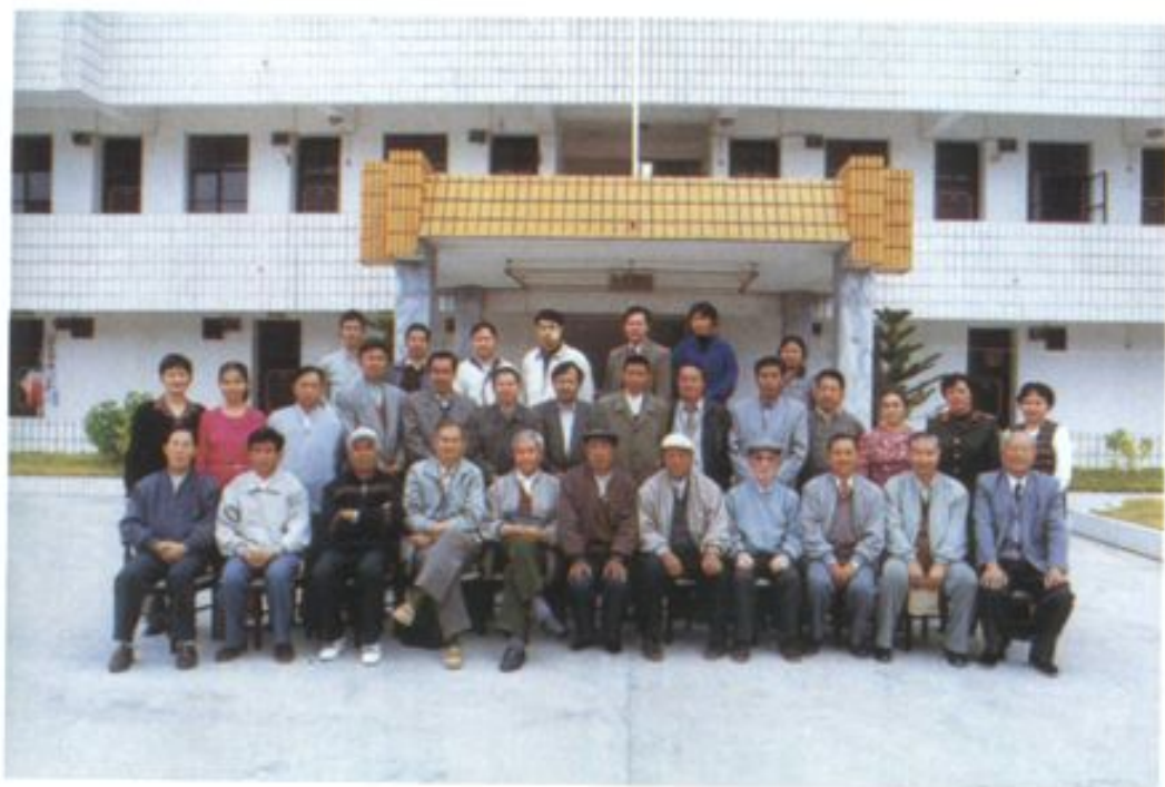
出席《瑞丽市人民代表大会志》定稿会全体同志合影