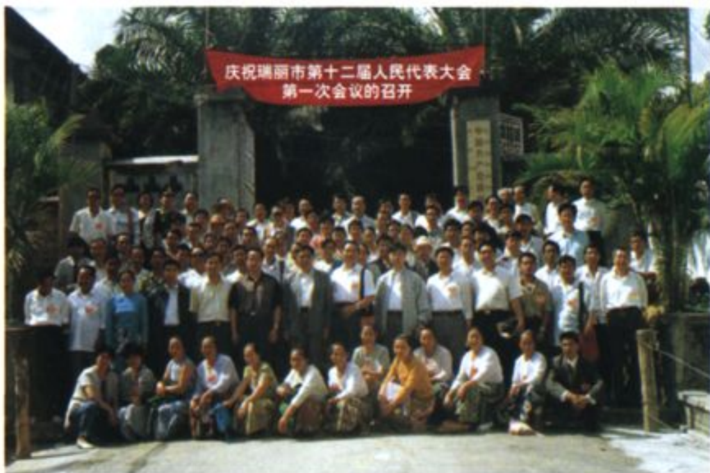
庆祝瑞丽市第十二届人民代表大会第一次会议的召开