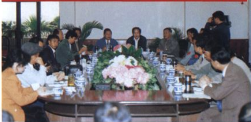
云南省十五市人大工作研讨会第十四次会议在瑞丽召开