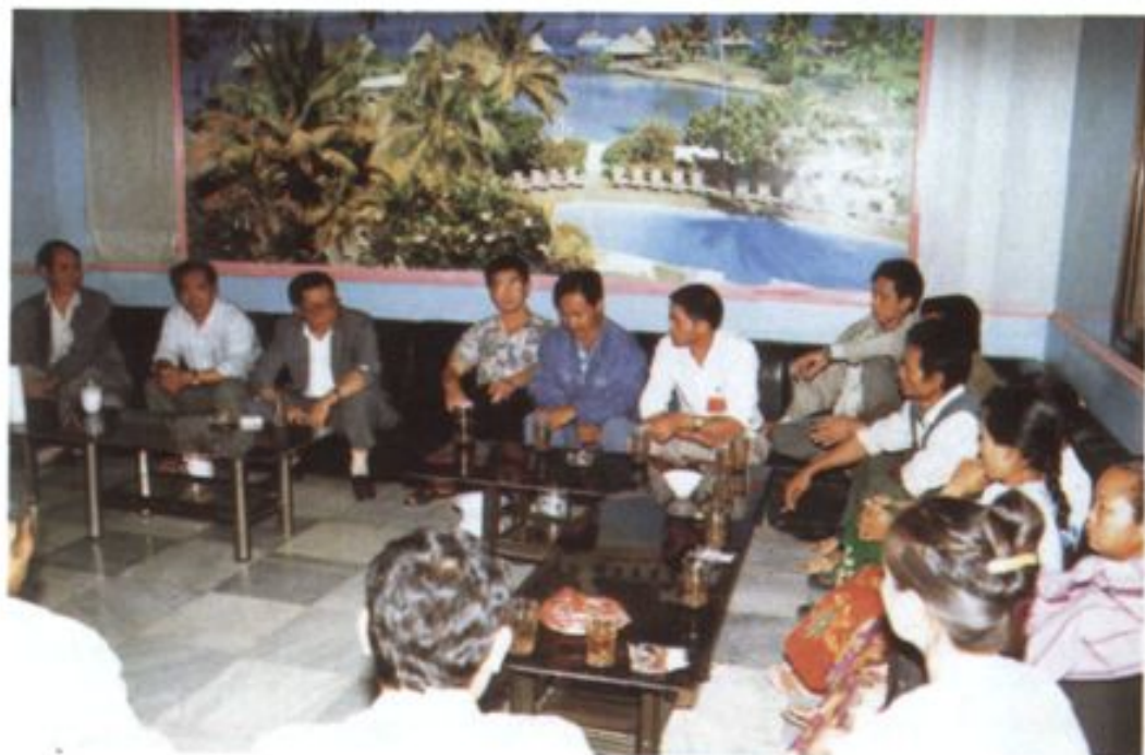
瑞丽市人民代表大会各代表团分别审议大会各项报告