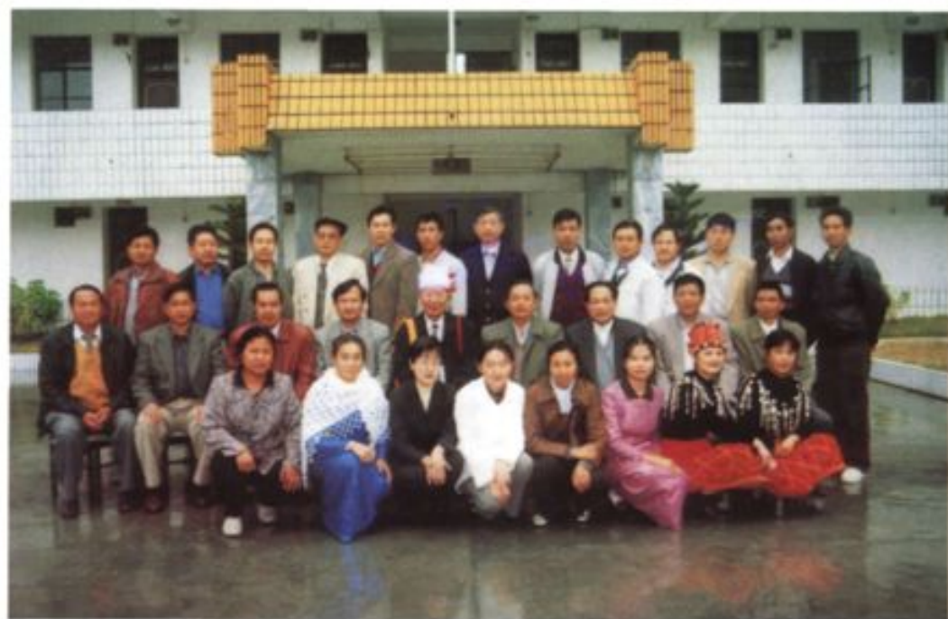
云南省人大常委会主任尹俊等视察我市与市人大常委会全体工作人员合影