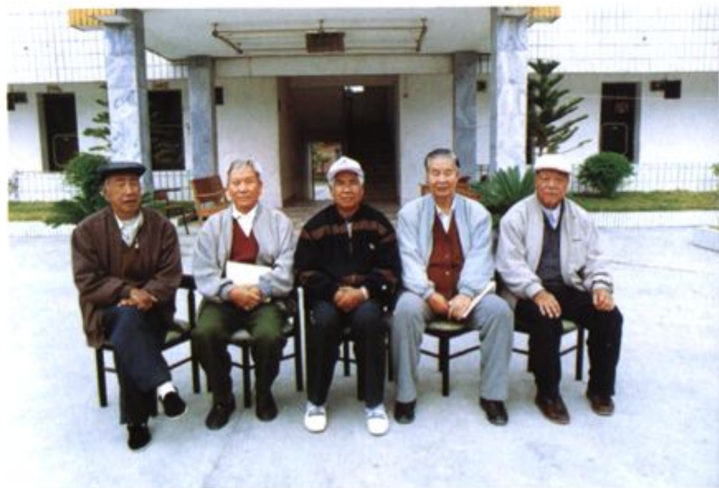
瑞丽市人民代表大会志部分顾问合影