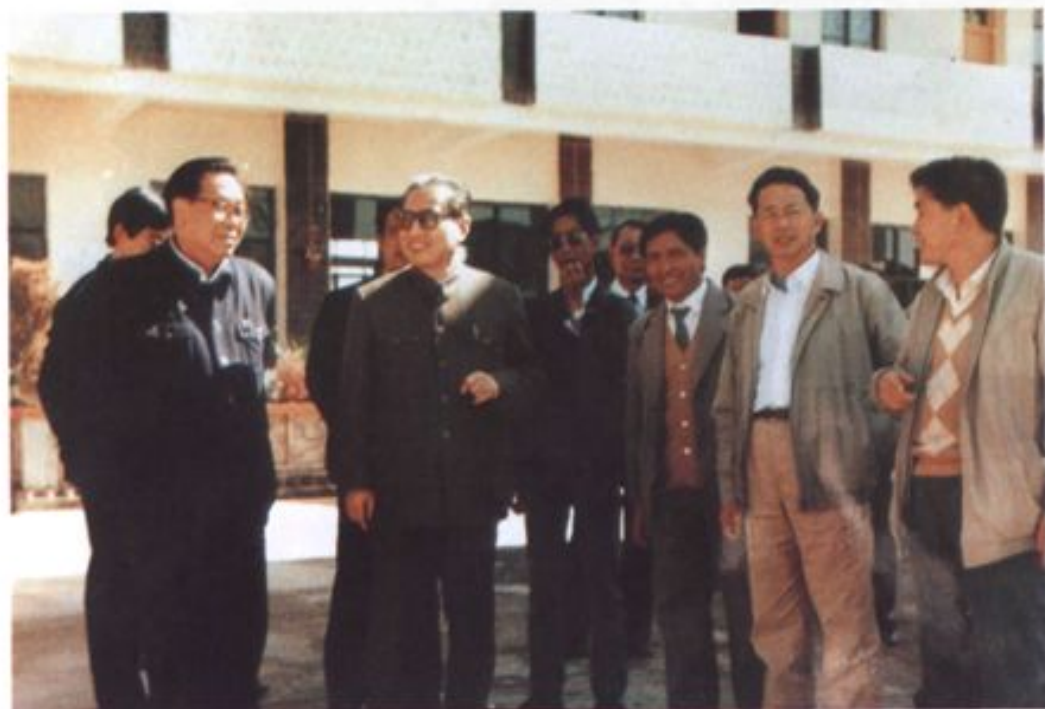
全国人大常委会委员长乔石视察瑞丽