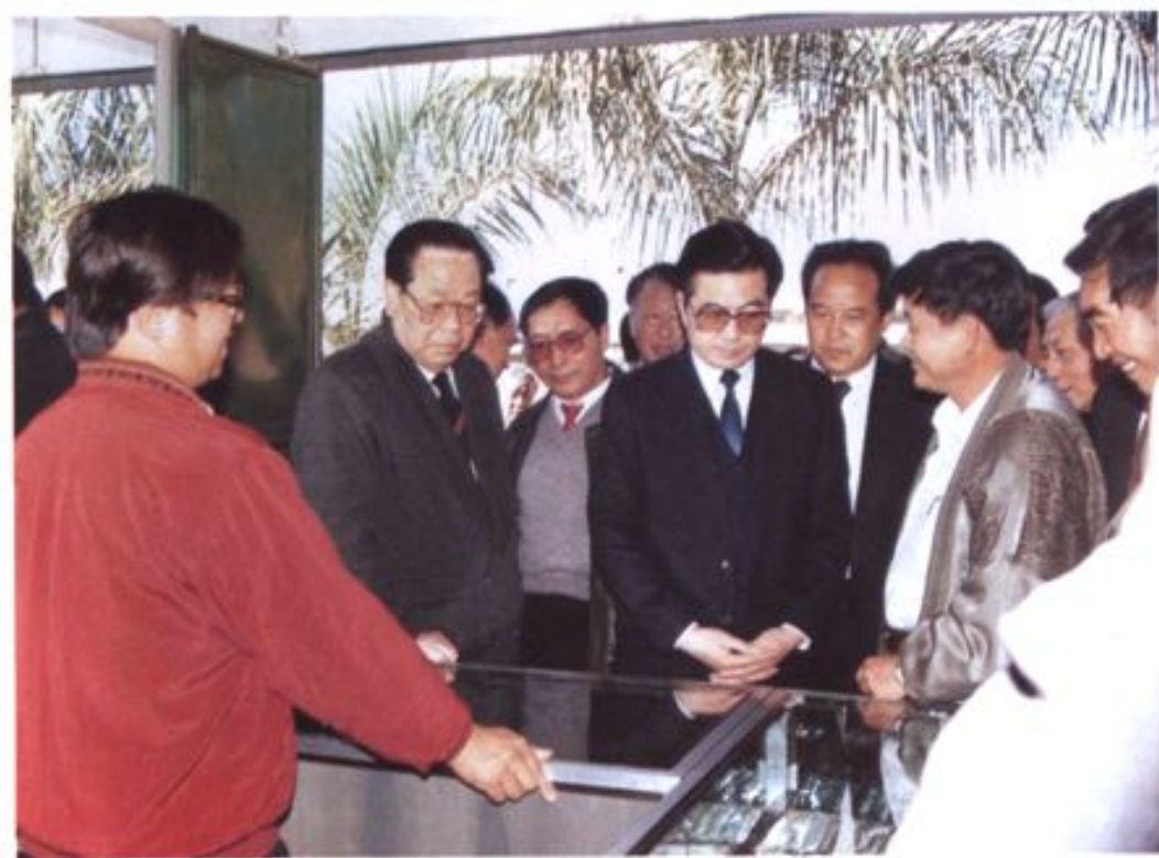
中共中央政治局常委、书记处书记胡锦涛在瑞丽视察