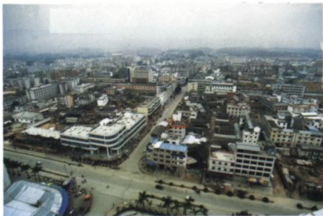
新兴的边境开放城市——瑞丽