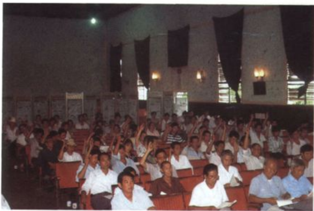
瑞丽市人民代表大会（代表进行表决）