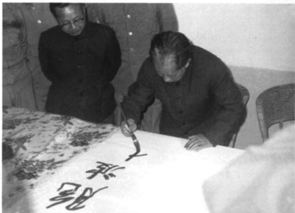
胡耀邦总书记视察瑞丽的题词“中缅胞波情谊万古长青”