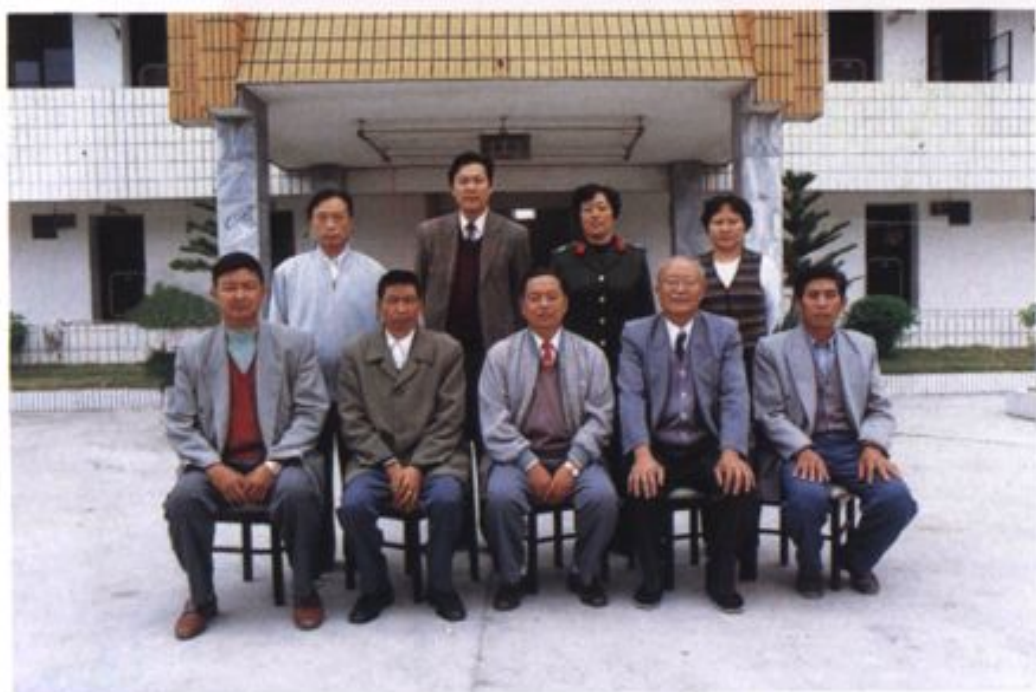
瑞丽市人民代表大会志编纂委员会合影