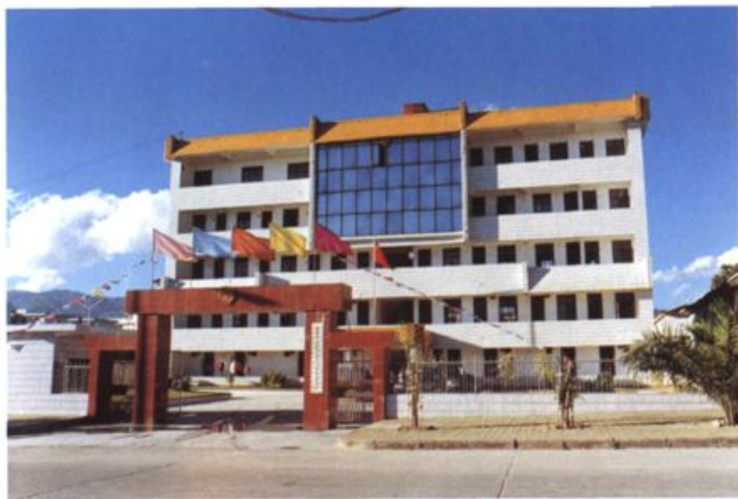
瑞丽市人大常委会办公大楼