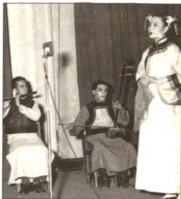
1957年,满族代表队参加全省民族文艺会演,演出《灯盏子花》