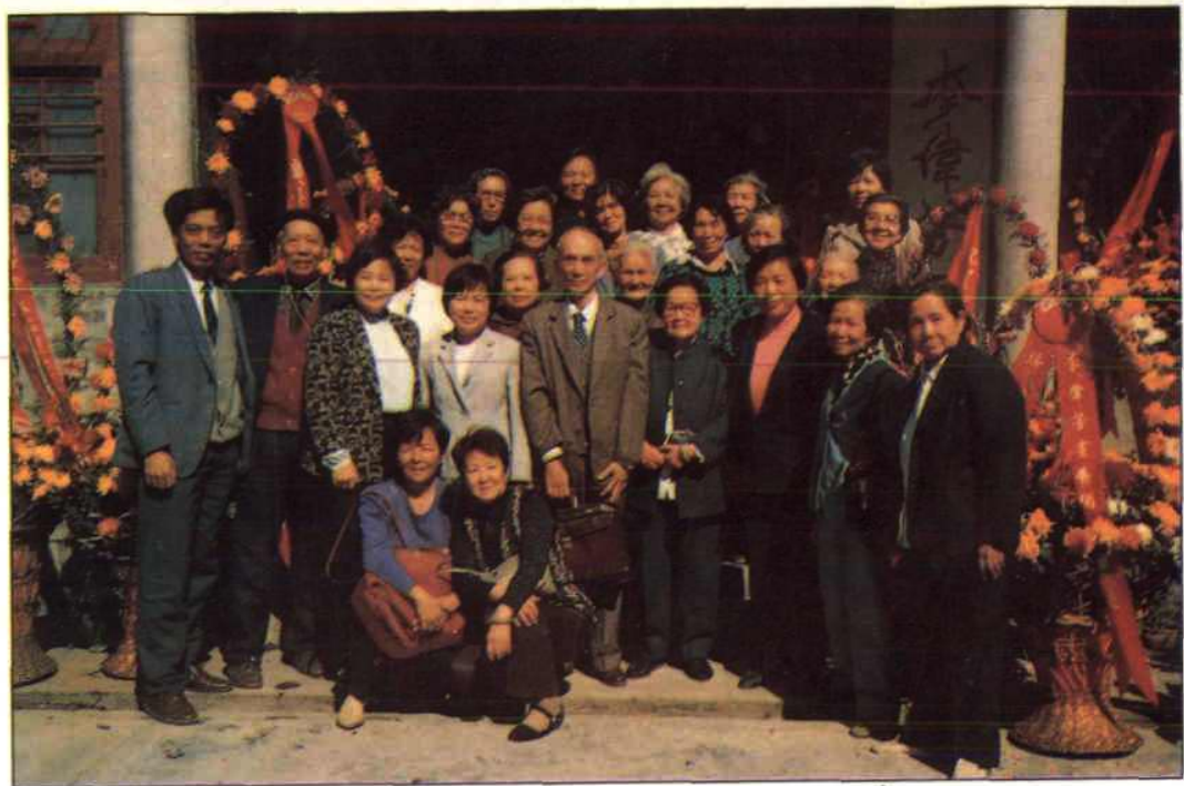
广东省副省长李兰芳(前排站立左起第3人)同满族群众一起参观国家二级美术师李伟芳(满族、前排左起第7人)的个人画展