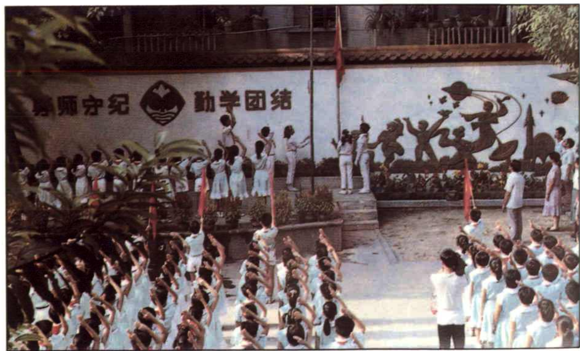
满族小学师生举行升旗仪式