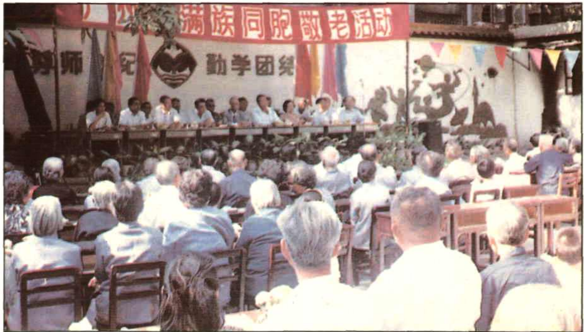
广州市满族同胞敬老活动