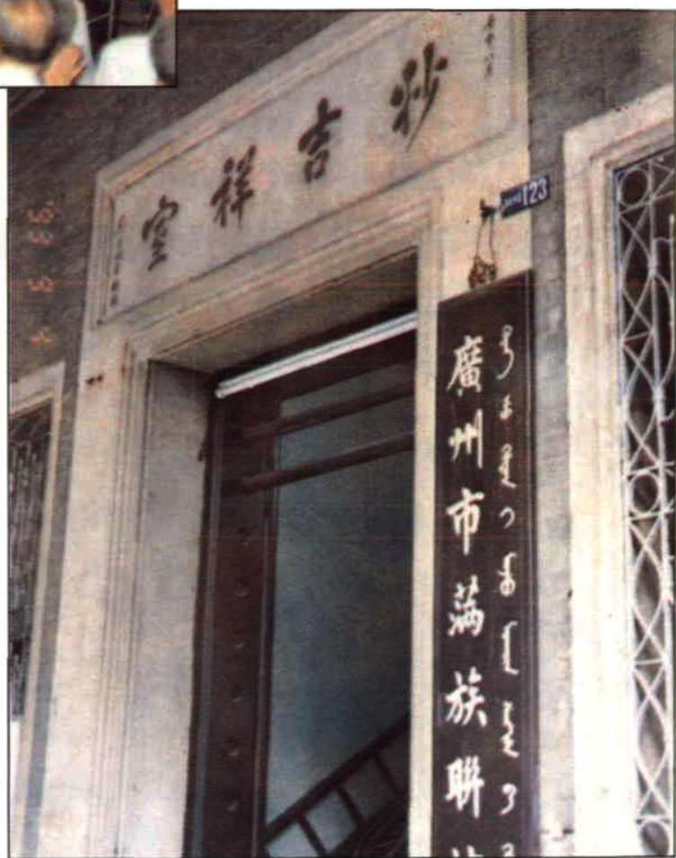
广州市满族联谊会