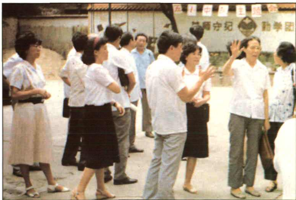
原广州市副市长王玄(中间、女、向师生挥手致意)视察满族小学 试读结束，需要全本PDF请购买 www.ertongbook.com