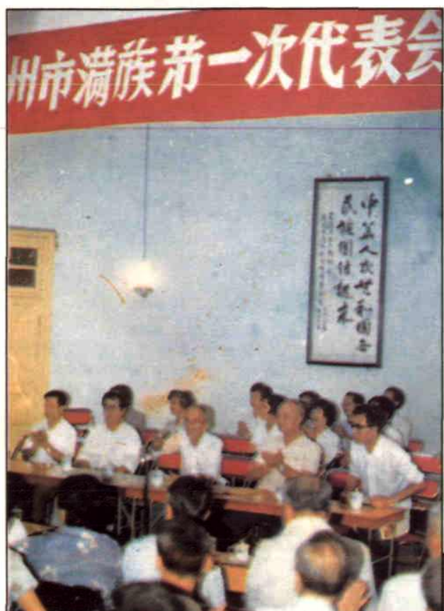
广州市满族第一次代表大会