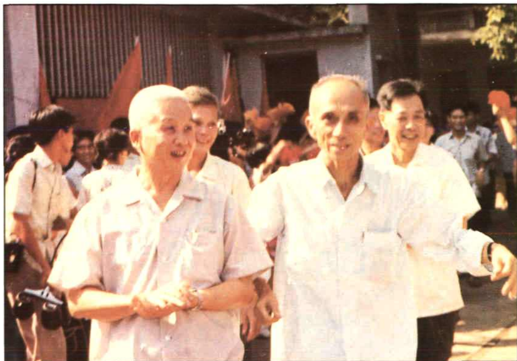
原中共广州市委副书记罗范群(前排左第1人)视察满族小学