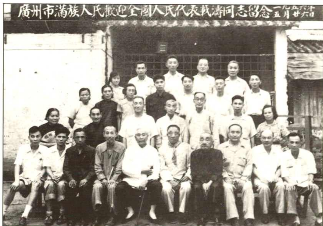
1956年,广州市满族代表欢迎全国人大代表载涛(前排左起第6人)来穗