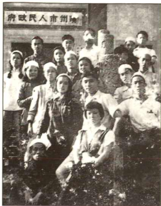
50年代初,回、满族青年积极参加广州市人民政府组织的活动