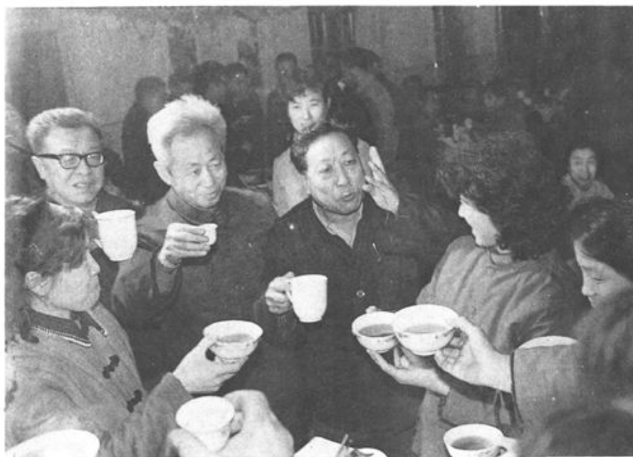
⇨ 左起：市委副书记张庆春、市委书记巴风、市长张克孝向环卫工人代表敬酒，号召：“保住第一，为现代化建设和为人民创造一个良好的环境”。

1983年元旦之夜到市环卫局看望清洁工人代表的市领导有：市委书记巴风、副书记、市长张克孝、副书记张庆春、郝弼，市人大副主任汤文、刘正，副市长岳庆博、张忠仁、李朝瑞、陈发、王璟琳，市政协副主席李学杰，市建委主任刁家运、副主任刘同春，市总工会主席唐文华，还有市五个区政府主管城建的区长、副区长韩冷、贾冷、陈世明、陈印栋、郝新、姚继云等，本局党组成员裴凤岐、李树和、姚传凤陪同。