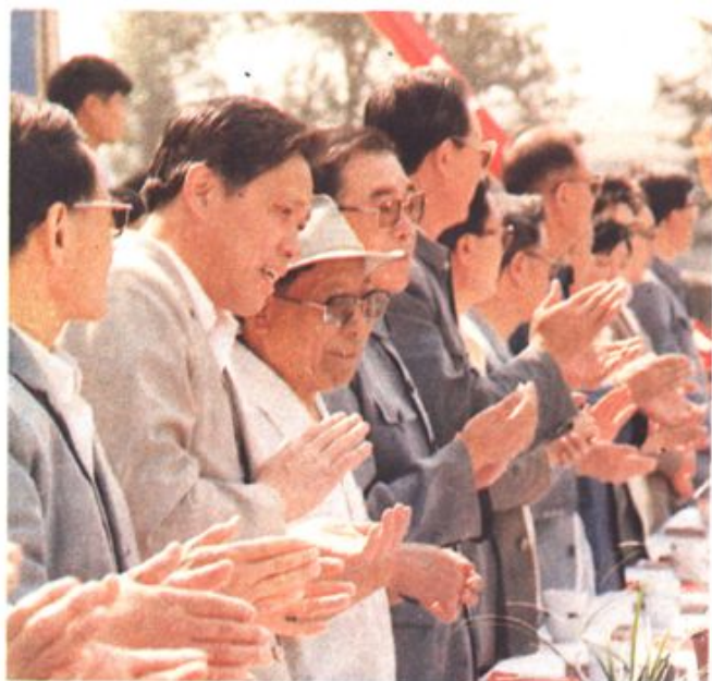
⇨ 中共牡丹江市委、市人大、市政府、市政协、市纪检委主要负责同志参加了首届和第二届“环卫工人节”庆祝大会。