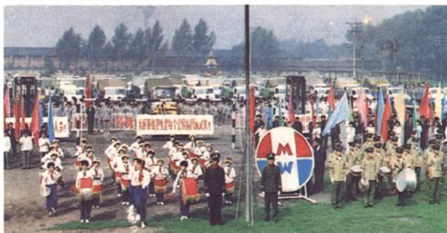
⇐ 牡丹江市“环卫工人节”庆祝大会会场一角。