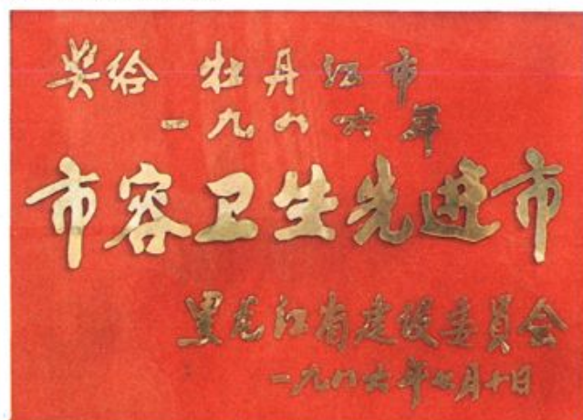
黑龙江省城市市容环境卫生竞赛夺取五连冠。一九八六年七月十日授予奖状。