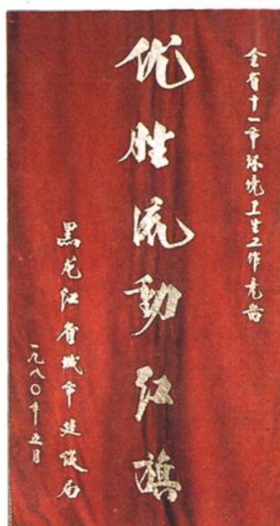
省一九八〇年制旗，获得三年先进，奖给牡丹江市。