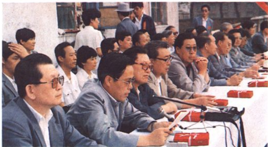
⇐ 庆祝大会主席团一角。副市长王树斌在大会上发表讲话。