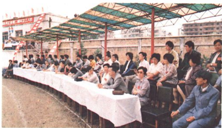
⇨ 出席 1988 年“全国部分省市环卫工作现场会”各地代表坐在观礼台上检阅牡市环卫大军。