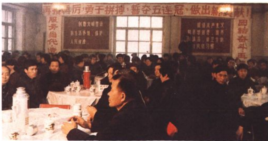
⇐ 一九八六年环卫系统元旦茶话会会场一角。