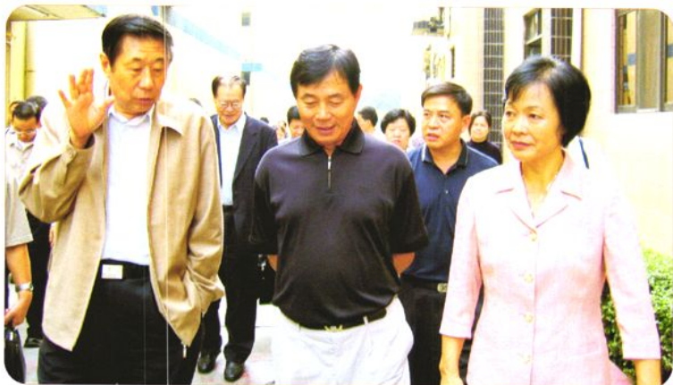
2005年11月12-13日，在全国人大副委员长李铁映的带领下，以全国人大常委会委员、财经委副主任委员闻世震(前左一)为组长的全国人大常委会劳动法执法检查组，到东莞长安信泰光学有限公司开展《劳动法》执法检查。