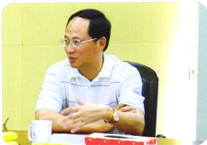
2007年5月23日，广东省劳动保障厅副厅长林应武到东莞市劳动局调研指导工作。