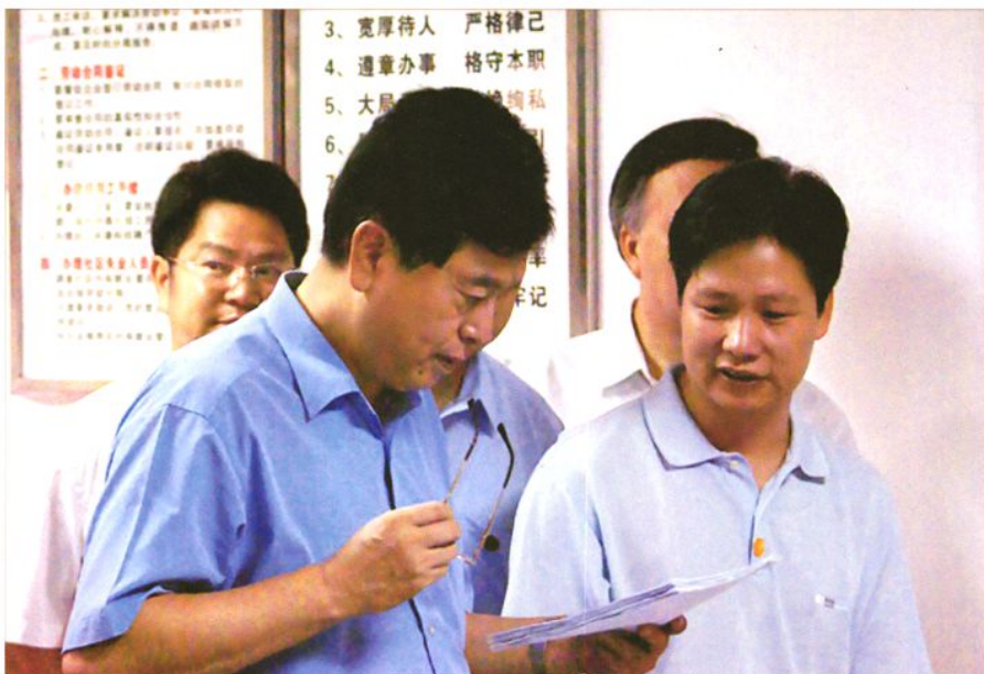
2007年8月23日，中共中央政治局委员、广东省委书记张德江（左一）在市委书记、市人大常委会主任刘志庚（后排左一）等领导陪同下，到东莞市东城主山劳动服务站调研，了解劳动争议处理、就业服务情况。