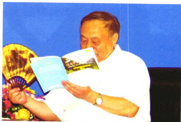
中国职工教育和职业培训协会会长、原国家劳动保障部副部长林用三到东莞市高级技校调研。