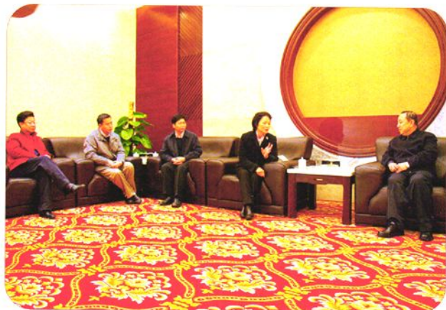
2008年1月27日，国家劳动保障部副部长杨志明（右一）来东莞调研《劳动合同法》贯彻实施情况，东莞市副市长李小梅（右二）汇报有关工作。