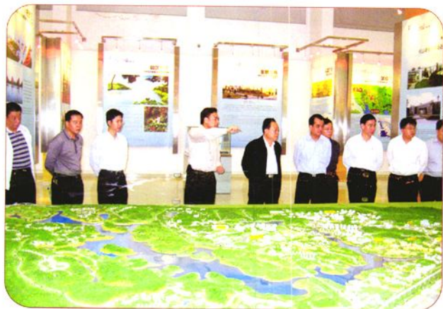
2007年11月16日，国家劳动和社会保障部副部长袁彦鹏在松山湖调研并听取工作汇报。图中左二到六分别是：市劳动局局长祁达洪、市政府副秘书长陈林佐、松山湖管委会工委书记陈建枝、副部长袁彦鹏、省劳动保障厅副厅长陈华康。