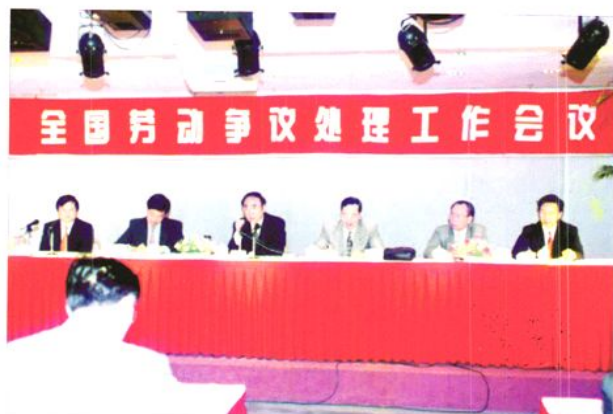
1997年11月26-28日，劳动部副部长李其炎出席在东莞召开的全国劳动争议处理工作会。