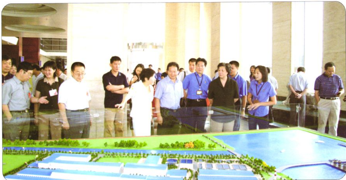
2008年9月18日，全国政协副主席、民建中央第一副主席、全国总工会副主席张榕明（前右二）率领全国政协视察团来东莞视察《劳动合同法》贯彻落实情况。图为全国政协视察团在东莞玖龙纸业有限公司视察。