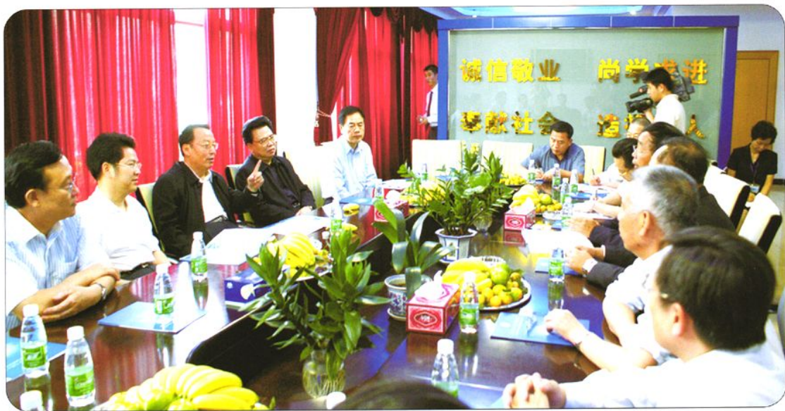
2006年11月13日，国家劳动保障部部长田成平到东莞中成化股份有限公司调研。图中，左排一至五分别为：市委常委、常务副市长冷晓明，市委书记刘志庚，劳动保障部部长田成平，副省长谢强华，省劳动保障厅厅长方潮贵。