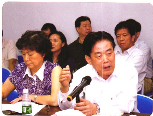
2008年10月10日，国家人力资源保障部副部长孙宝树（右一）在东莞参加企业员工代表座谈会。