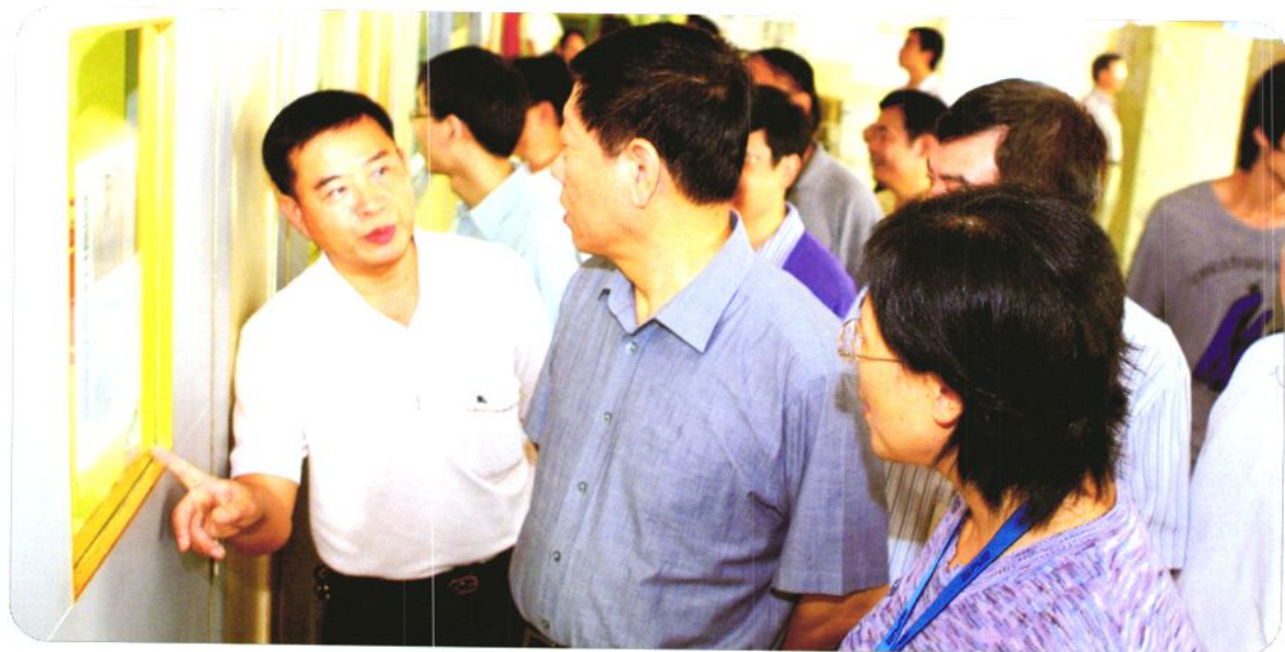
2008年10月30日，中央组织部副部长、人力资源和社会保障部部长尹蔚民（左二）在东莞市调研劳动、社会保障及人力资源等工作。