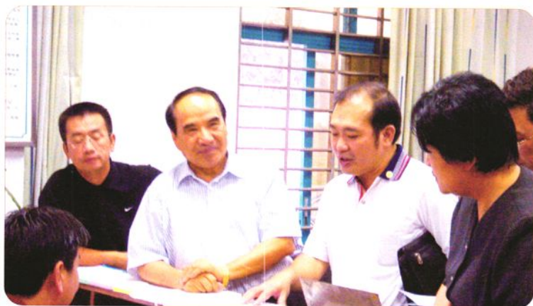
2006年5月19-21日，全国政协副主席阿不来提·阿不都热西提(左二)在省劳动保障厅副厅长郑朝阳(左三)的陪同下，来莞调研农民工合法权益保障情况。图为在寮步镇皂山村劳动服务站调研。