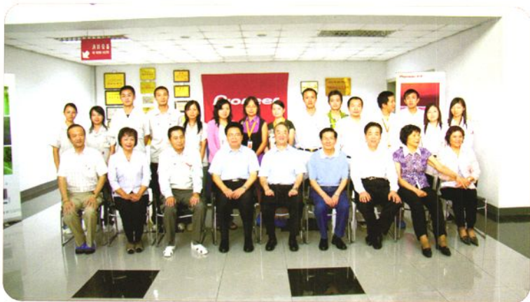
2008年10月10日，全国人大常委会副委员长桑国卫(前排左五)带领全国人大常委会执法检查组来莞检查《劳动合同法》实施情况，并与参加座谈的企业员工代表合影。