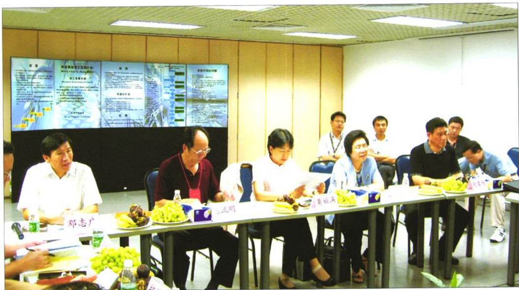
2006年8月20-21日，广东省人大常委会主任黄丽满（左三）带领省人大执法检查组来东莞检查《广东省工资支付条例》贯彻实施情况。