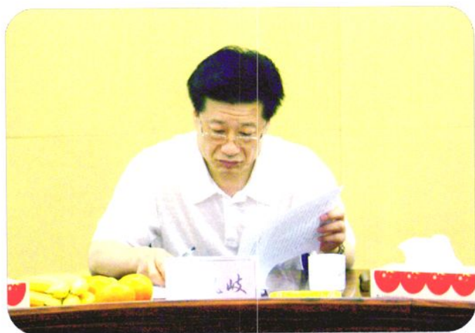
2007年10月16日，广东省劳动保障厅副厅长张凤歧到东莞市劳动局调研指导工作。