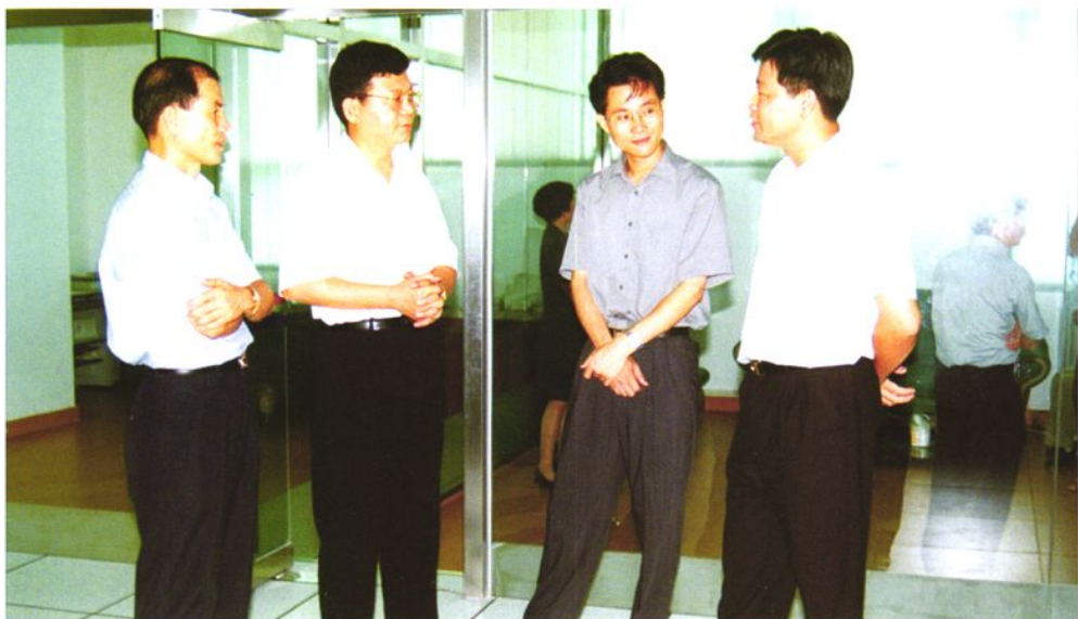
1999年8月3日，广东省劳动保障厅副厅长孙庆奇（前排右三）在东莞市委副书记林雄（前排右一）、东莞副市长蓝佛安（前排右二）及东莞市劳动局局长莫海明（前排右四）的陪同下，参观东莞市劳动力市场开业暨第三届下岗、失业职工再就业洽谈会。