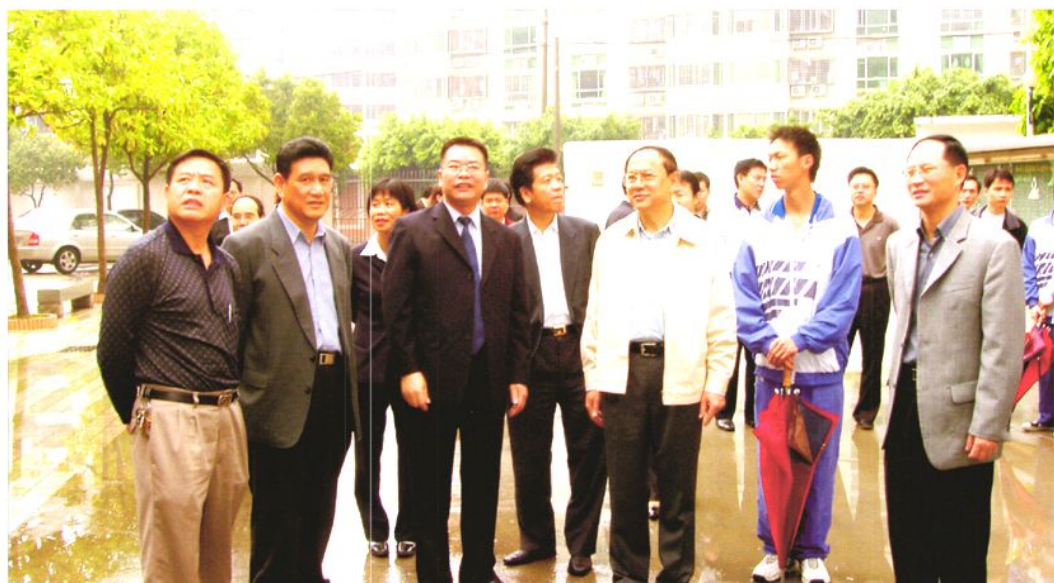
2006年3月，广东省人大常委会副主任游宁丰（右三）、广东省劳动和社会保障厅副厅长林应武（右一）在东莞市人大常委会副主任赵象明（左二）、东莞市副市长张顺光（右四）、东莞市劳动局局长祁达洪（左一）等领导的陪同下视察东莞市高级技校。