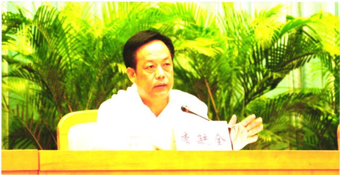
2006年5月31日，东莞市委副书记、市长李毓全在全市实施“创业东莞”工程动员会上讲话。