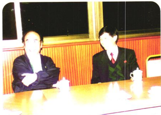
1997年11月26-28日，国家劳动部副部长李其炎出席在东莞召开的全国劳动争议处理工作会议，市委书记李近维（右一）会见了副部长李其炎（左一）。