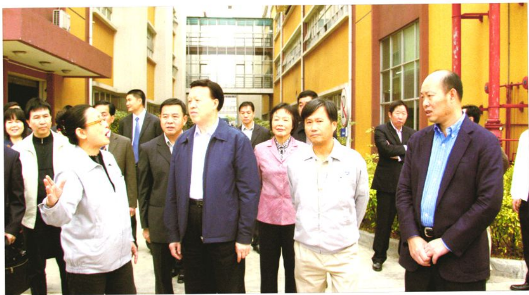
2008年12月30日，广东省委常委、副省长肖志恒（前左二）到东莞长安镇调研金融危机对企业及农民工就业情况的影响。