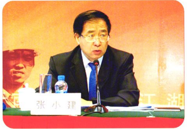
2007年5月10日，国家劳动保障部副部长张小建出席在东莞举行的全国农民工培训工作会议暨劳务输出工作示范县研修活动。