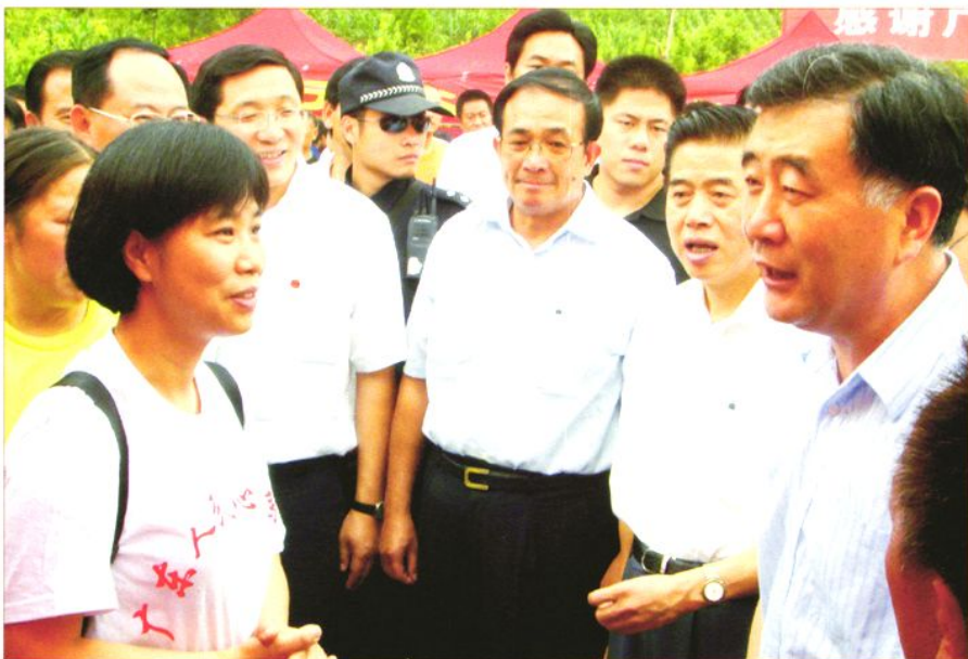
2008年7月9日，在四川省汶川县水磨镇举行的“广东省对口援助汶川县劳务输出招聘会”上，市劳动局副局长黄慧屏（左一）向中共中央政治局委员、省委书记汪洋（右一），广东省委副书记、省长黄华华（右二）等领导汇报组织企业参加招聘的情况。