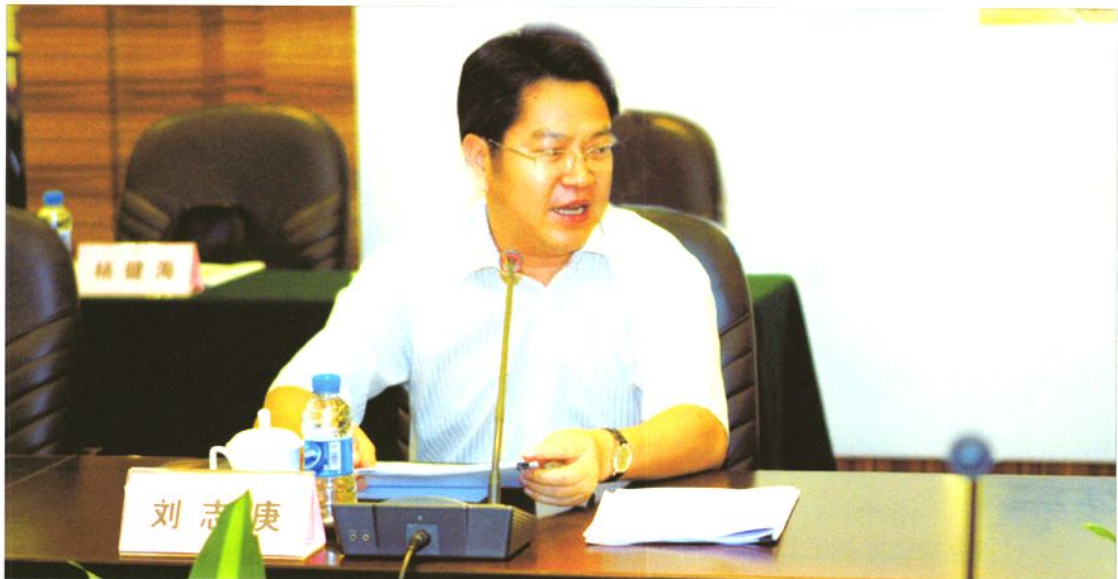
2008年10月30日，东莞市委书记、市人大常委会主任刘志庚会见来东莞调研的人力资源和社会保障部调研组，并汇报东莞市人事、劳动及社保的有关工作情况。