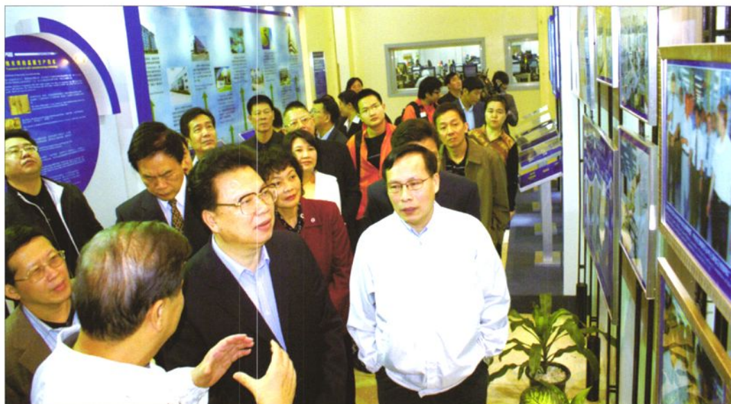
2007年3月22日，广东省副省长谢强华（前排右二）到东莞南城新科磁电厂调研农民工技能提升培训工作。