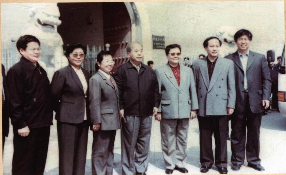
▲ 中共北京市委原书记尉建行(左四)与房山区、张坊镇、张坊村党政领导合影