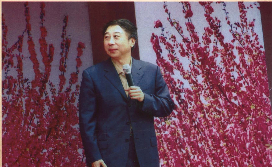
▲ 2007年著名演员冯巩来张坊大戏台慰问演出