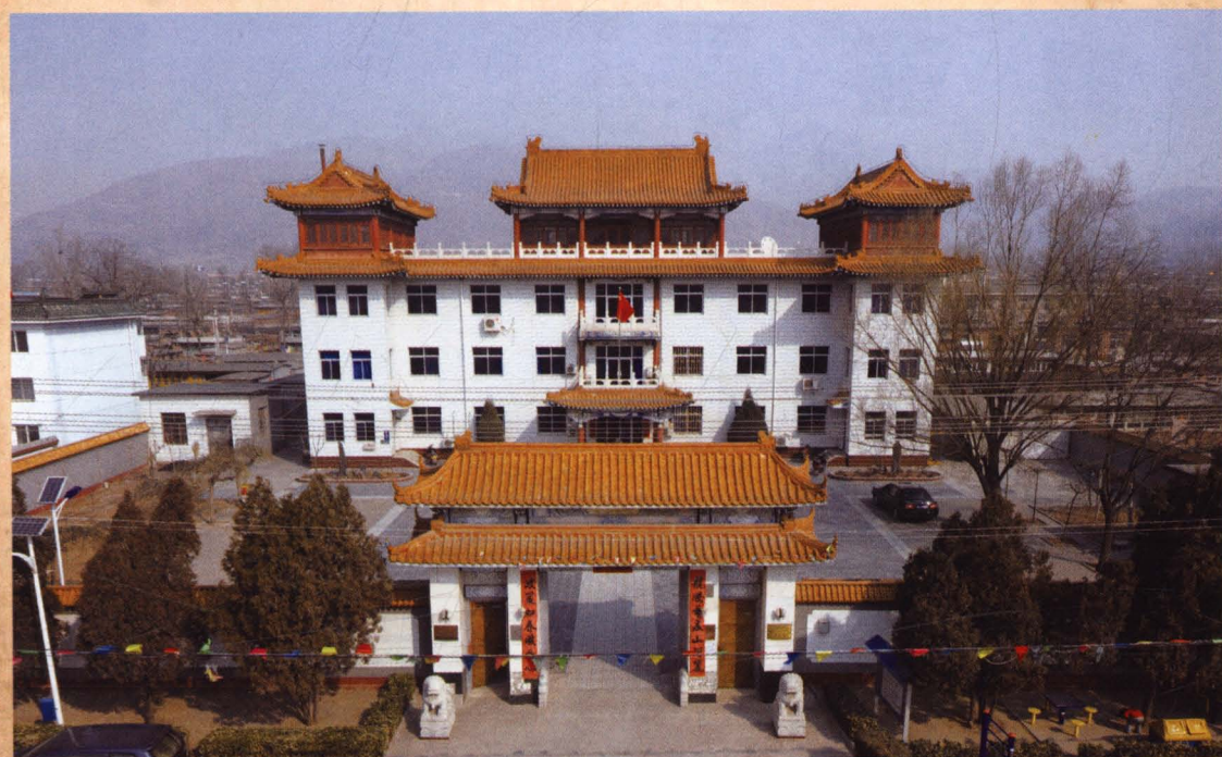
▲ 张坊村委会办公大楼