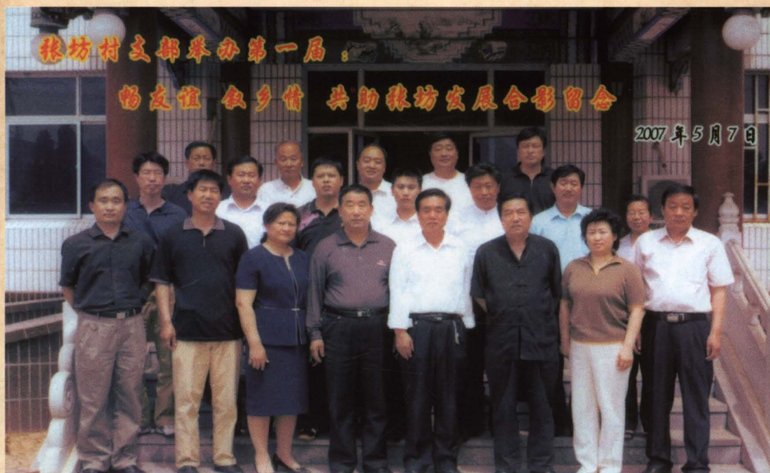
▲ 张坊村党支部举办第一届“畅友谊 叙乡情 共助张坊发展”有关人员合影