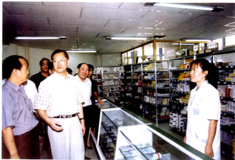
2002年8月26日,卫生部部长张文康(前左二)来院视察