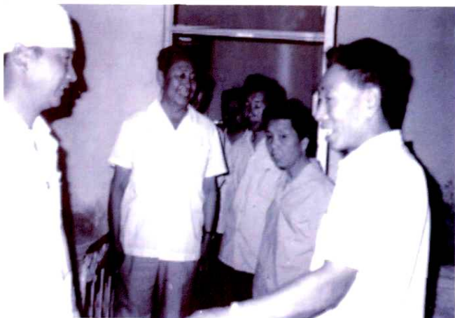
1983年7月5日,卫生部副部长杨纯(左二)来院视察