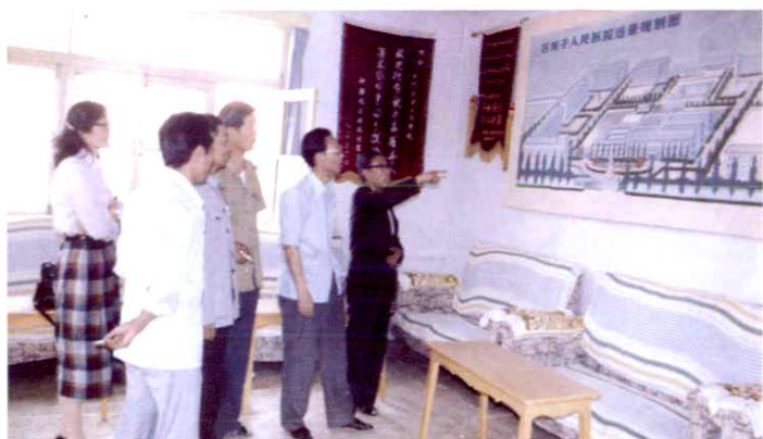
1988年9月,医院领导班子