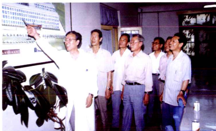
1992年5月,医院领导班子