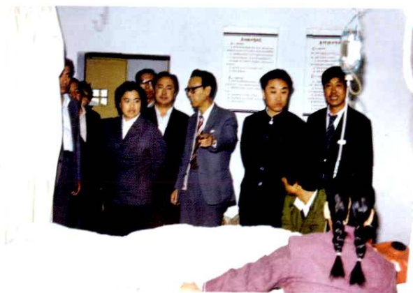
1987年10月28日,卫生部副部长何界生(右三)来院视察