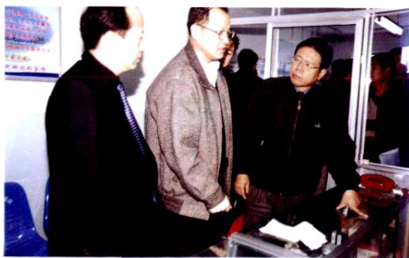
1999年11月25日,自治区卫生厅副厅长王绍生(中)来院视察