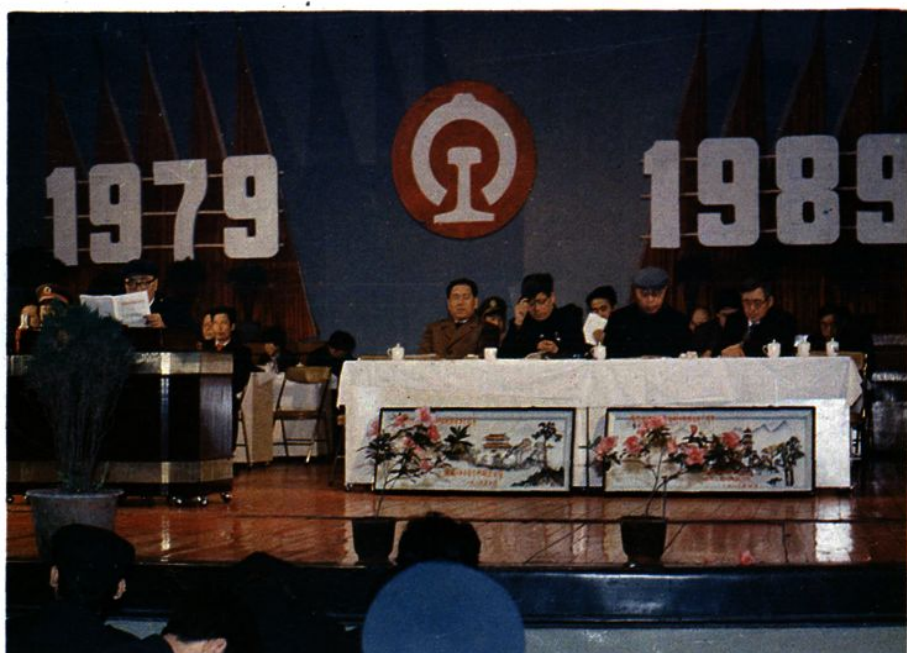
吉林分局创办集体企业十周年总结表彰大会主席台