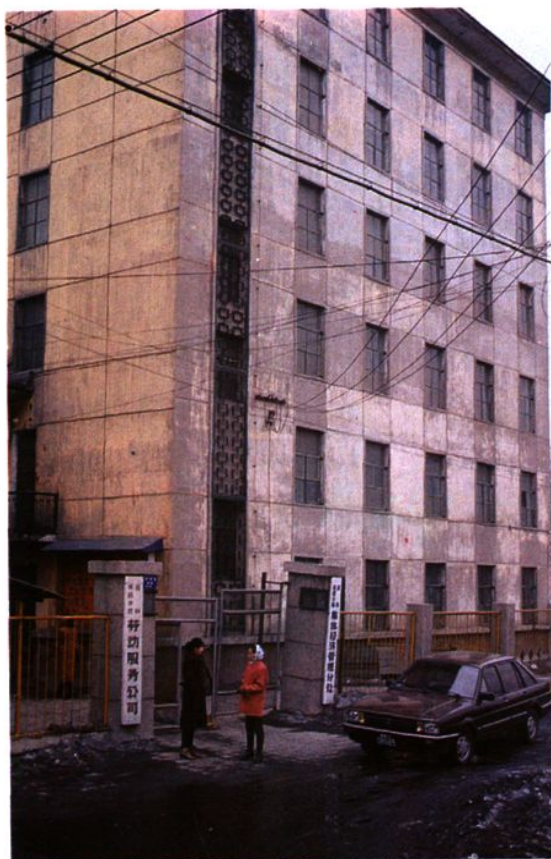
吉林分局集体经济管理分处办公楼