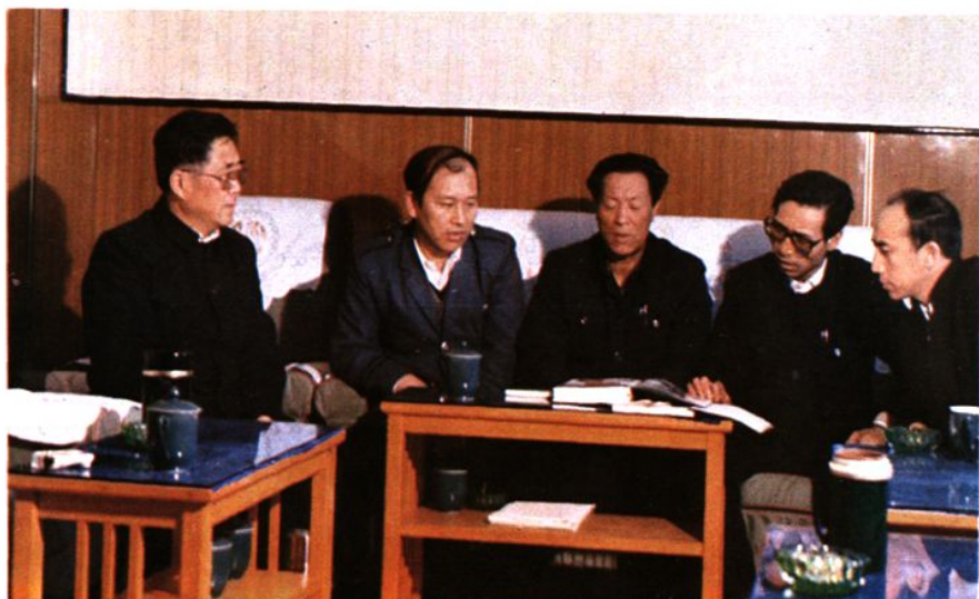
吉林分局集体经济管理分处领导 同志研究志稿