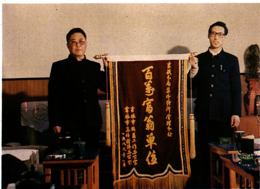
吉林市授予集体经济管理分处“百万富翁单位”称号