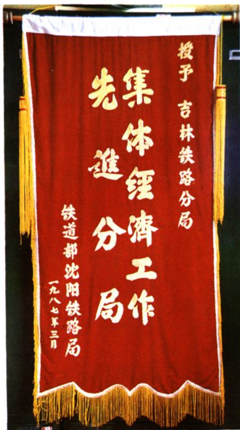
吉林分局荣获沈阳铁路局集体经济工作先进分局称号