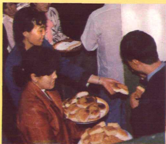
议价公司加工的鸡蛋糕