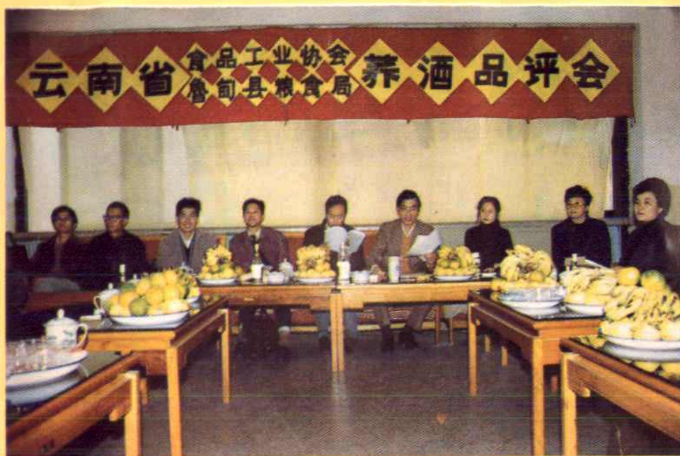
云南省食品工业协会对鲁甸县粮食局开发新产品 “荞酒”进行审评