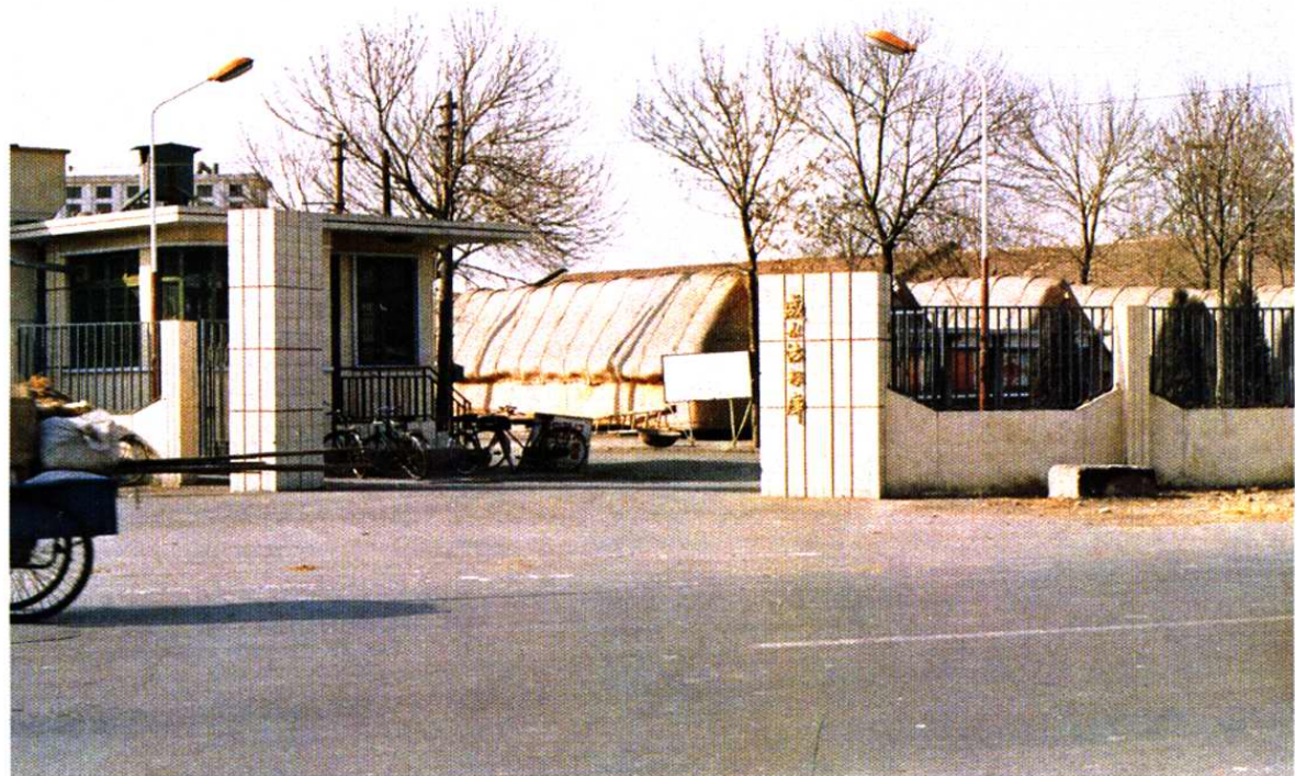
津南区粮食局所属最大的直属库—咸水沽粮库