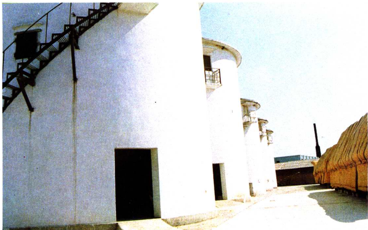
现代化组合式的储粮设施—砖园仓