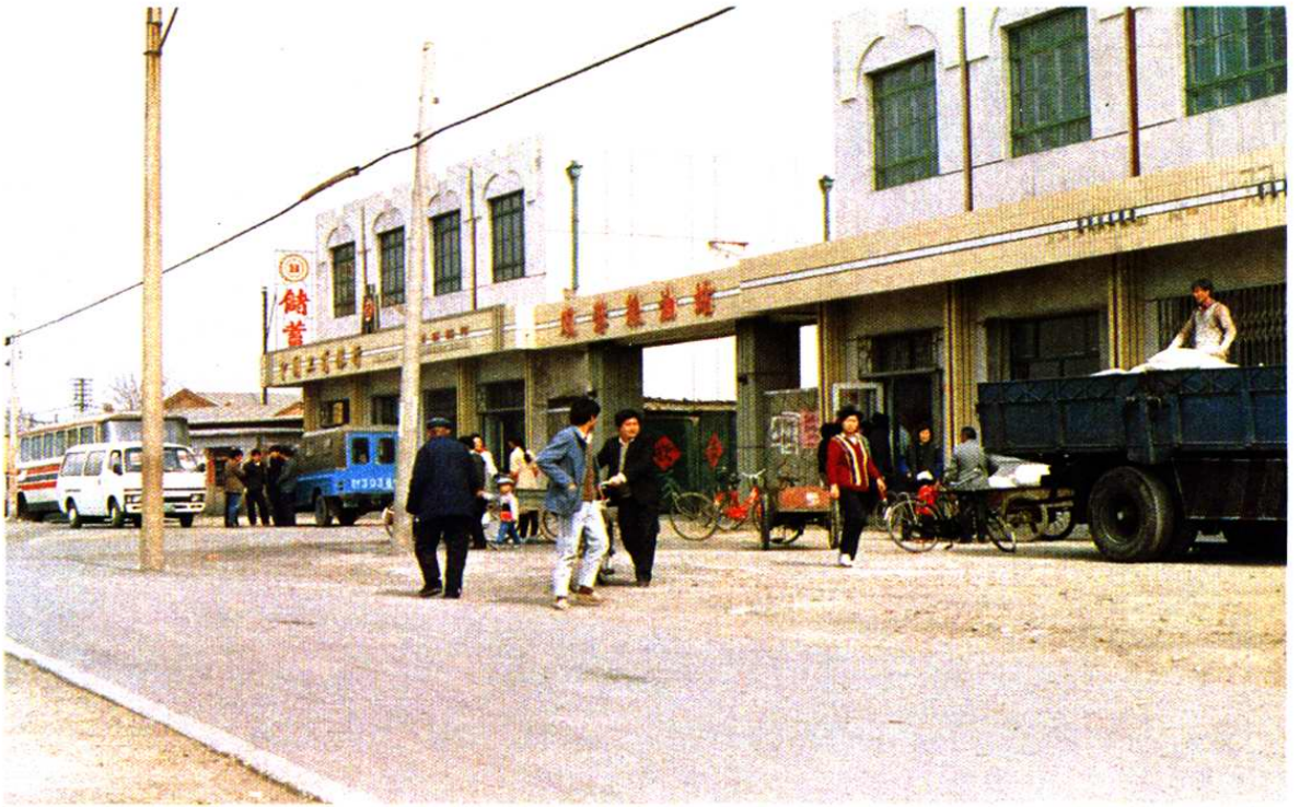
津南区粮食局所属双港粮油站外景