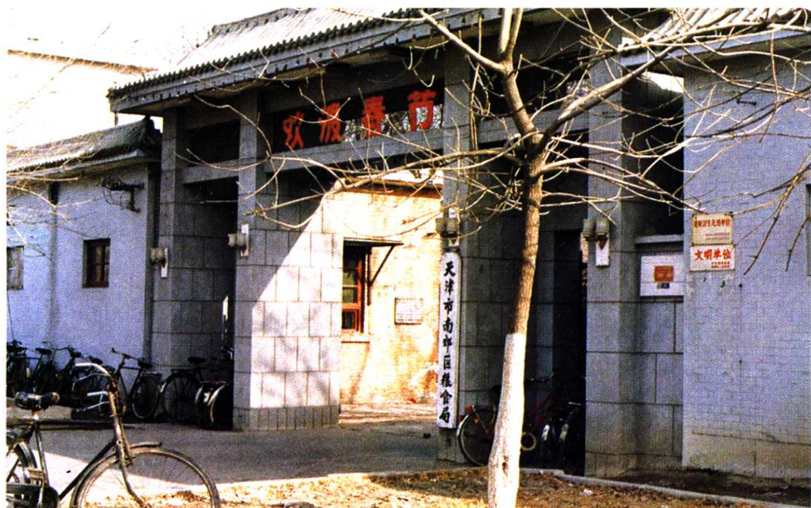
天津市津南区粮食局机关现址