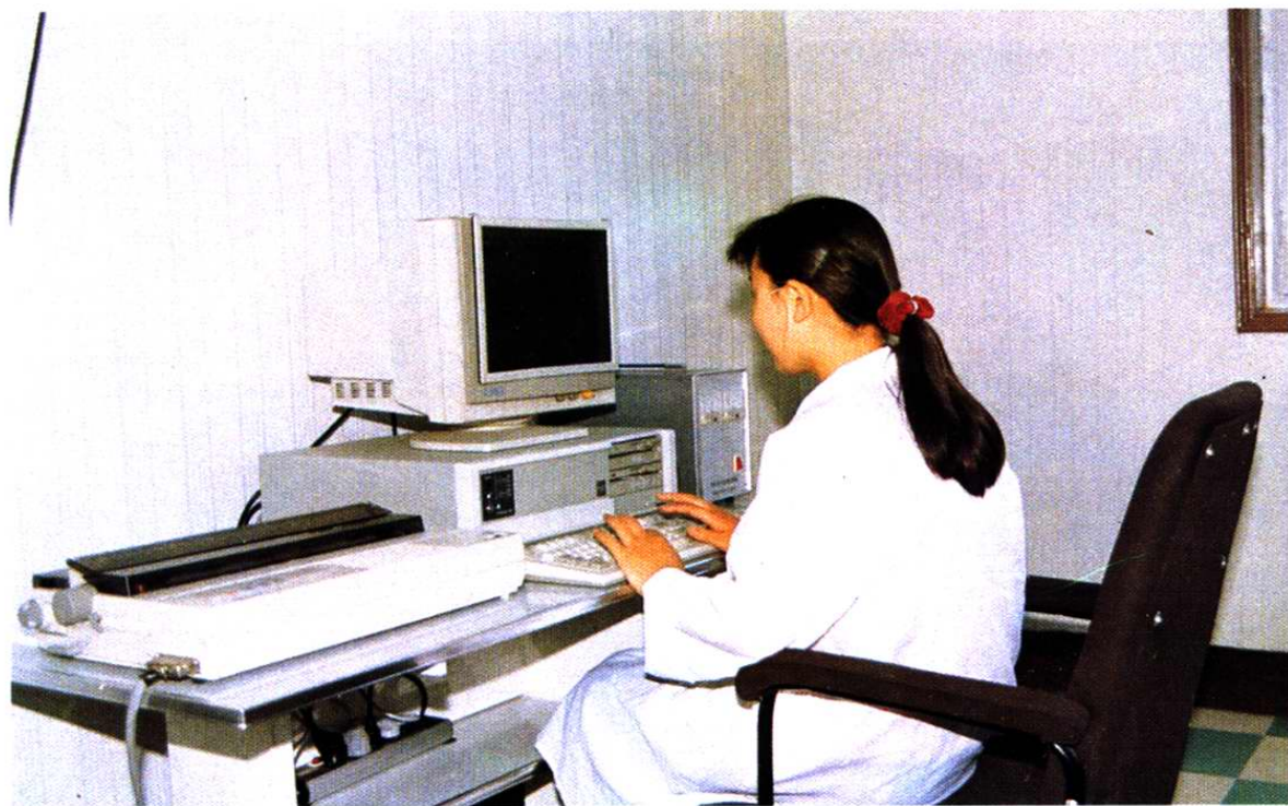
粮食保管员正在通过微机监测粮温