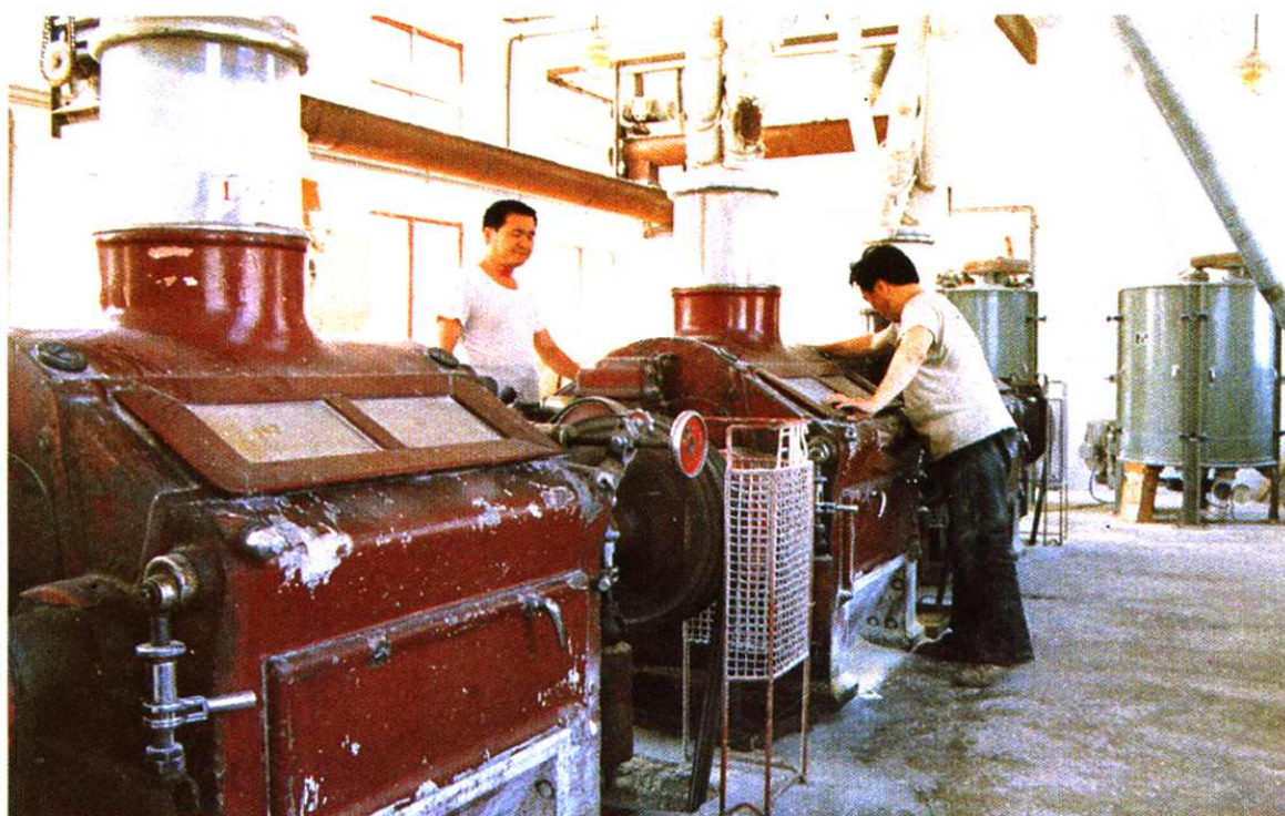
津南区粮食局粮食加工车间内景