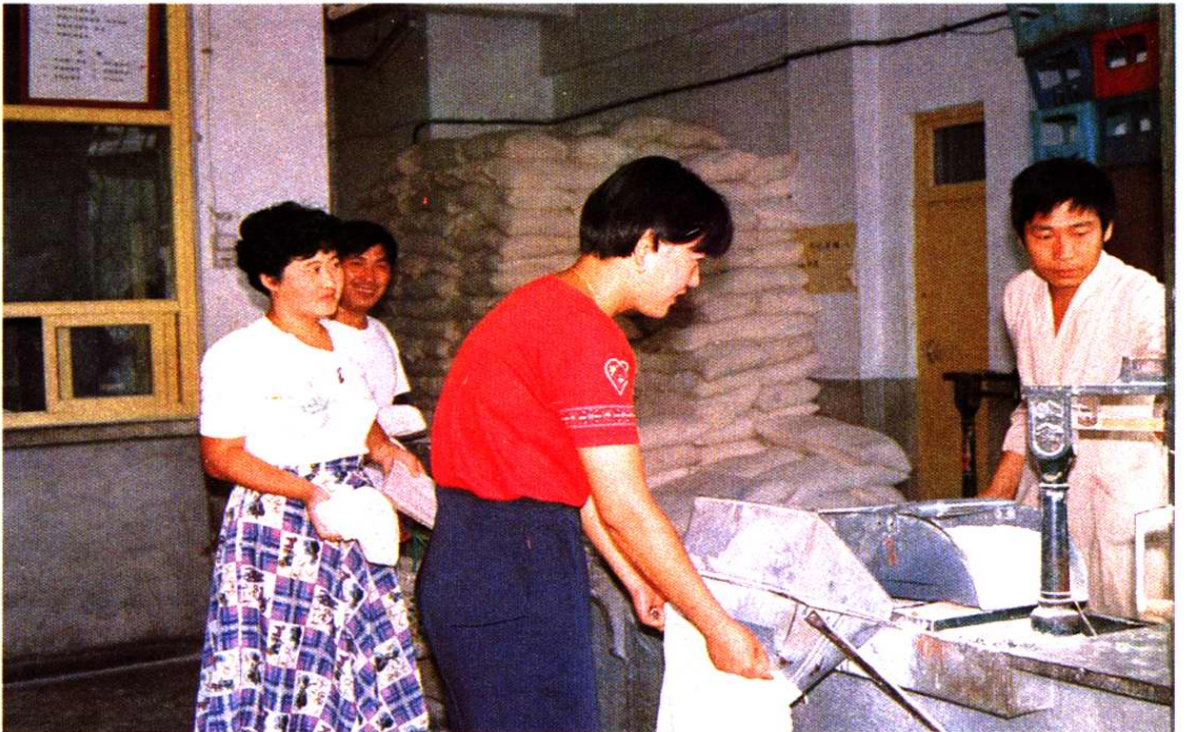
粮食零售门市部营业员正在售粮