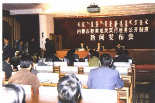
1998年11月,自治区检察院召开实行检务公开制度新闻发布会