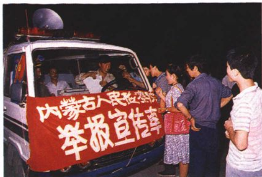
1989年8月，自治区检察院在街头开展举报宣传