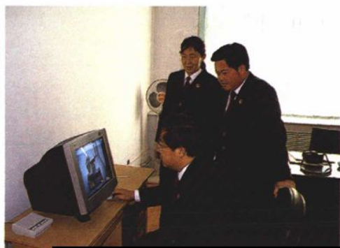
运用技术手段收集固定证据