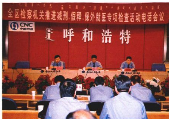
2004年7月,召开全区检察机关推进减刑、假释、保外就医专项检查活动电话会议