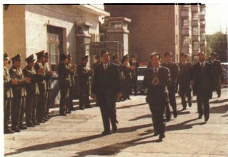
1993年3月,最高人民检察院副检察长陈明枢(右一)到自治区检察院调研指导工作