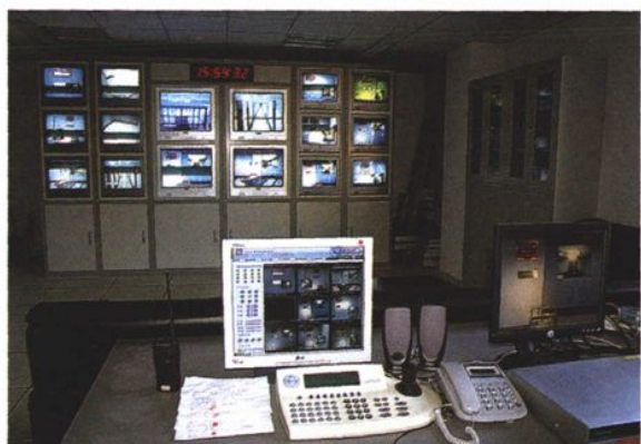
设施先进的自治区检察院警务区