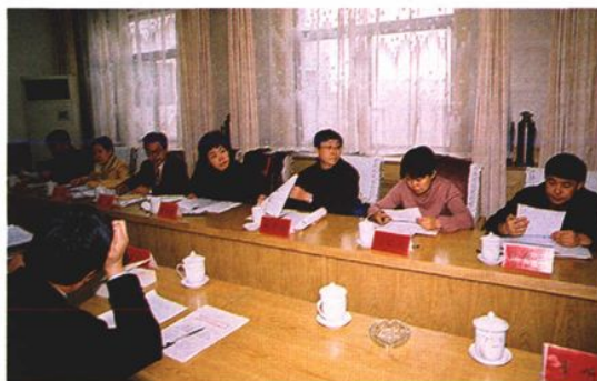
2004年2月,自治区检察院首次启动人民监督员程序对拟不批捕案件进行监督