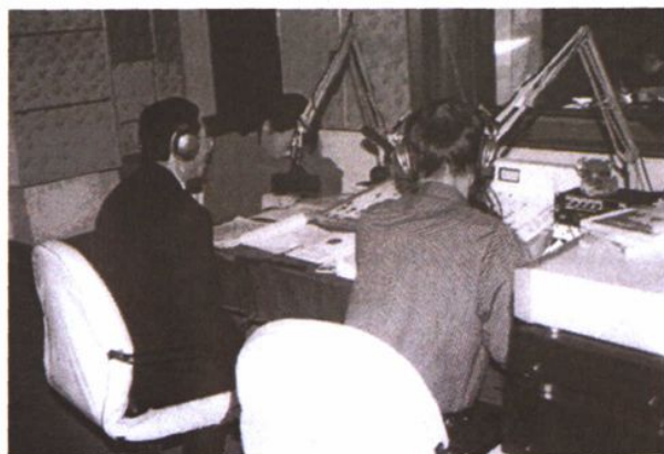
检察官通过媒体向广大 听众进行法制宣传