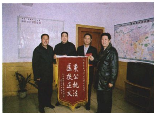
2003年，包头钢铁公司给自治区检察院赠与锦旗，称赞民事行政检察工作为企业“秉公执法，匡扶正义”