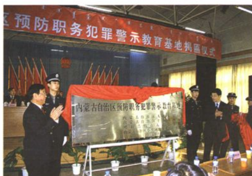
2005年12月,内蒙古自治区预防职务犯罪警示教育基地建立