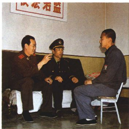
监所检察人员耐心帮教服刑人员