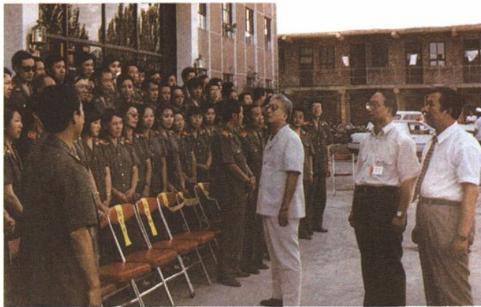
1993年8月,最高人民检察院检察长张思卿在呼和浩特市主持召开全国东北华北片检察长座谈会。右图为会议期间张思卿检察长到自治区检察院看望广大检察人员