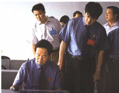
2005年7月,最高人民检察院检察长贾春旺(前排左二)在自治区党委副书记陈光林(前排右二)、自治区党委政法委书记罗啸天(前排左一)的陪同下到自治区检察院视察工作并与自治区检察院领导合影留念。右图为贾春旺检察长在自治区检察院计算机培训室亲自操作电脑