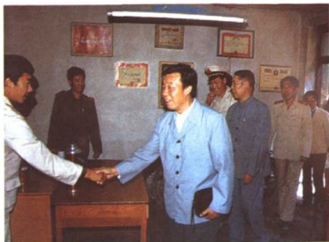
1987年,最高人民检察院副检察长王晓光(前左二)到内蒙古视察指导检察工作