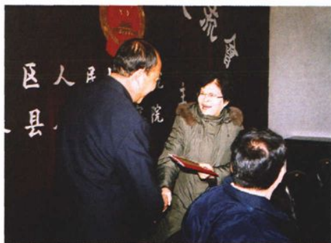
2005年1月,最高人民检察院副检察长胡克惠(左二)到自治区基层检察院调研指导工作并慰问检察人员