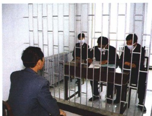
2003年“非典”期间，检察人员坚持办案