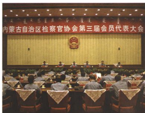
2004年8月,自治区检察官协会召开第三届会员代表大会