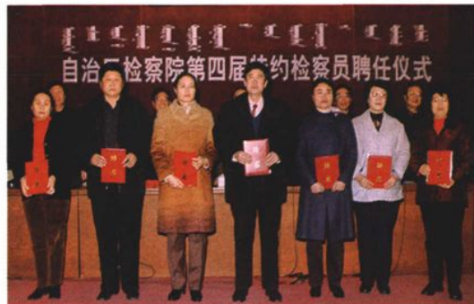
2003年12月,自治区检察院为第四届特约检察员颁发聘书