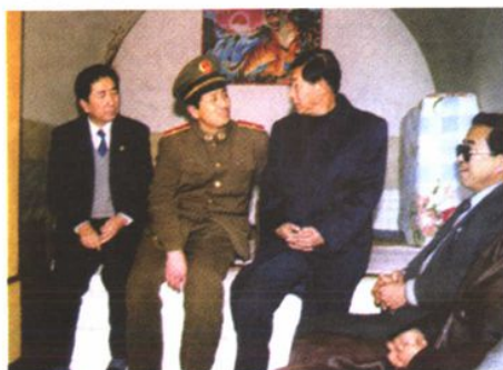
2000年1月,最高人民检察院纪检组长王克(左三)慰问自治区基层检察人员