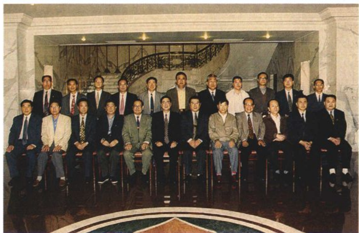
1998年9月，在内蒙古视察工作的全国人大常委会委员长李鹏与自治区检察院、法院、公安等司法机关负责人合影留念，自治区党委书记刘明祖（前右六）、自治区主席云布龙（前左五）、自治区党委副书记王占（前右四）、自治区党委政法委书记万继生（前左三）等陪同