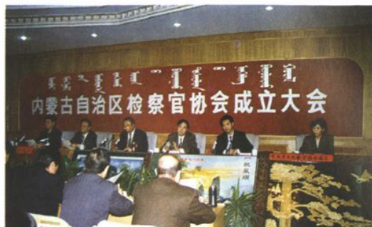
1997年2月,自治区检察官协会成立