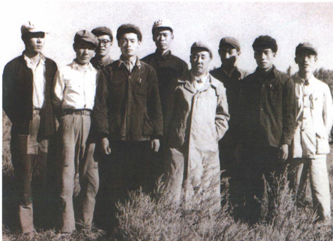
1959年8月,自治区检察院部分干警在武川县下放劳动锻炼时合影