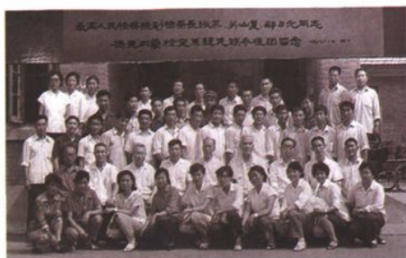
1981年7月,内蒙古检察系统民族参观团到北京受到高检院领导的接见