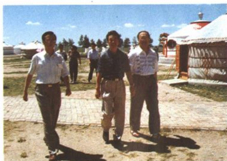
1995年8月,最高人民检察院副检察长梁国庆(左二)到内蒙古调研指导检察工作