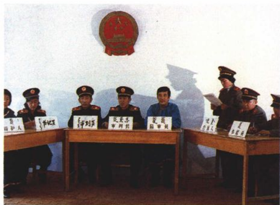
使用少数民族语言文字出庭公诉