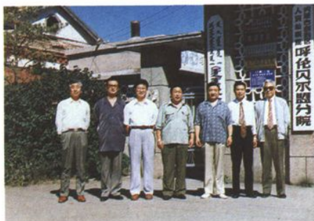
1995年8月,最高人民检察院副检察长王文元(右三)到呼伦贝尔盟视察工作