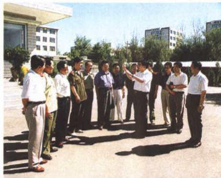
2000年8月,最高人民检察院检察长韩杼滨(左三)在内蒙古视察检察工作期间与自治区党委书记刘明祖(右三)亲切见面并与自治区检察院部分领导合影留念。右图为韩杼滨检察长到通辽市检察机关指导工作