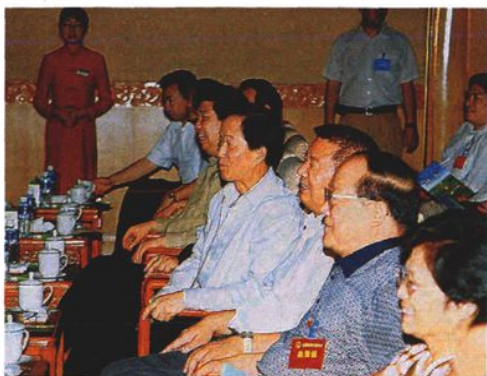
2005年7月28日,全国检察长座谈会在呼和浩特召开。会议期间,最高人民检察院检察长贾春旺(右四),副检察长张耕(右二)、邱学强(右五)、胡克惠(右一)等领导在自治区党委政法委书记罗啸天(右三)陪同下,视察检察工作