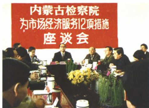
1993年1月,自治区检察院召开为市场经济服务12项措施座谈会