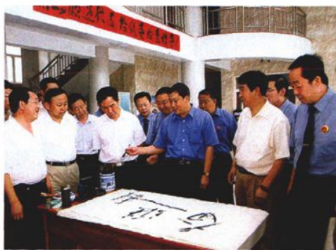
2005年8月,最高人民检察院副检察长姜建初(右三)到乌兰察布市集宁区检察院调研指导工作