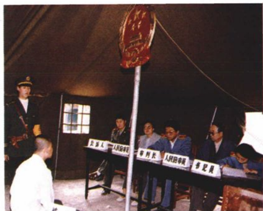
1996年5月，包头市地震期间检察人员在简易的帐篷内出庭公诉