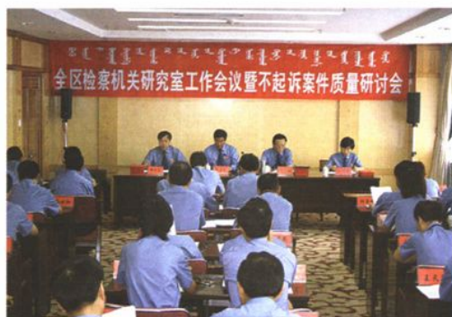
2005年8月,自治区检察院召开全区检察机关研究室工作会议暨不起诉案件质量研讨会