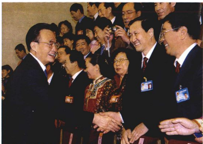
2005年3月，全国人大常委会委员长吴邦国接见出席第十届全国人大三次会议的内蒙古代表团成员。这是吴邦国与列席人代会的自治区检察院检察长邢宝玉亲切握手