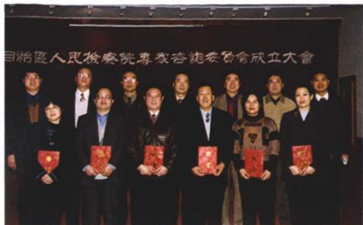
1999年12月,自治区检察院专家咨询委员会成立