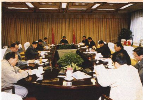
2003年5月,自治区党委专门召开会议,听取自治区检察工作汇报