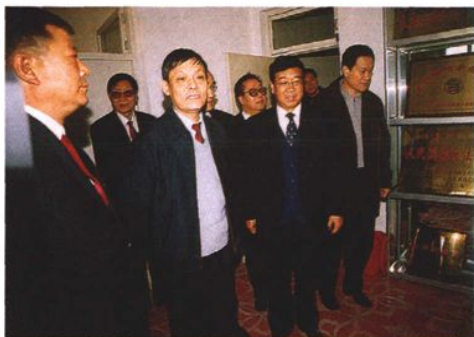
2003年12月,最高人民检察院纪检组长叶青纯(左二)到内蒙古调研指导工作