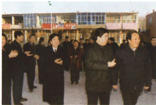
2002年12月16~17日,最高人民检察院副检察长邱学强(右二)在自治区党委政法委书记胡忠(右一)的陪同下到呼和浩特市检察机关视察慰问