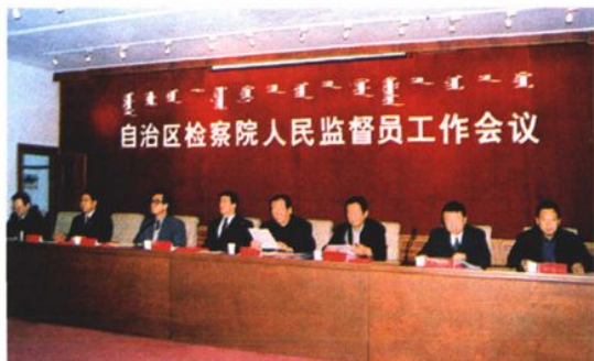
2003年11月,自治区检察院召开人民监督员工作会议,并向人民监督员颁发证书