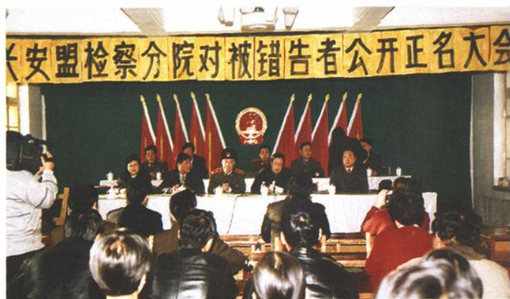
兴安盟检察院召开 对被错告者公开正名大会