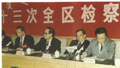
1997年2月,最高人民检察院副检察长赵登举(右二)出席第十三次全区检察工作会议