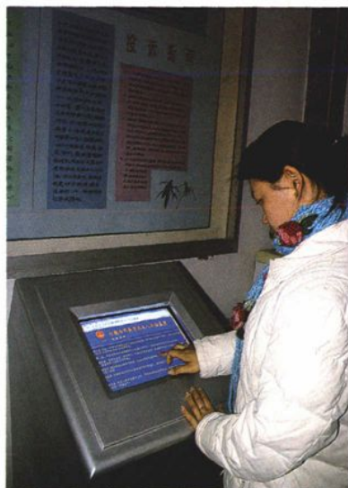
通过电脑系统查询申诉指南和检务公开内容