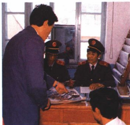
1989年10月，“两高”通告期限内犯罪人员向检察机关投案自首