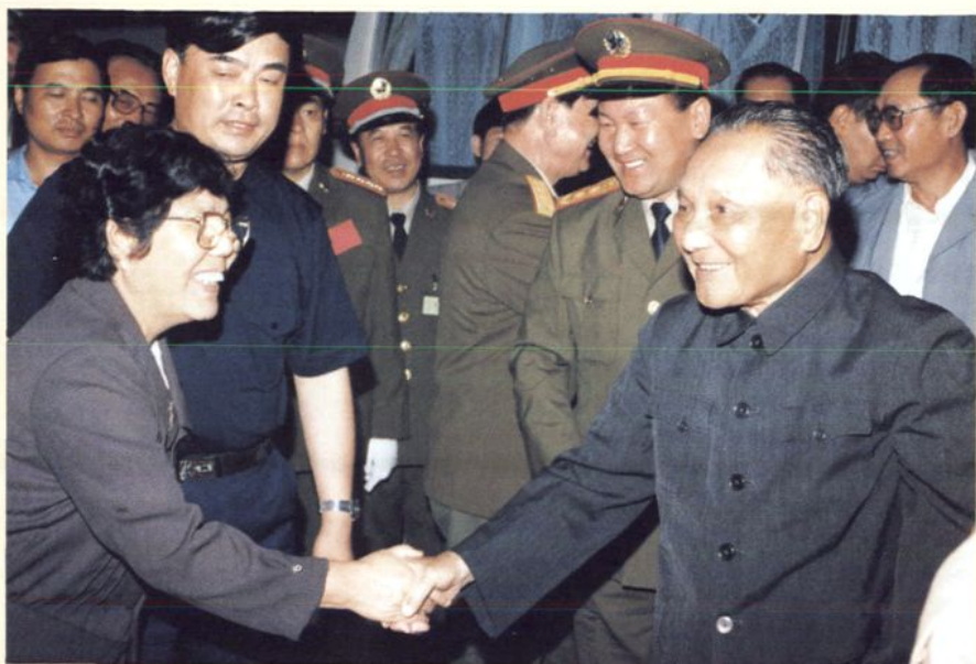
1990年9月，邓小平来辽宁时接见省有关领导，公安机关负责警卫工作