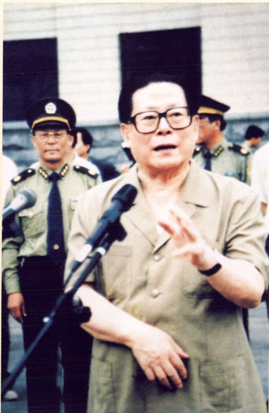
1995年6月16日，中共中央总书记、国家主席、中央军委主席江泽民视察辽宁省公安厅，公安机关负责警卫工作