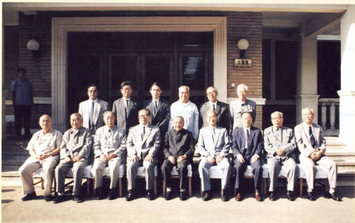
1990年9月，邓小平和江泽民、宋平同辽宁省党政领导合影，公安机关负责警卫工作