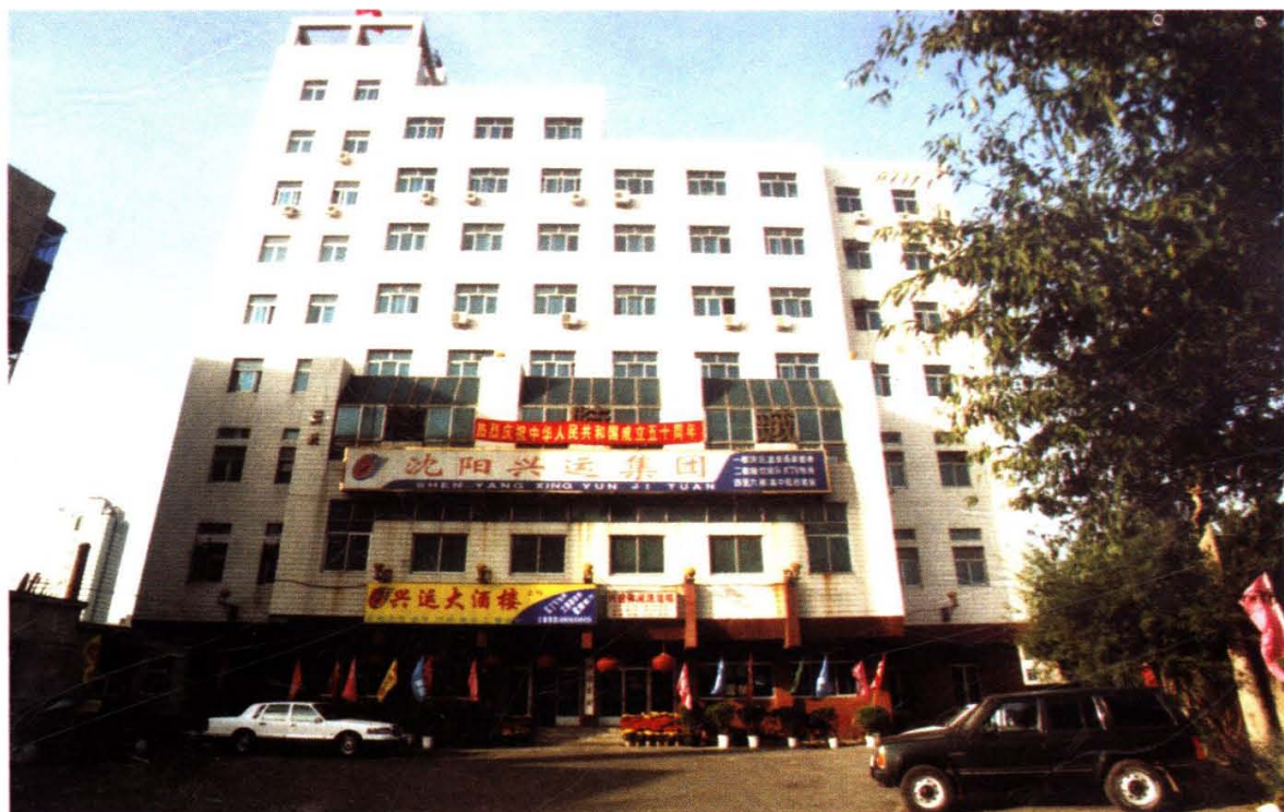
沈阳兴运集团总部