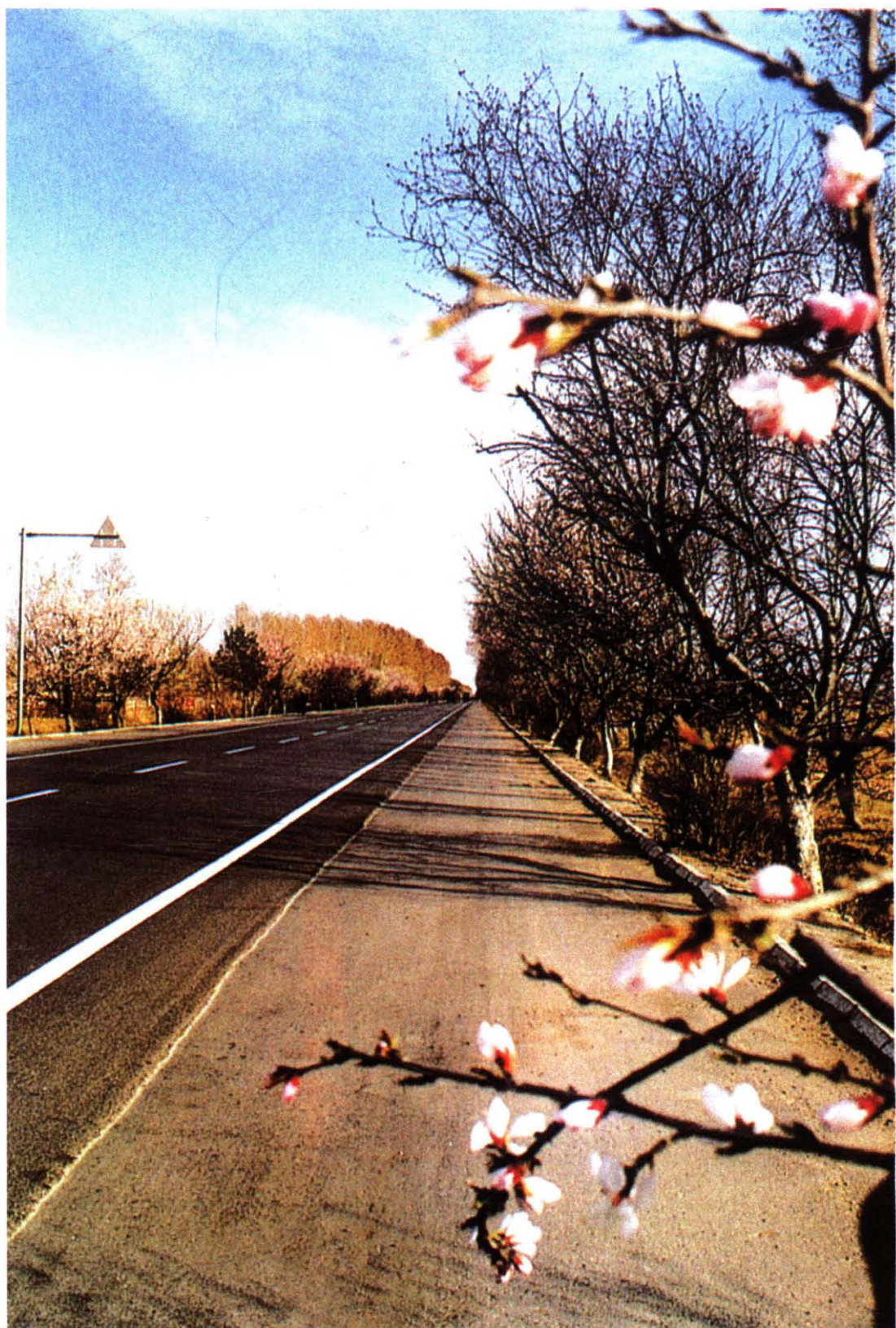
国家级文明样板路-102 国道沈阳段