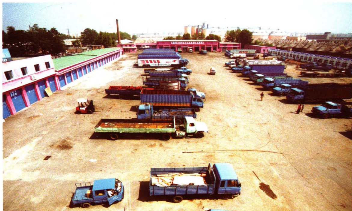
沈阳兴运集团柳条湖货运站