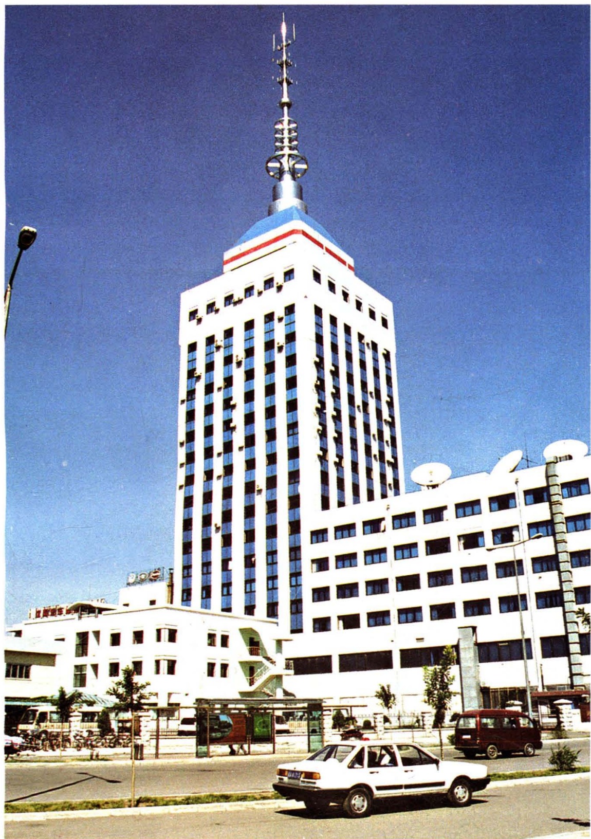
沈阳市交通运输管理局办公大楼