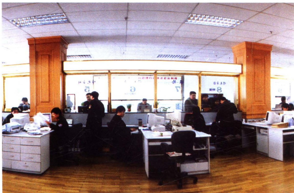
沈阳市车辆购置附加费征费大厅