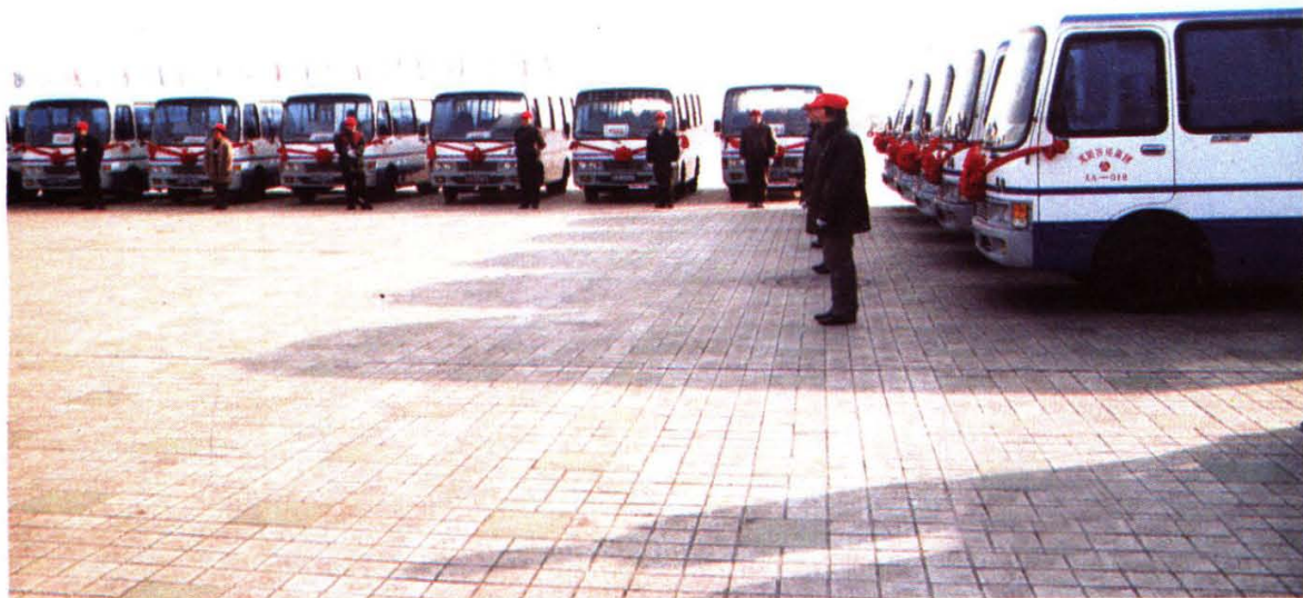
安运集团至“九五”期末已开辟中巴线路 6 条拥有中巴汽车 200 台