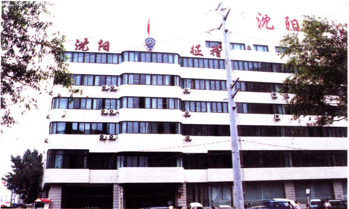
沈阳市车辆购置附加费征收管理办公室办公楼