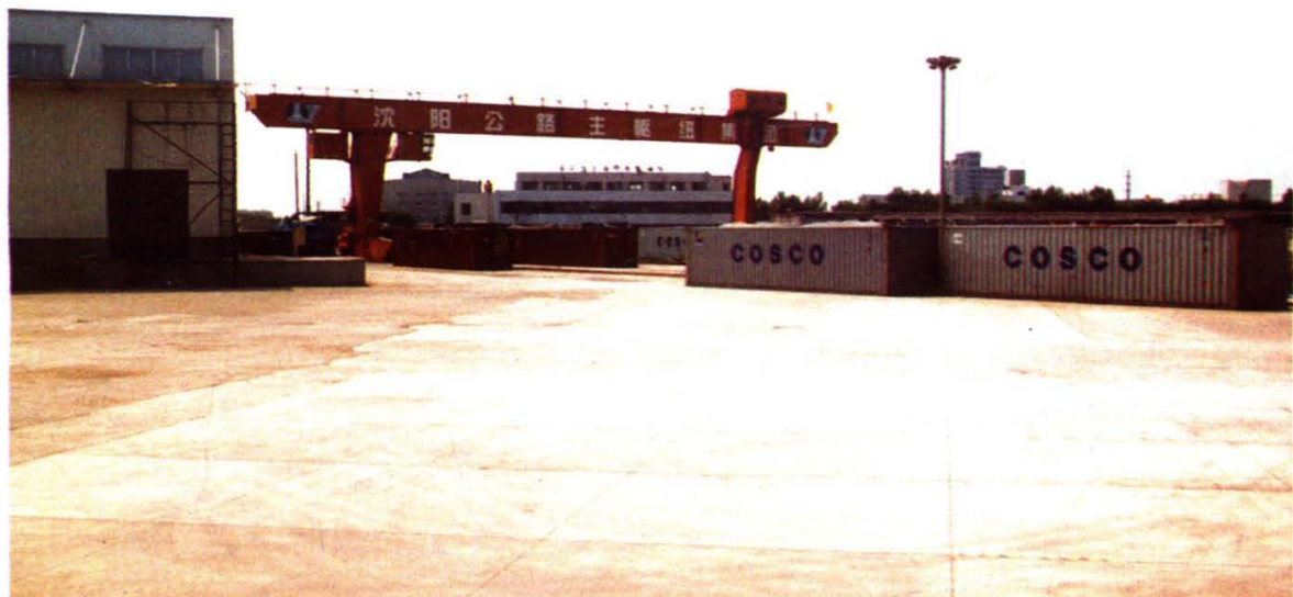
沈阳运输集团公司中心货运站集装箱场区