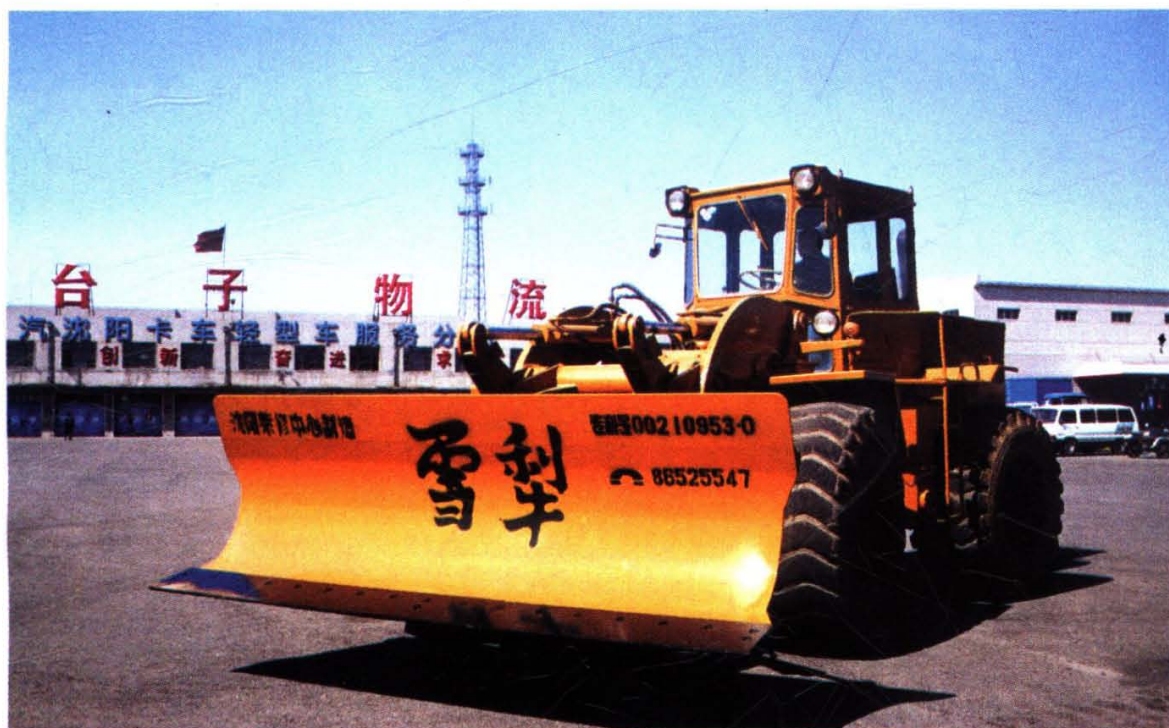
沈阳公路主枢纽三台子货运站多功能推雪板