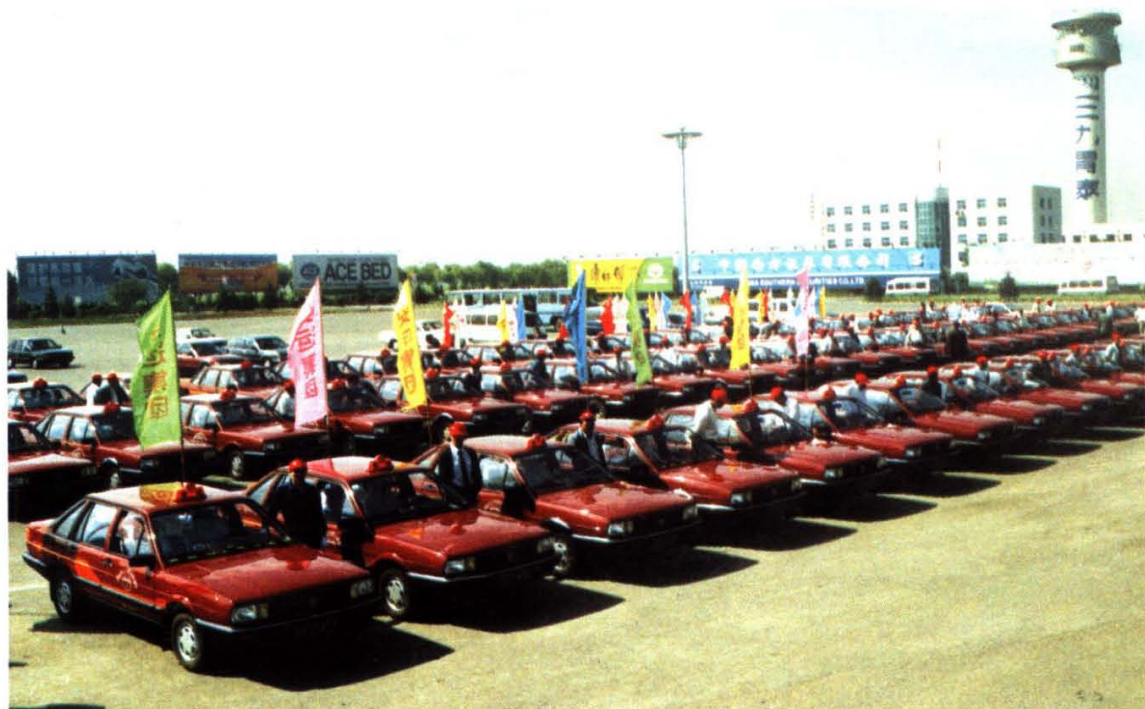
安运集团至“九五”期末拥有出租汽车 1600 台居沈阳市出租汽车企业之首