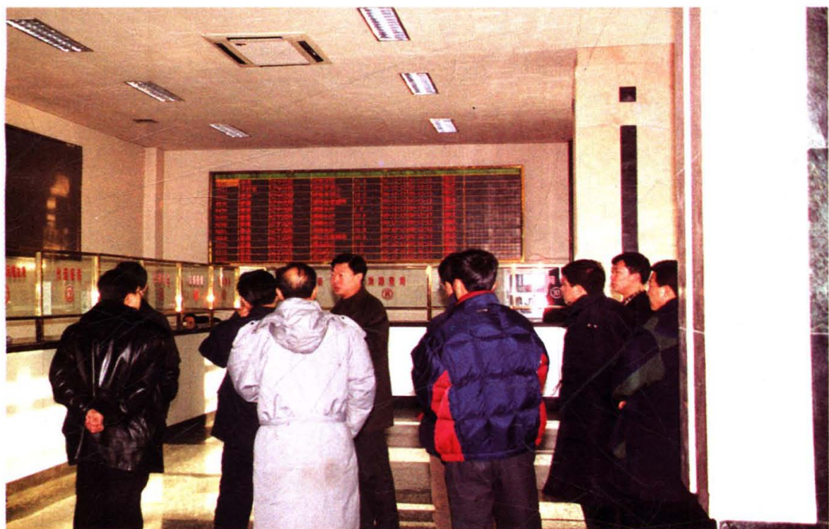
沈阳运输集团公司货运信息交易系统电子大屏幕