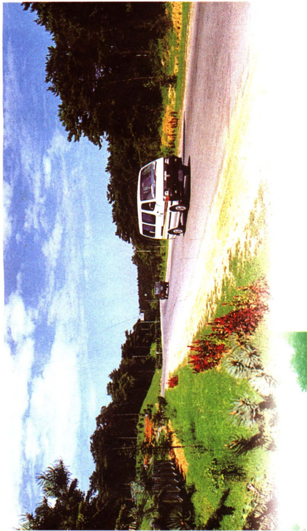
沈阳棋盘山旅游公路