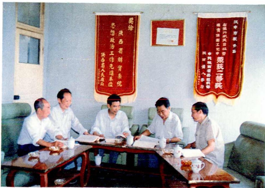
编纂成员研究税志资料。