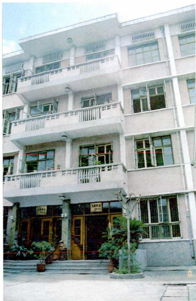
汉中市税务局办公楼