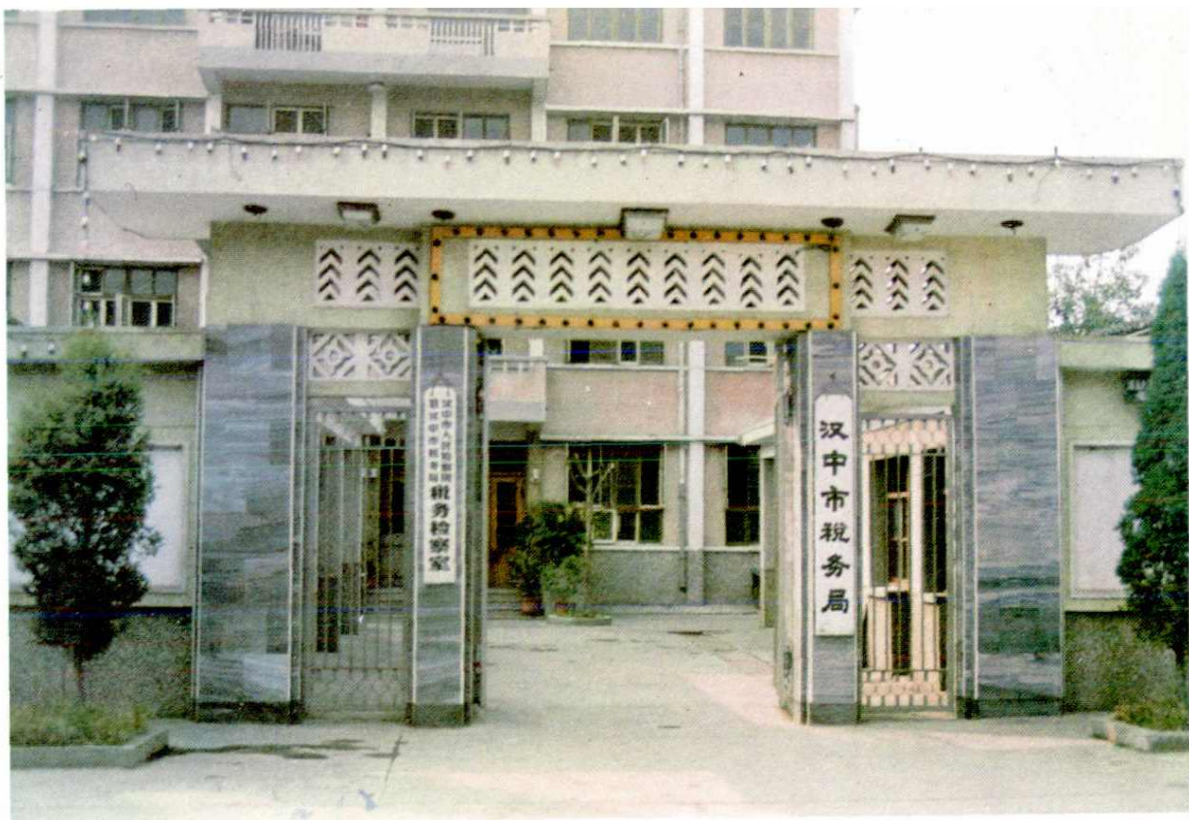
汉中市税务局门景