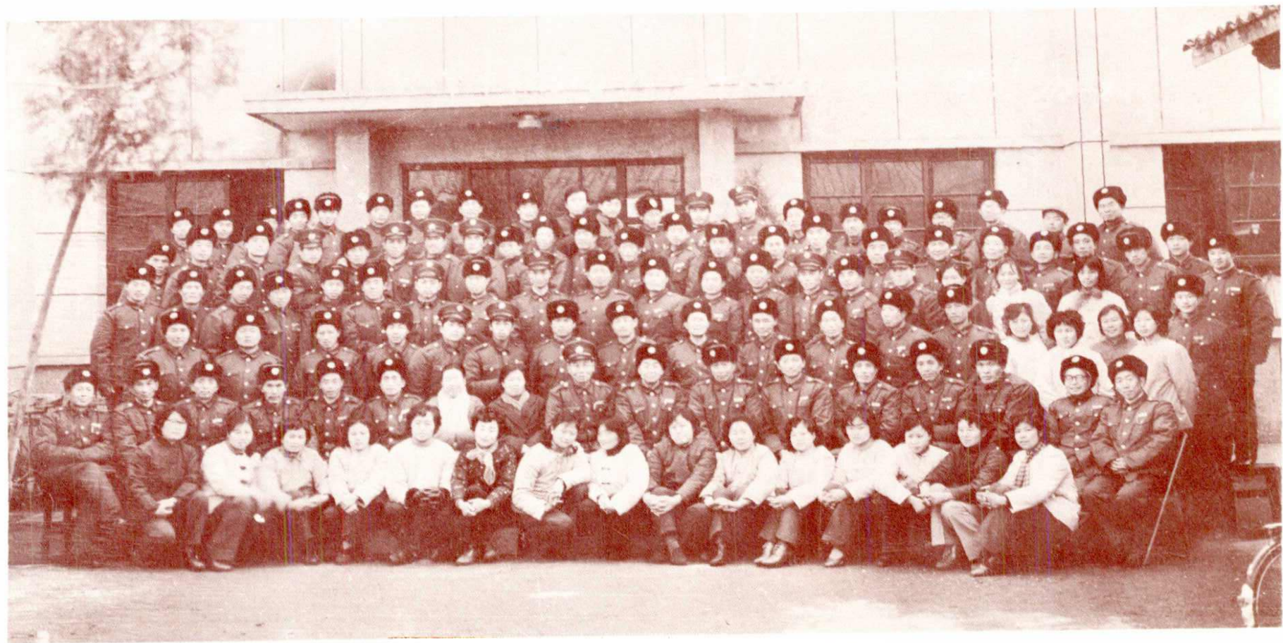
市局一九八三年工作总结表彰先进大会全体同志合影。