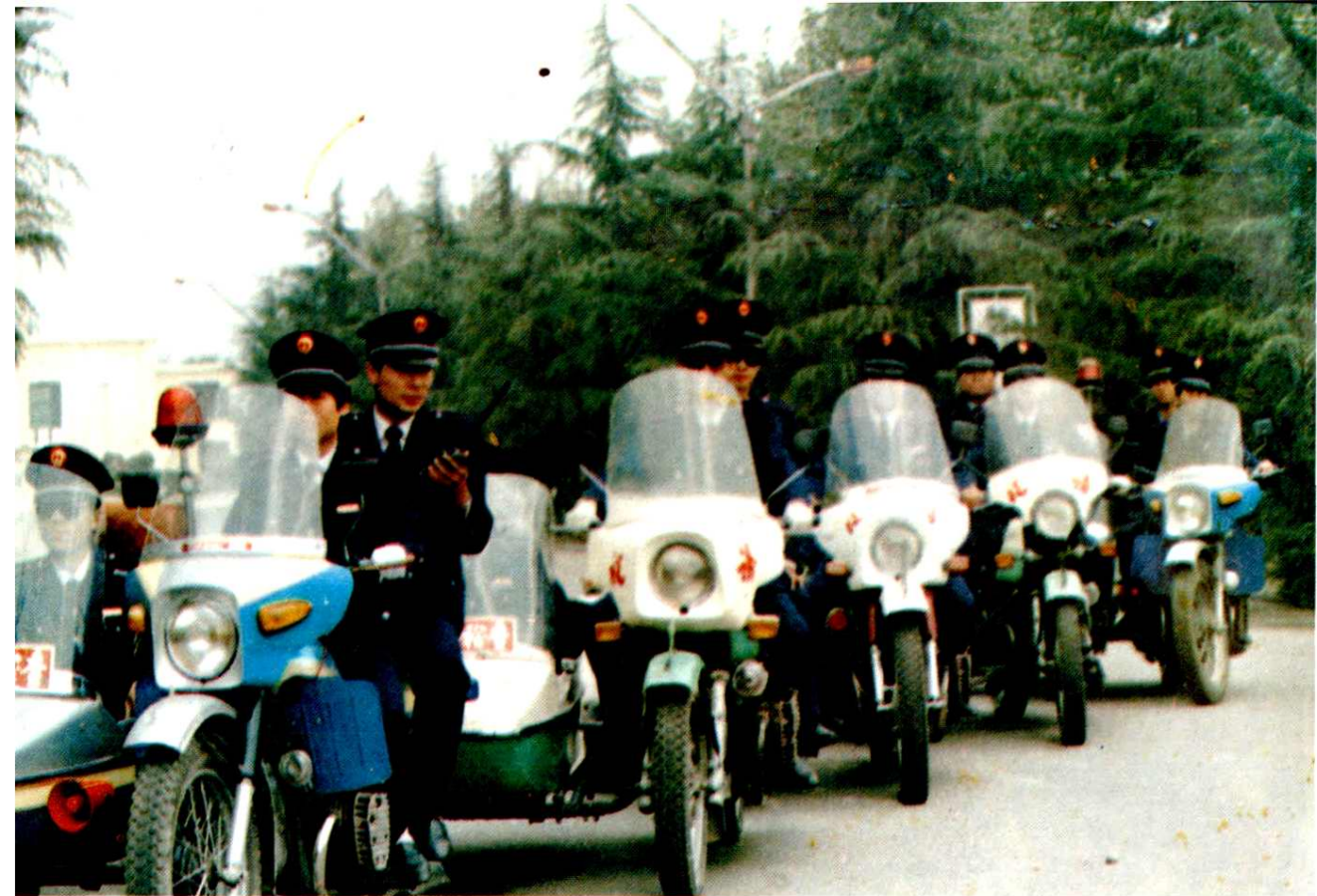
市局在强化税收征管中，1986年成立了税收稽查队，图为税收稽查队队员即待命出发执行任务。