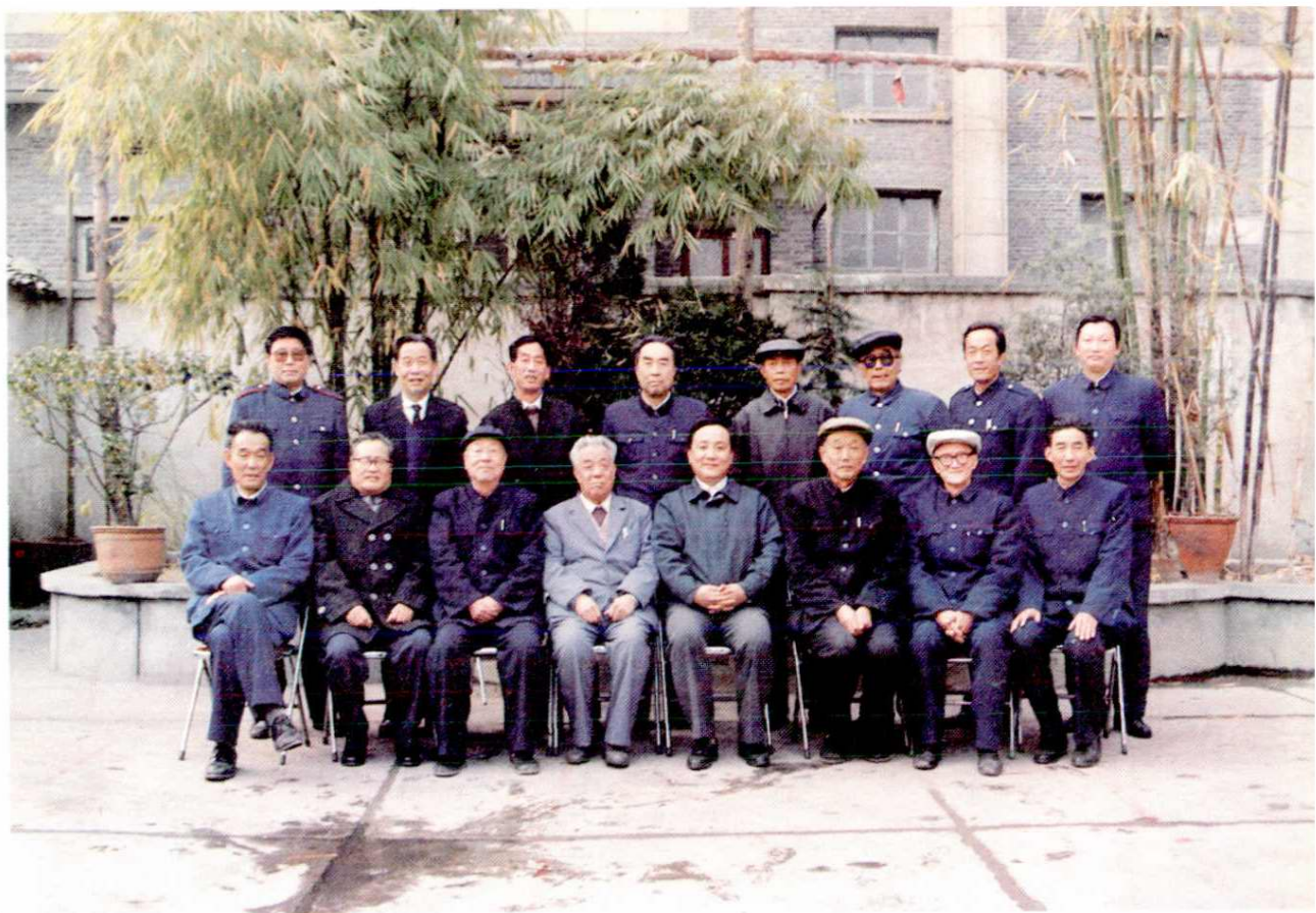
参加评审会议省、地、市领导和市局历任正副局长合影