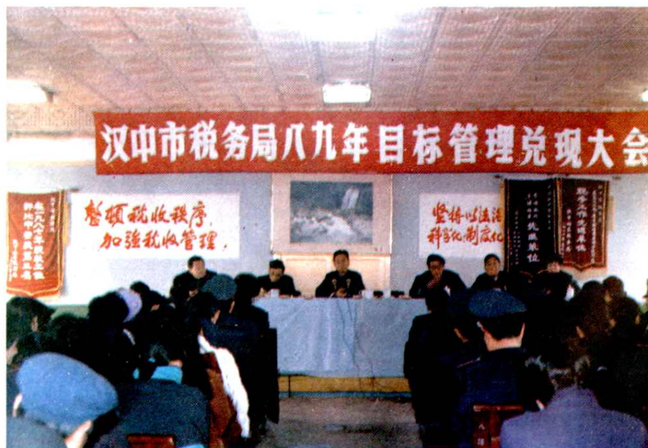
市局改革征管，实行“目标管理”。图为一九八九年召开的目标管理兑现大会。