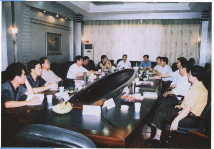
县委、县政府领导向省厅领导 汇报袁多线改造规划（县东湖 宾馆）