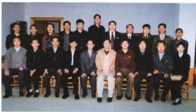
《都昌县交通志》编纂委员会 会委员合影