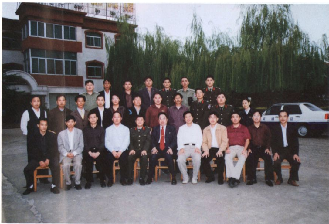
中共江西省交通厅党委书记程受锭与都昌交通系统负责人合影