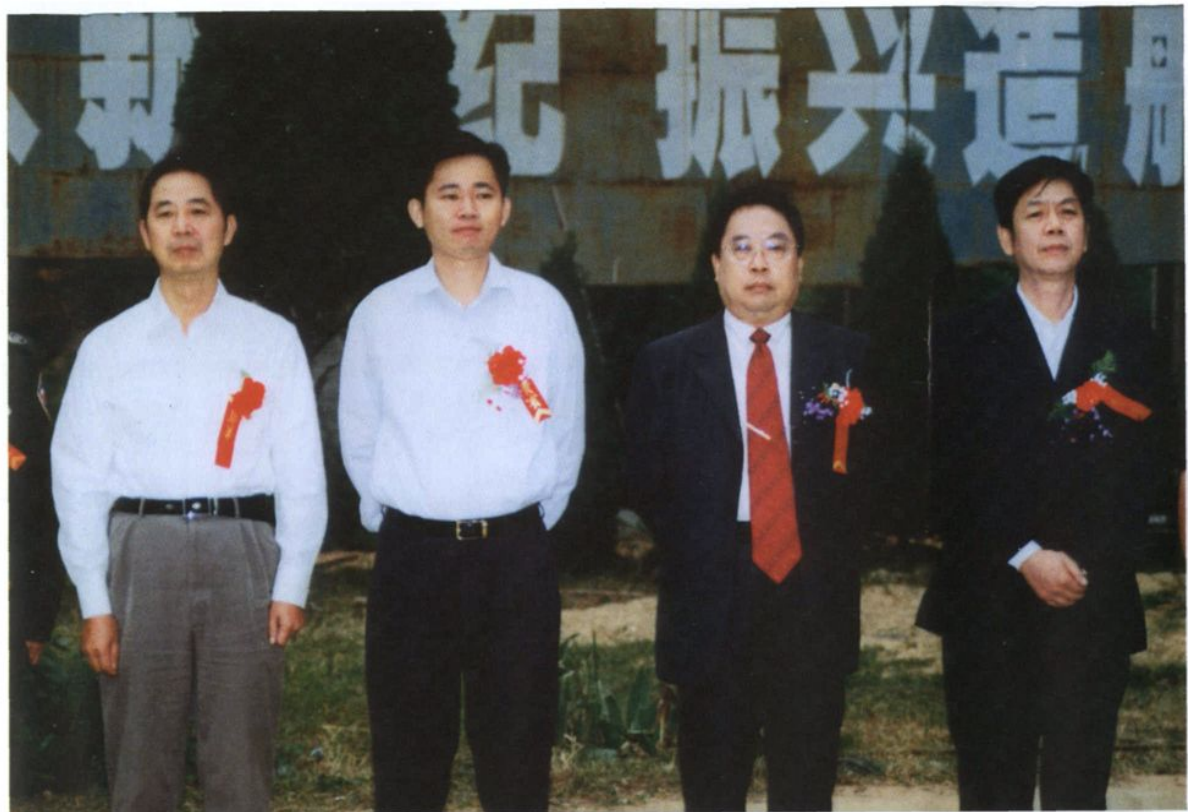
江西省交通厅党委书记程受锭（右二），九江市交通局副局长曹辉（左一）与中共都昌县委书记杨振辉（右一）县长赵伟在参加县造船总厂2004年10月1日“丰盛号”下水庆典时合影