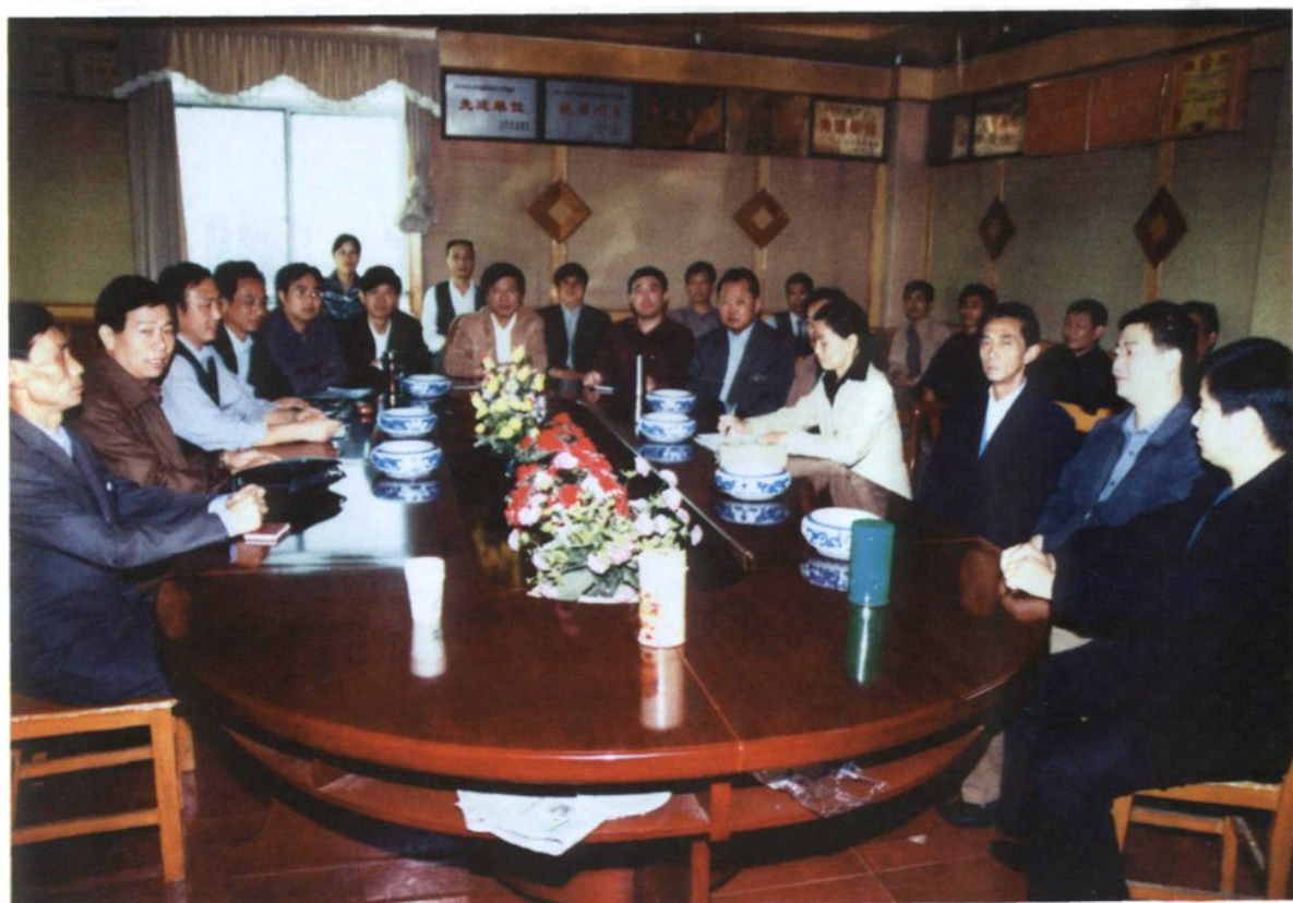
都昌县交通局党政班子成员合影