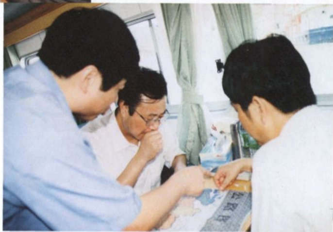
江西省交通厅厅长蒲日新在中共都昌县委书记杨振辉（右）、县交通局长汪国柱陪同下查看都昌县的公路交通地图