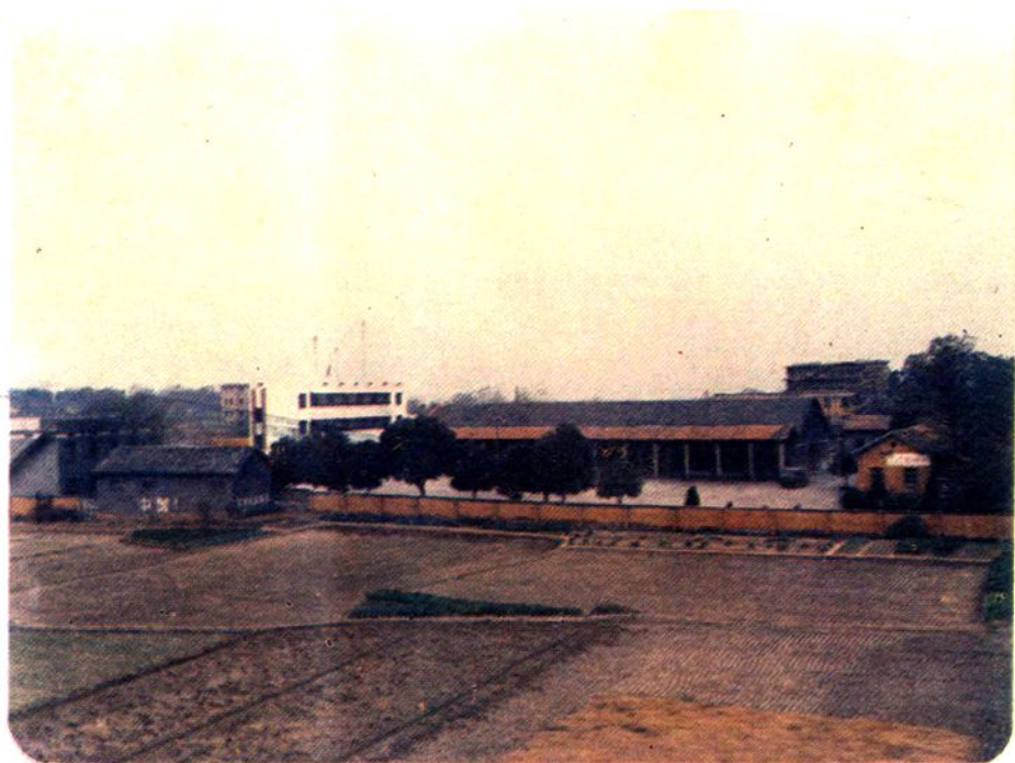
南昌县向西军供站