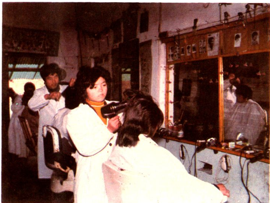
向塘镇高田村“双扶经济实体”多美理发室