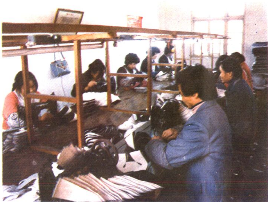
莲塘镇社会福利童装厂