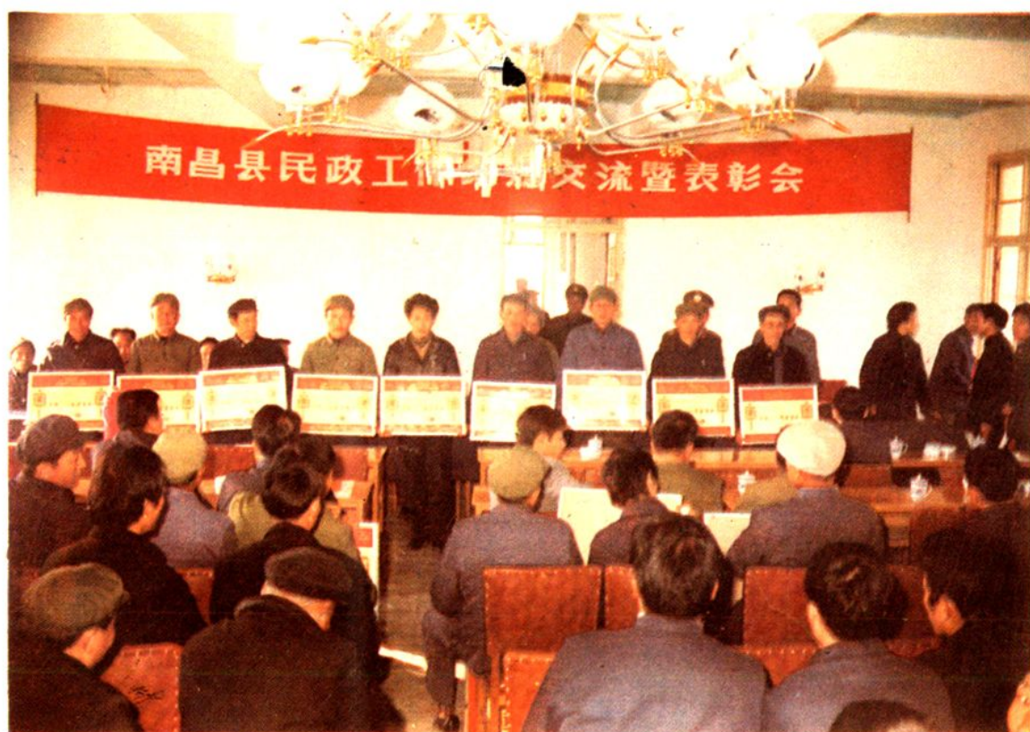
一九八七年十二月，在莲塘召开南昌县民政工作经验交流暨表彰会。