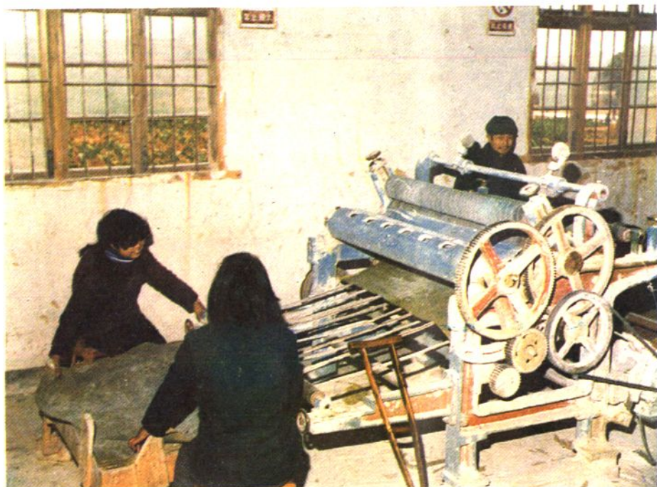
莲西乡社会福利防潮纸厂