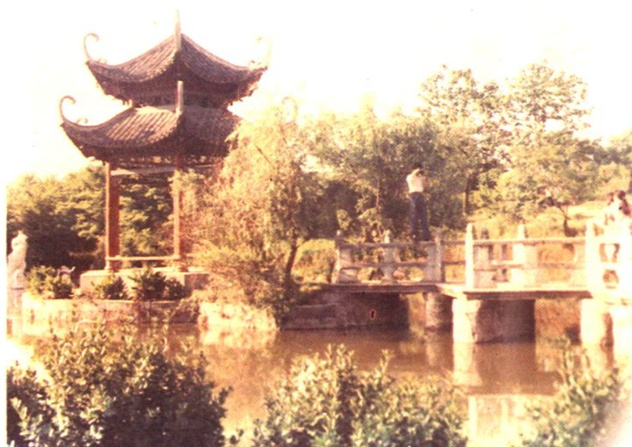
革命烈士陵园内景