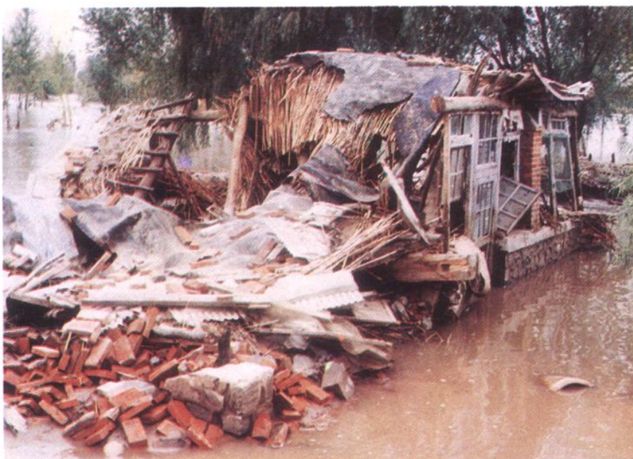
一九八五年辽河滩地门家网村被淹情景