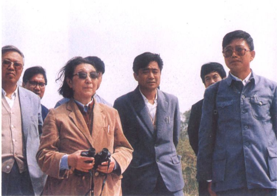
一九八七年水利部长钱正英（左二）和辽宁省水电厅长周文智（右一）在新民县委书记李振发（右二）的陪同下视察辽河大堤