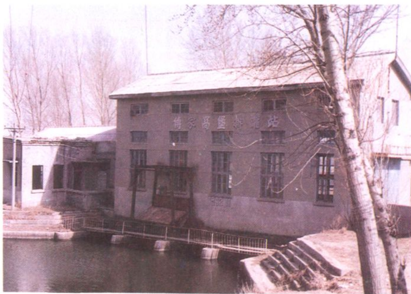
傅家窝堡排水站外景