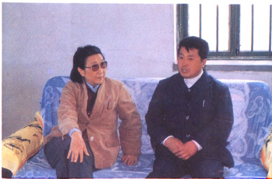
一九八七年水利部长钱正英和人民屯镇河道管理所所长张景贵谈话。