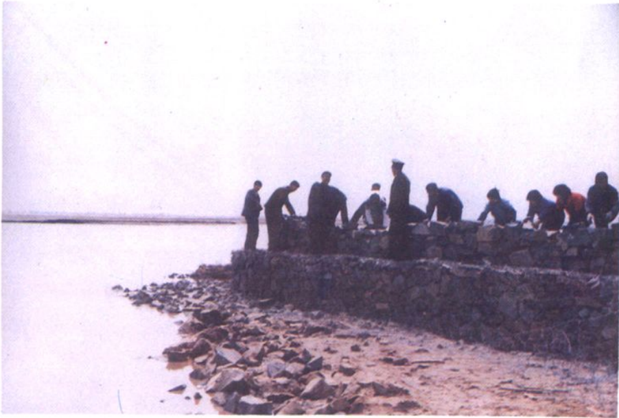
辽河大堤杏树坨子段方笼护岸施工现场