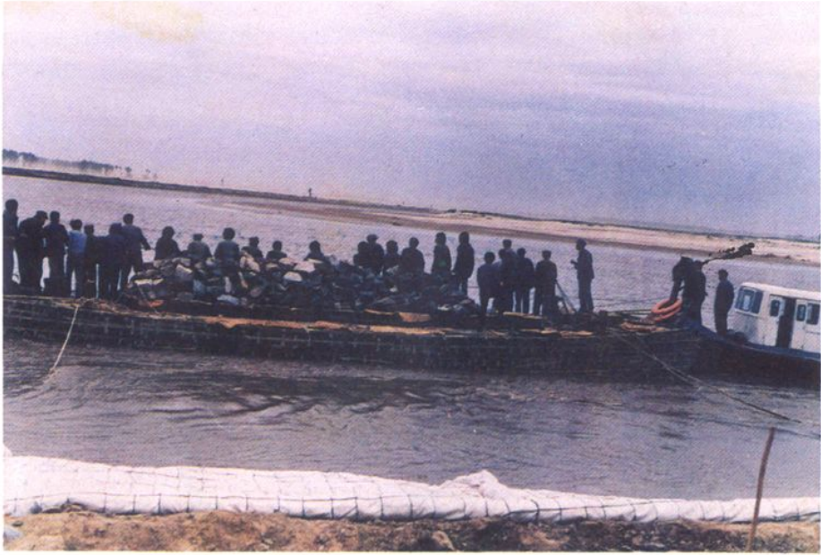
辽河大堤二龙眼段丙稀布软排护坡施工现场