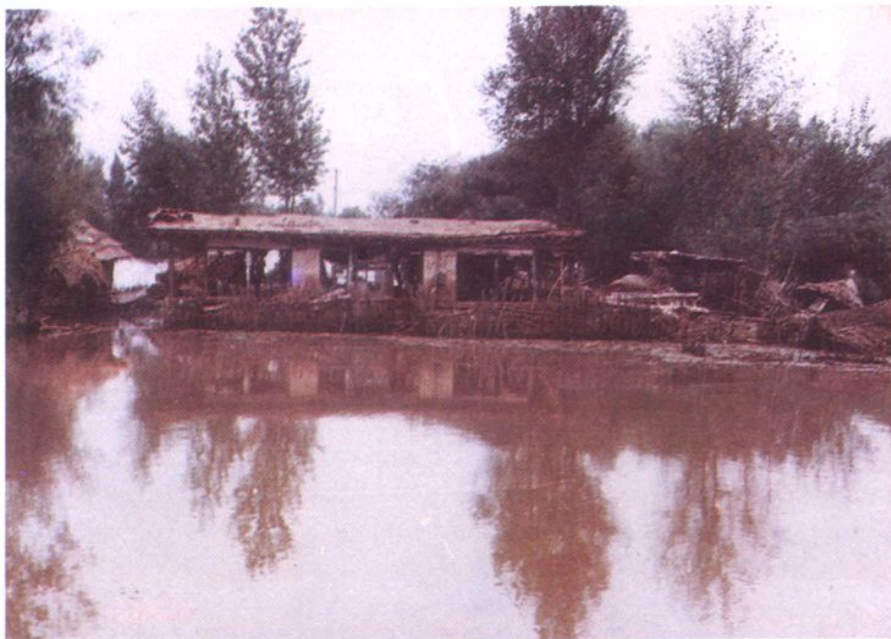
一九八五年辽河滩地长沟沿村被淹情景