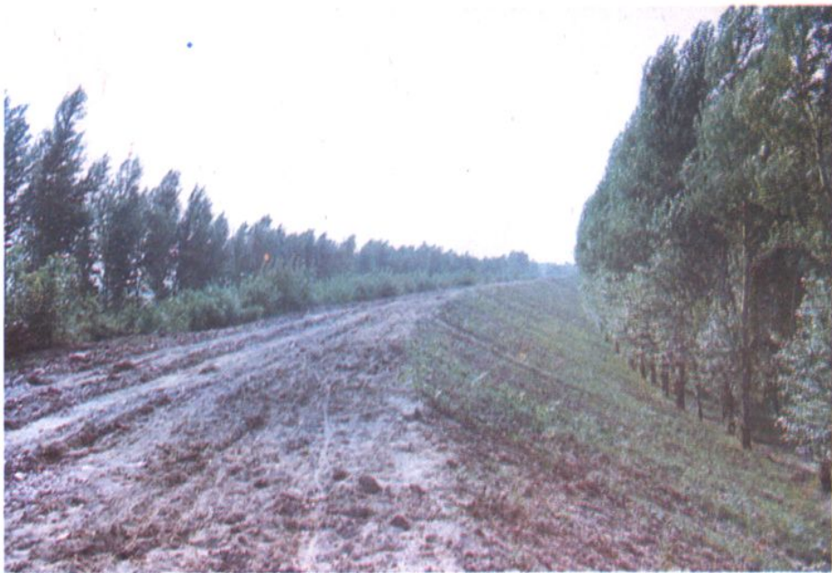
辽河大堤兴隆堤段绿化