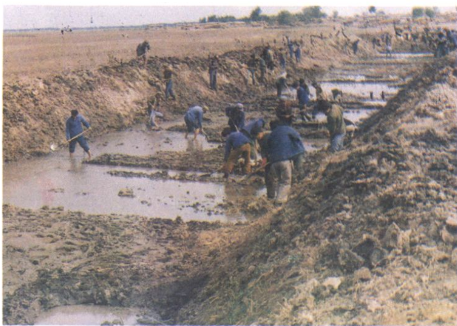
1986年5月马蹄岗子站机排干沟清淤现场