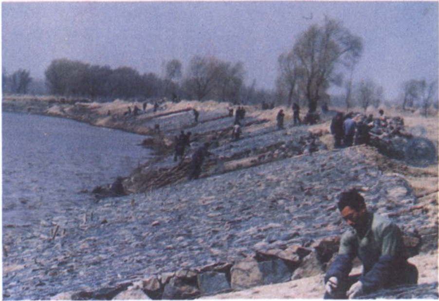
辽河大堤二龙眼方笼护坡施工现场