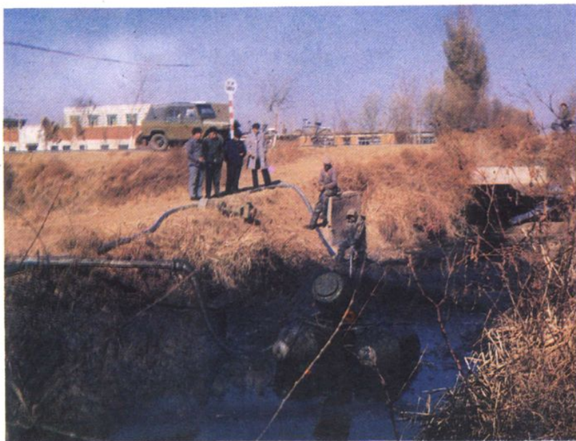
胡台乡泥浆泵清淤