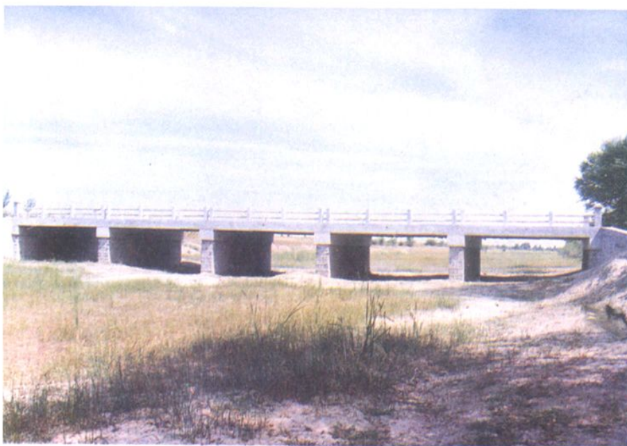
马连杆子排干上的红岭桥