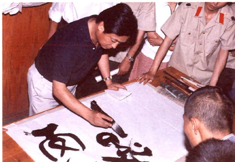
4. 著名美术家韩 美林到监狱题字作画