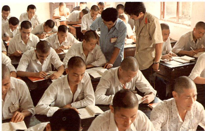
6. 犯人接受学历教育