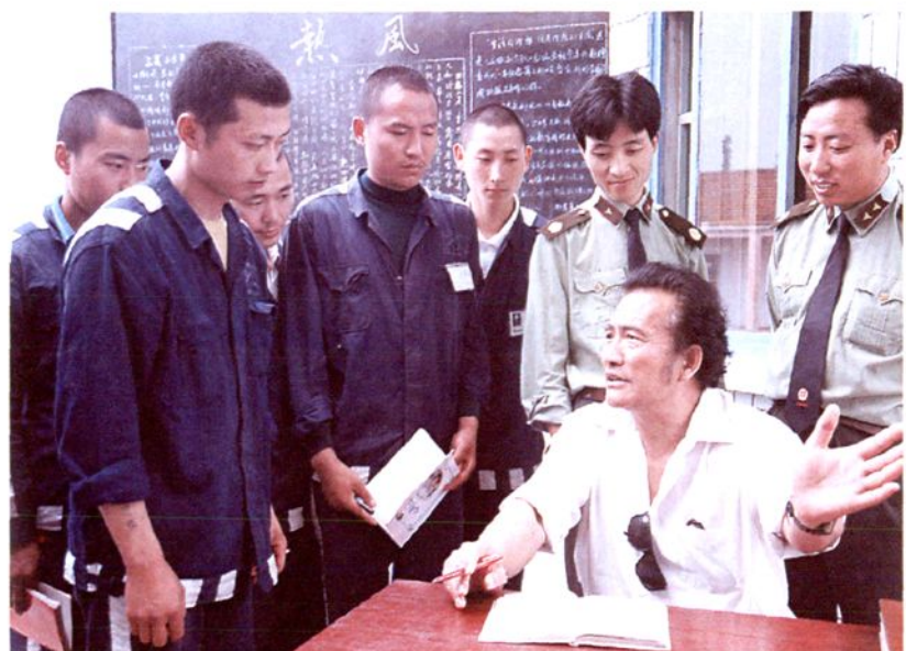
6. 著名电影演员 杨再葆到监狱探友时找 犯人谈话教育