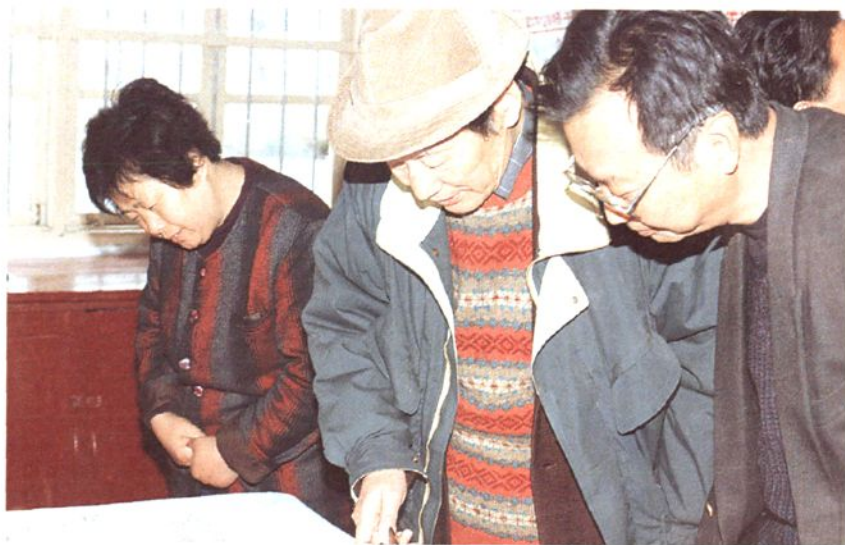
2. 著名作家鲁彦 周(中)视察监狱