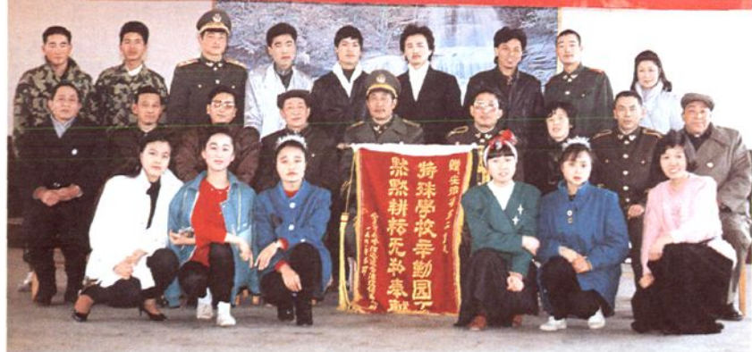
1. 社会各界组织 演出队到监狱演出