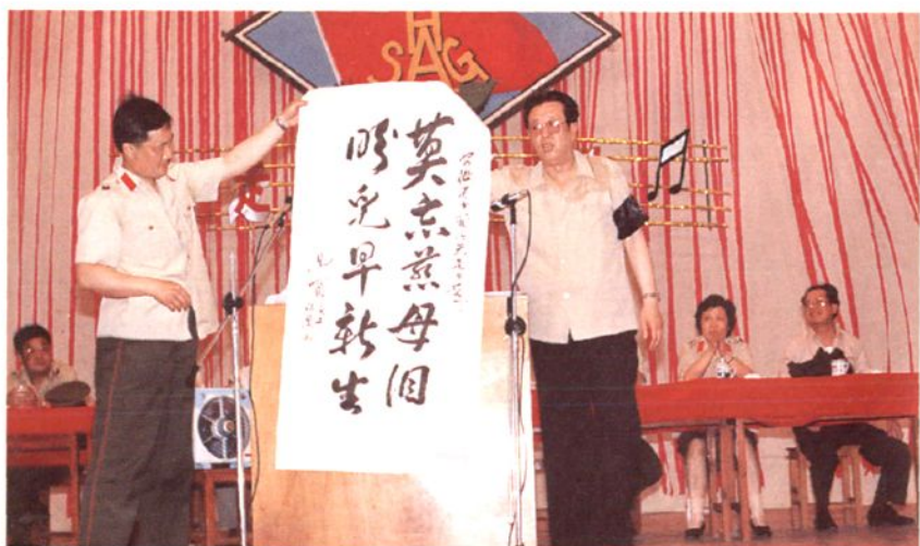
3. 著名思想家 曲啸(右)给犯人作报告