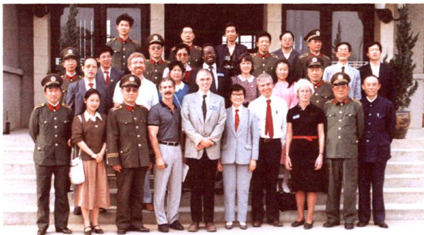
5. 国际友人参观 省少年犯管教所后留影