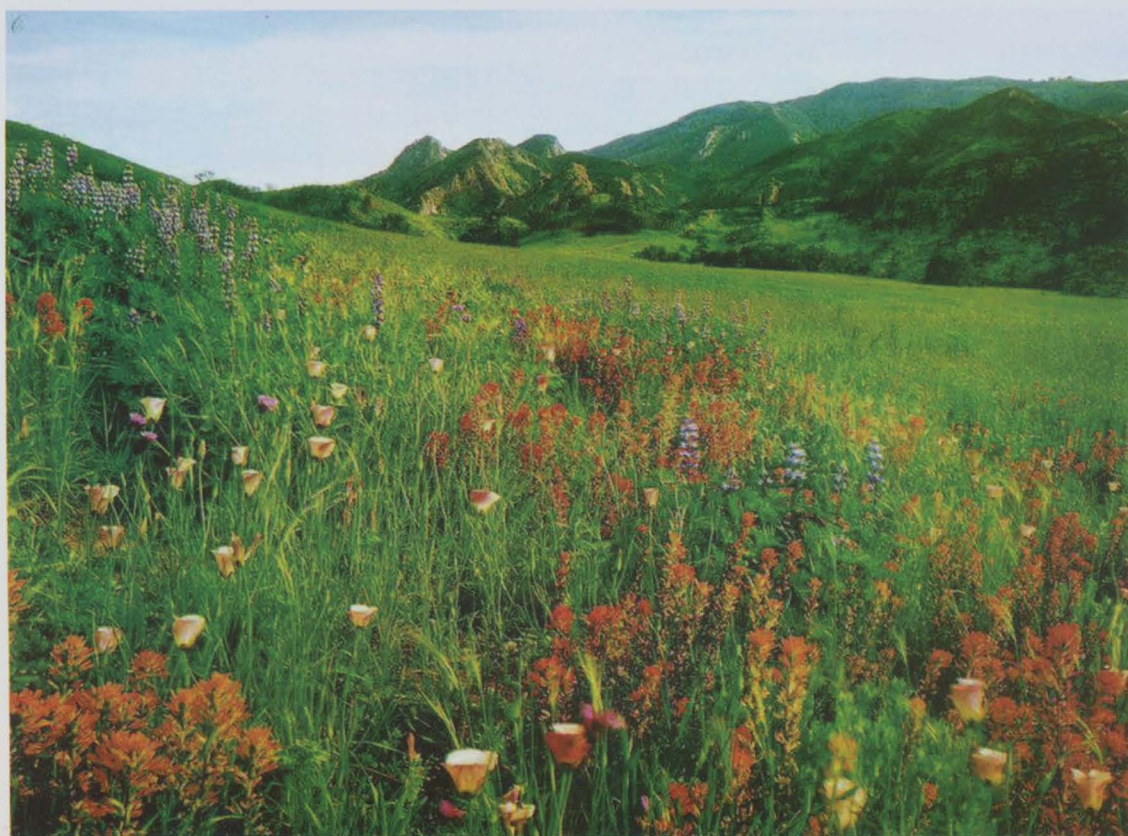
始祖山森林风光——山花烂漫