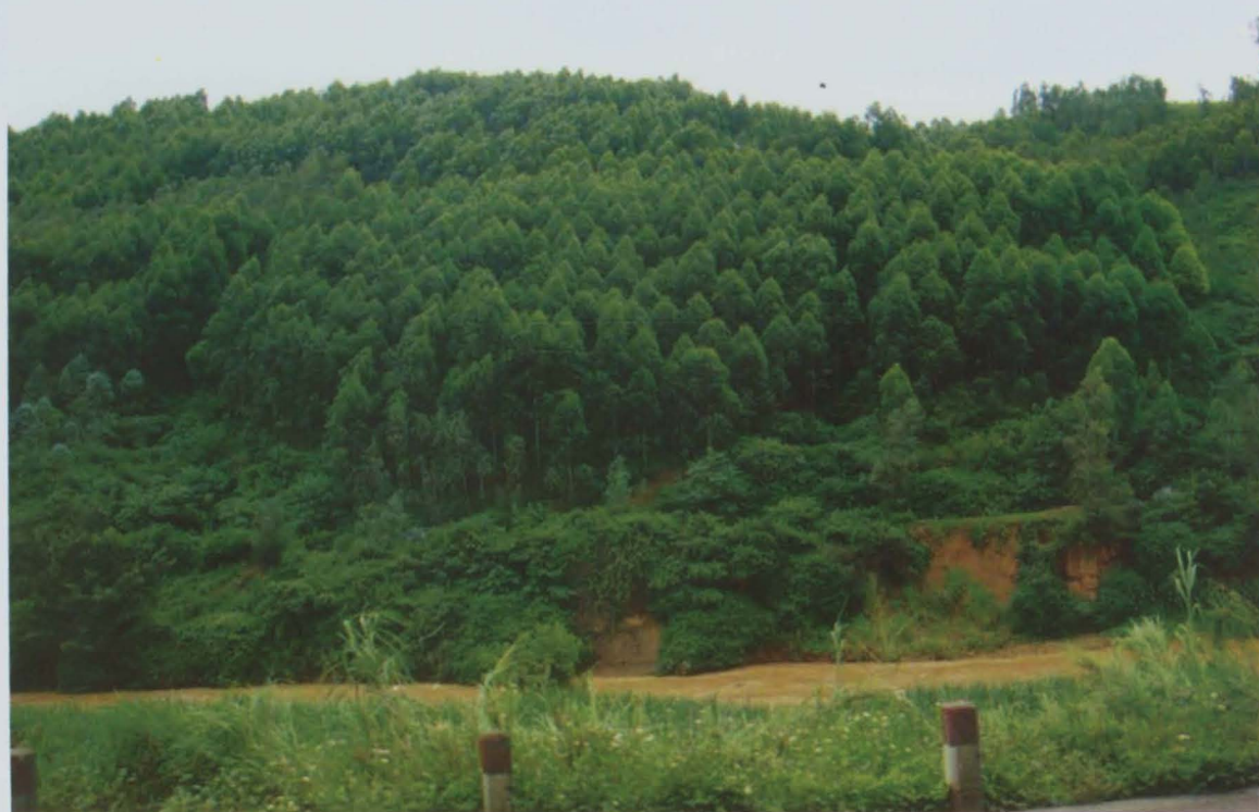
树木茂盛的始祖山