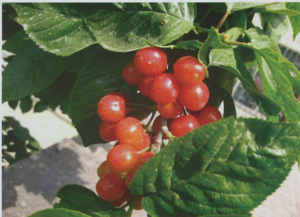
龙湖区特色杂果——樱桃