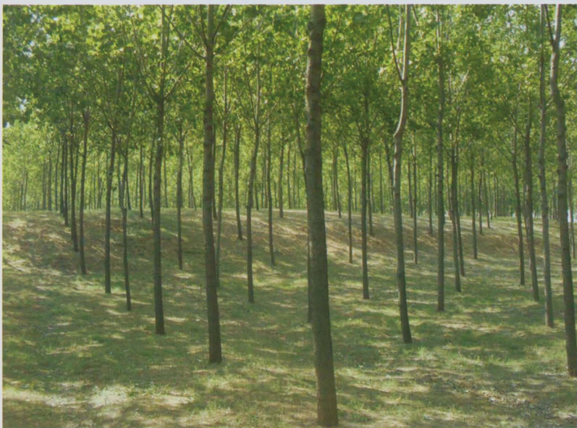
沙林卫士——新郑市东部沙区生态林