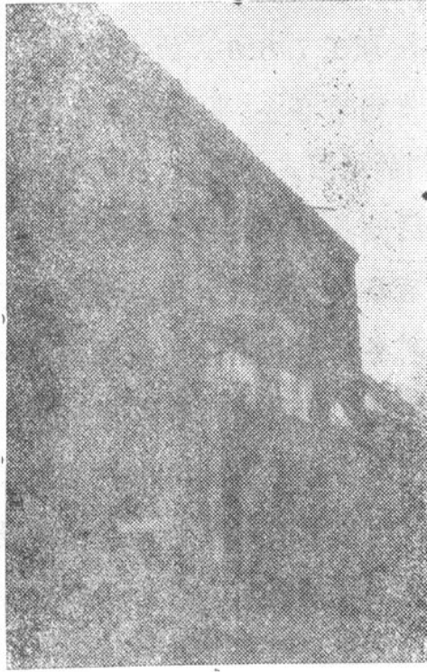
图二：三十年代九龙岗邮政局旧址