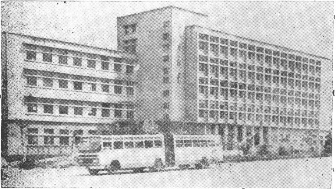
图一：邮电大楼外景