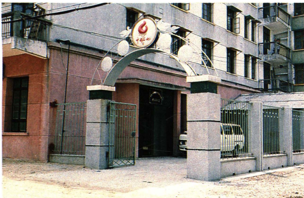
青山办事处办公楼