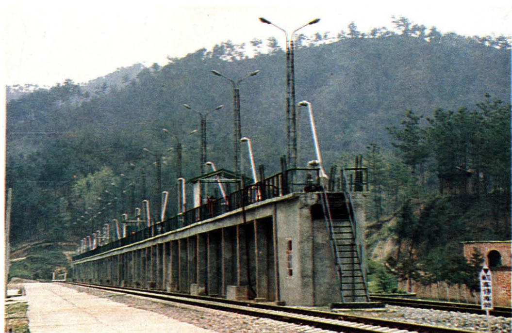
谷城油库铁路栈桥