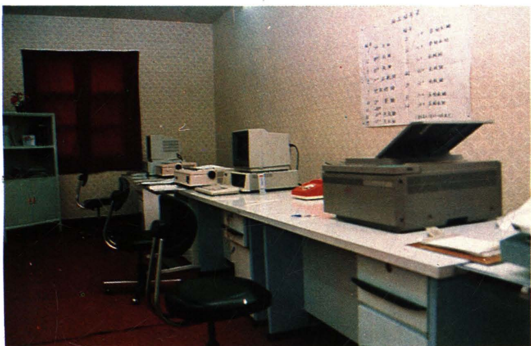
荆门办事处电脑室