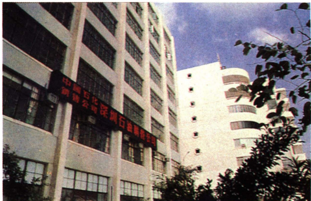
深圳联营公司办公楼