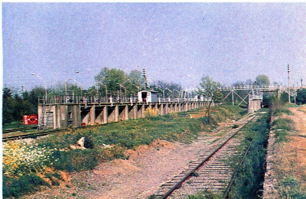
澉口油库铁路专用线