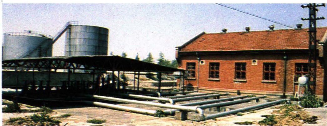
武汉油库江边泵房