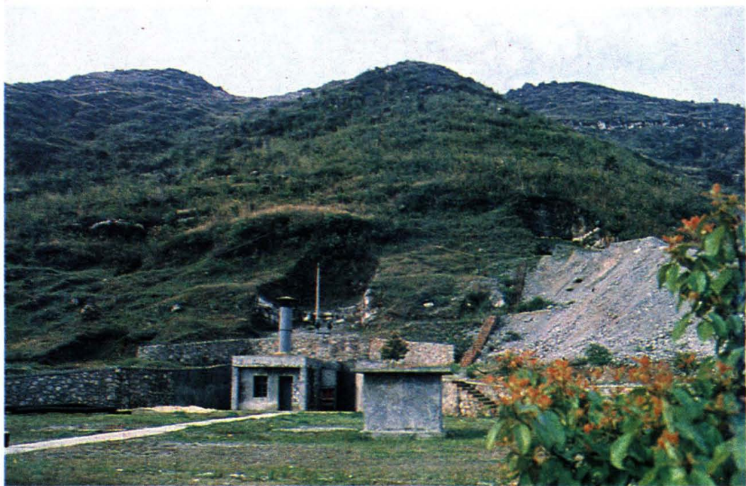
枝城油库山洞油罐洞口