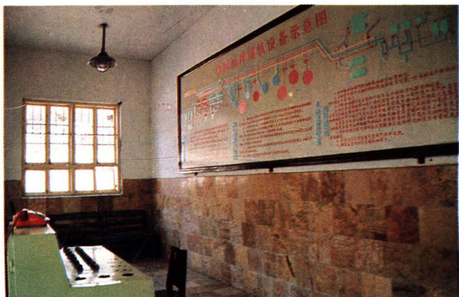
鄂城油库 铁路泵房 控制室