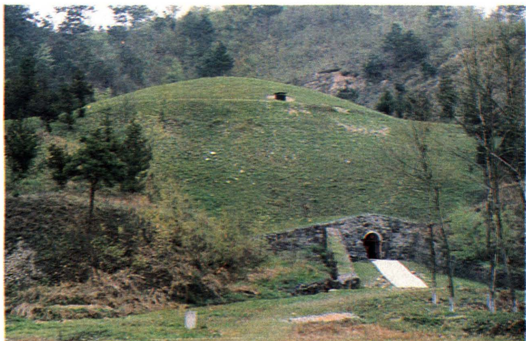
谷城油库覆土油罐