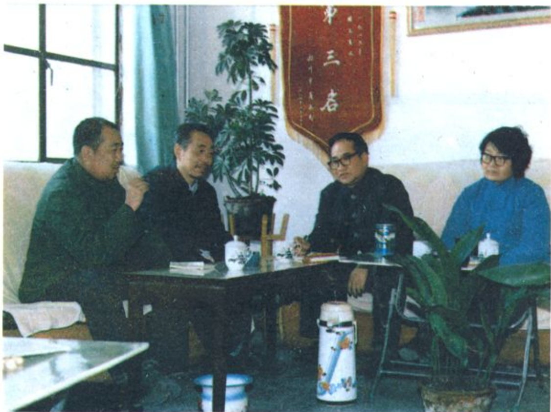
公司领导班子在研究工作。