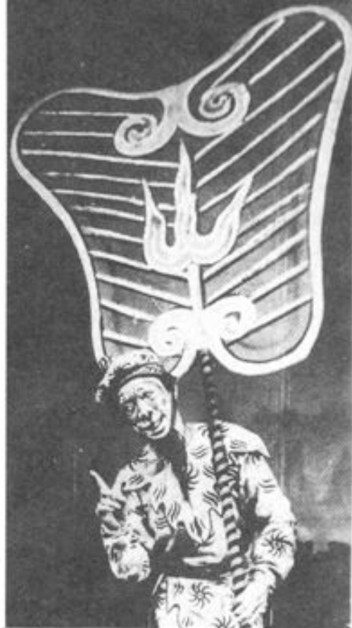
▶ 京剧《火焰山》八龄童饰孙悟空