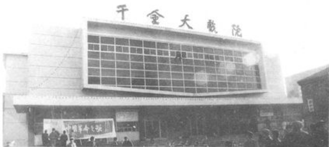
▶ 千金大戏院 一九八二年建