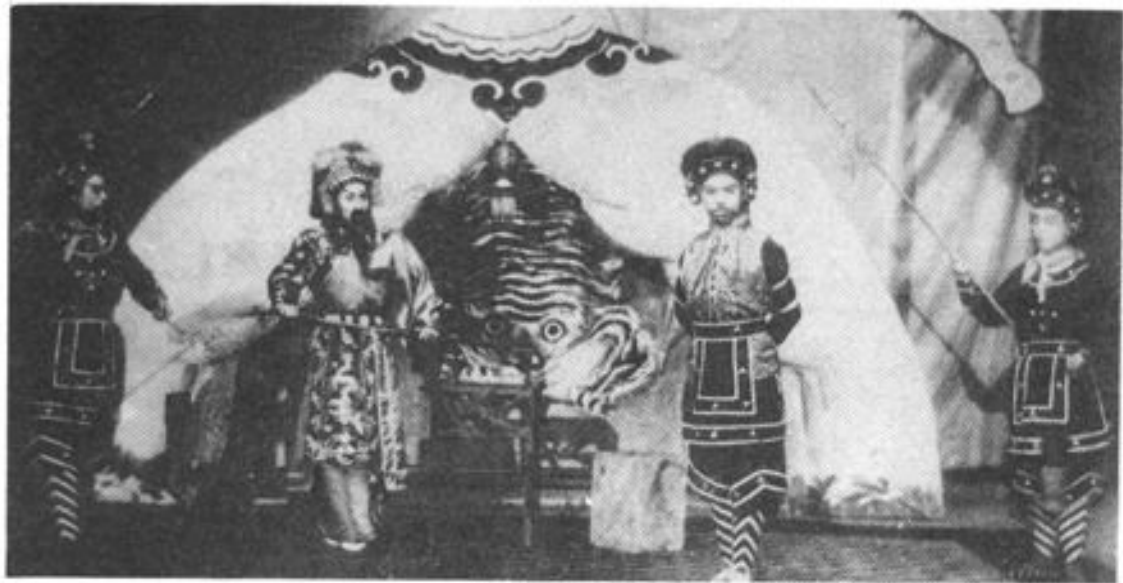
京剧《武王伐纣》 抚顺市京剧团演出