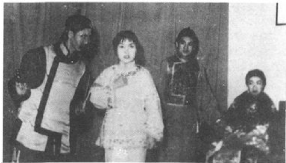
评剧《杨乃武与小白菜》 抚顺市评剧团演出