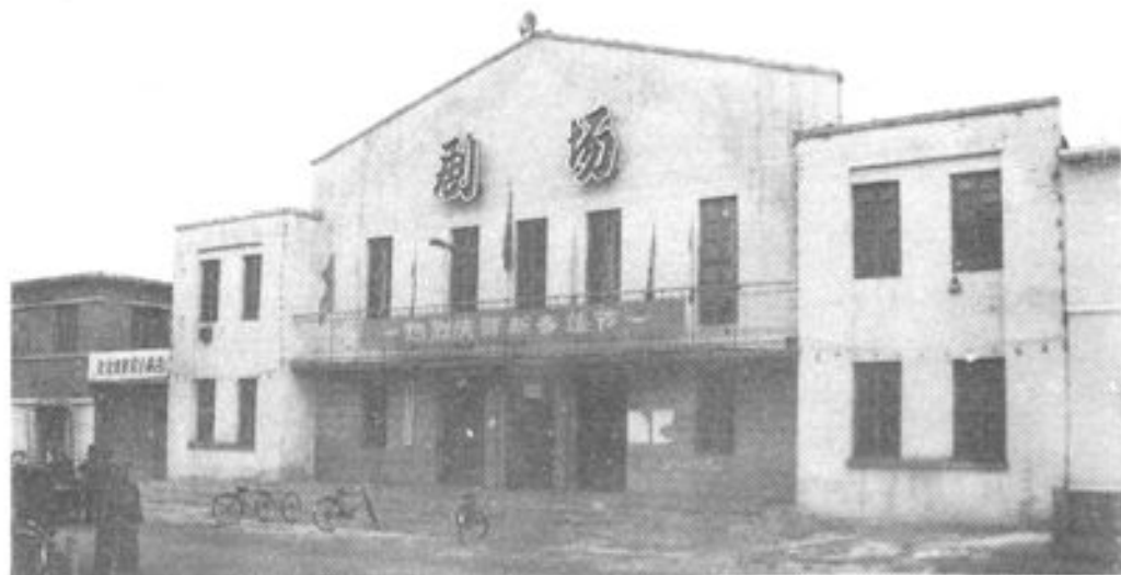
◀ 新宾剧场 建于一九五六年