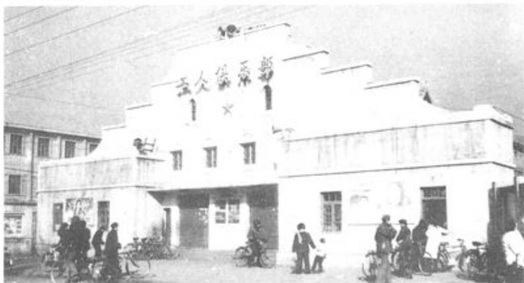
◀ 清原工人俱乐部 建于一九五七年