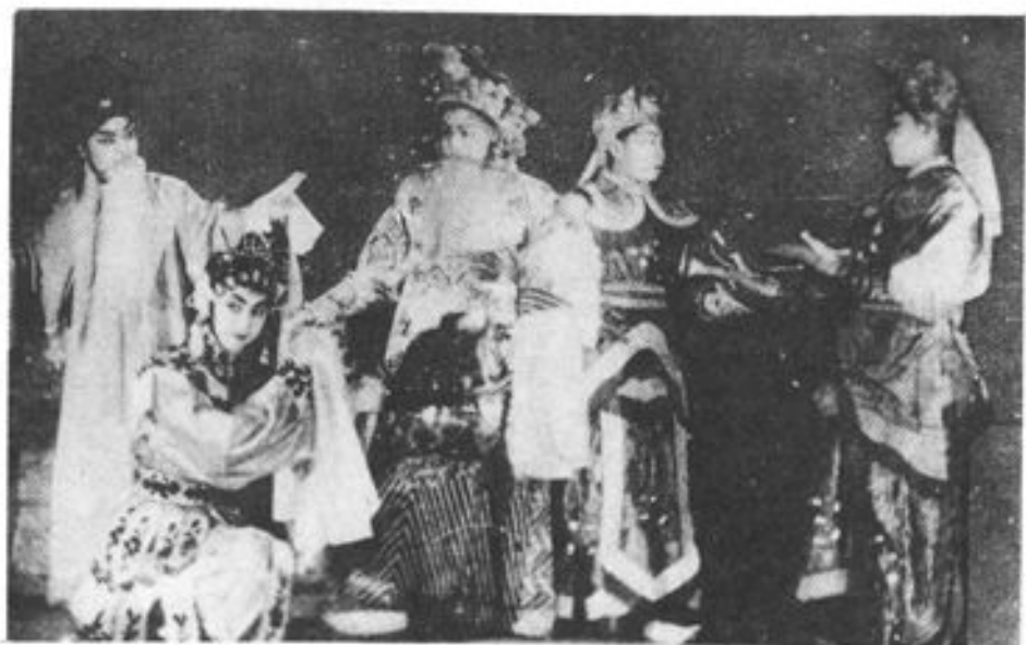
豫剧《花木兰》 抚顺市豫剧团演出