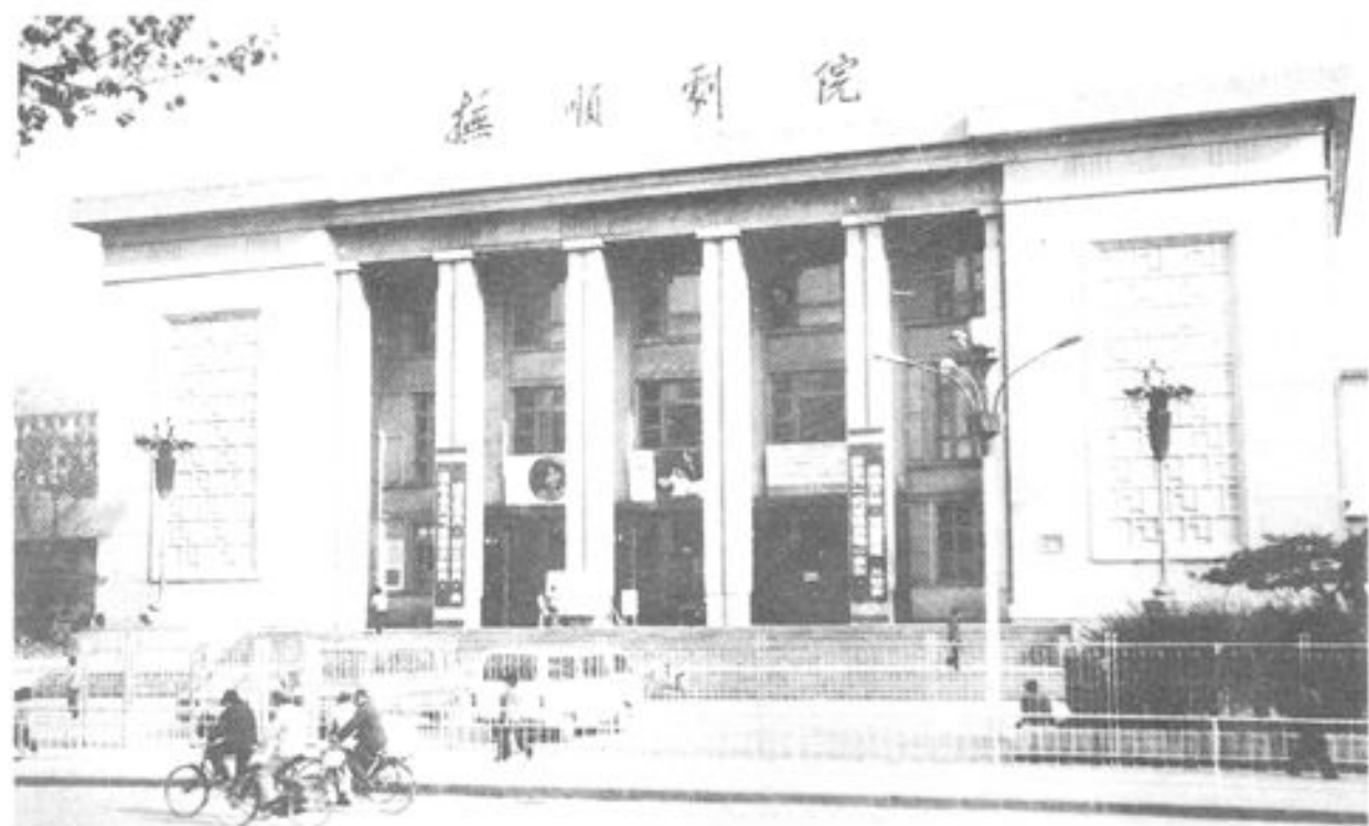
▲ 抚顺剧院 一九八〇年建