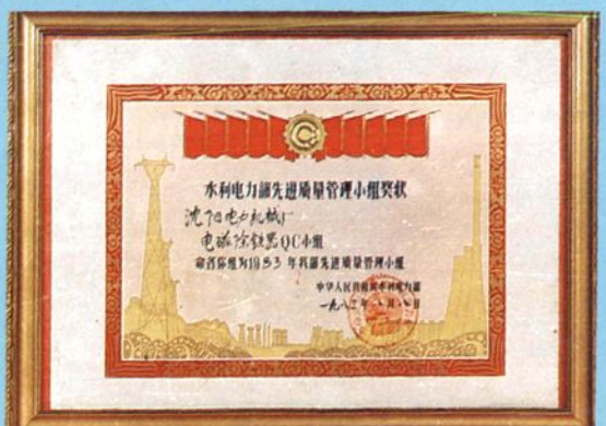
水利电力部颁发的优质产品奖状和先进质量管理小组奖状