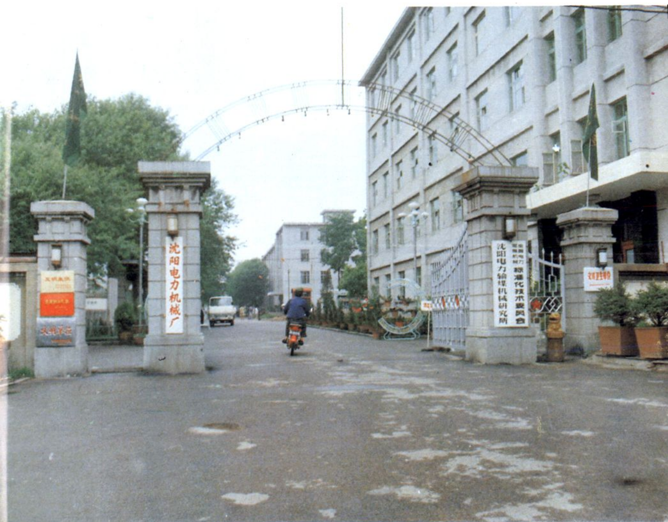
沈阳电力机械厂正门