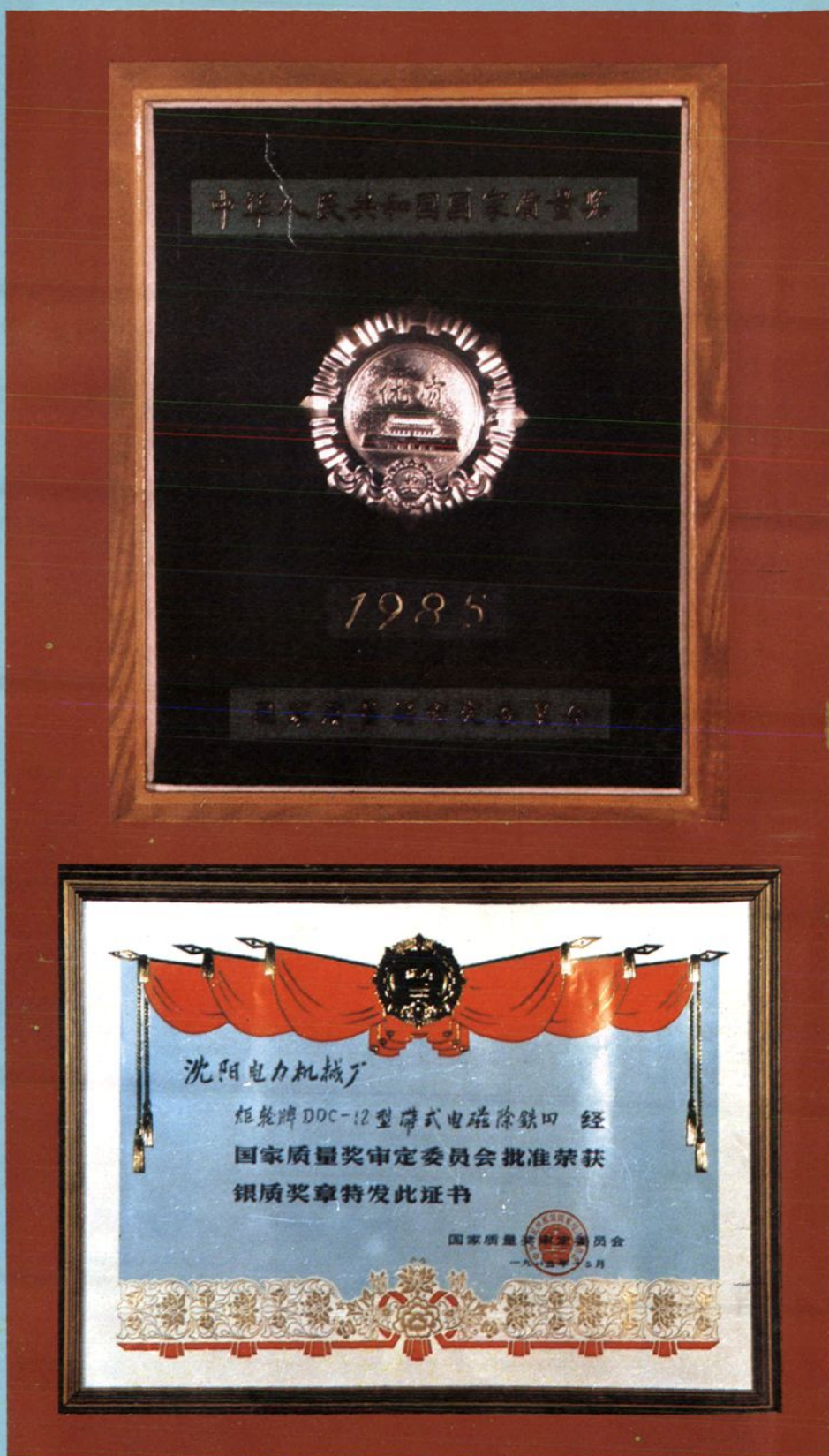
国家质量奖审定委员会颁发的银质奖章和证书