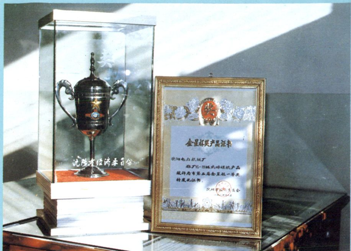
沈阳市经委颁发的金星杯一等奖奖杯和证书