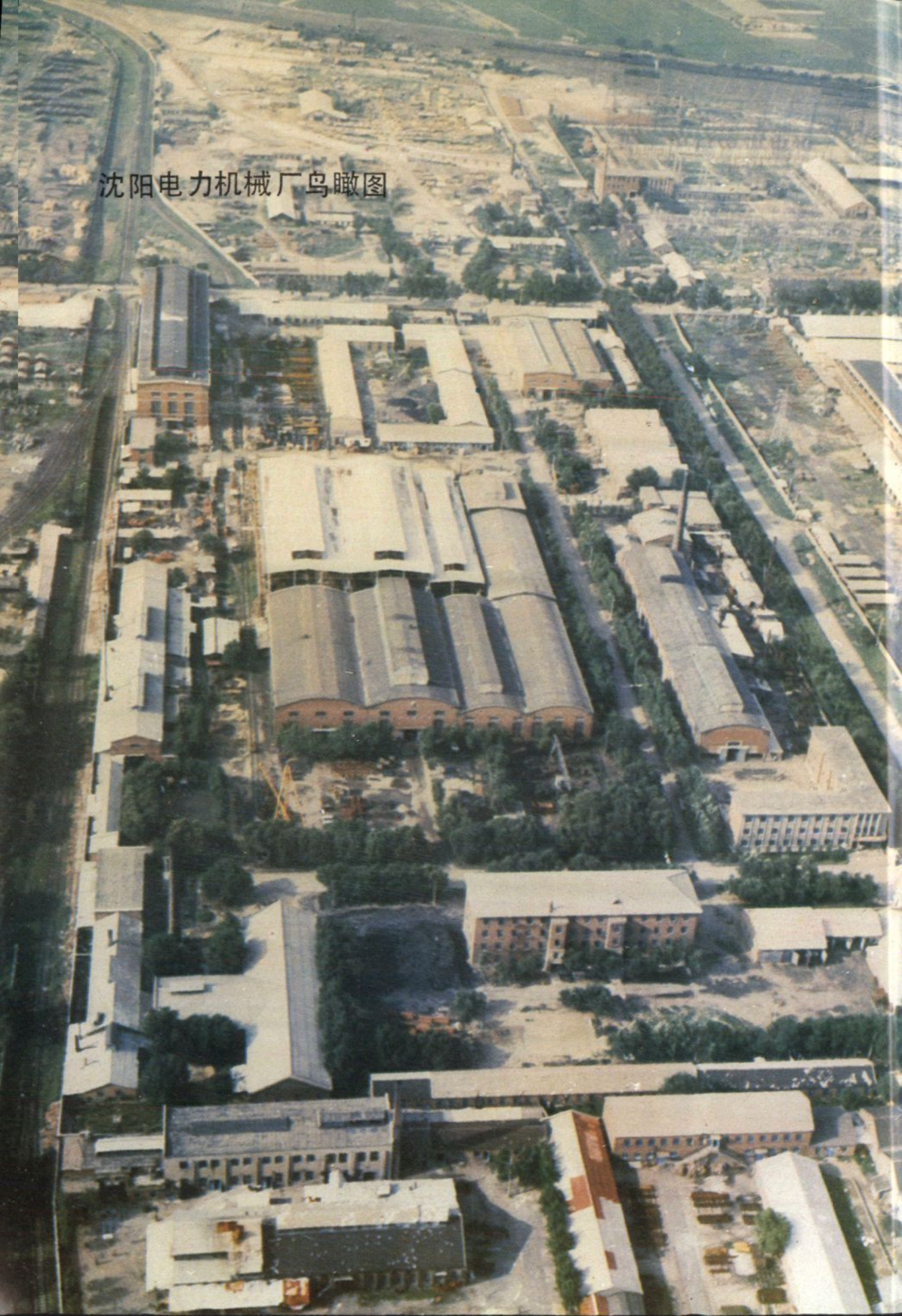
沈阳电力机械厂鸟瞰图