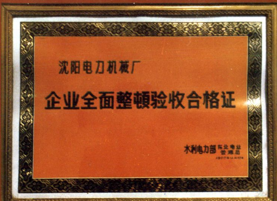
东北电业管理局颁发的企业全面整顿验收合格证