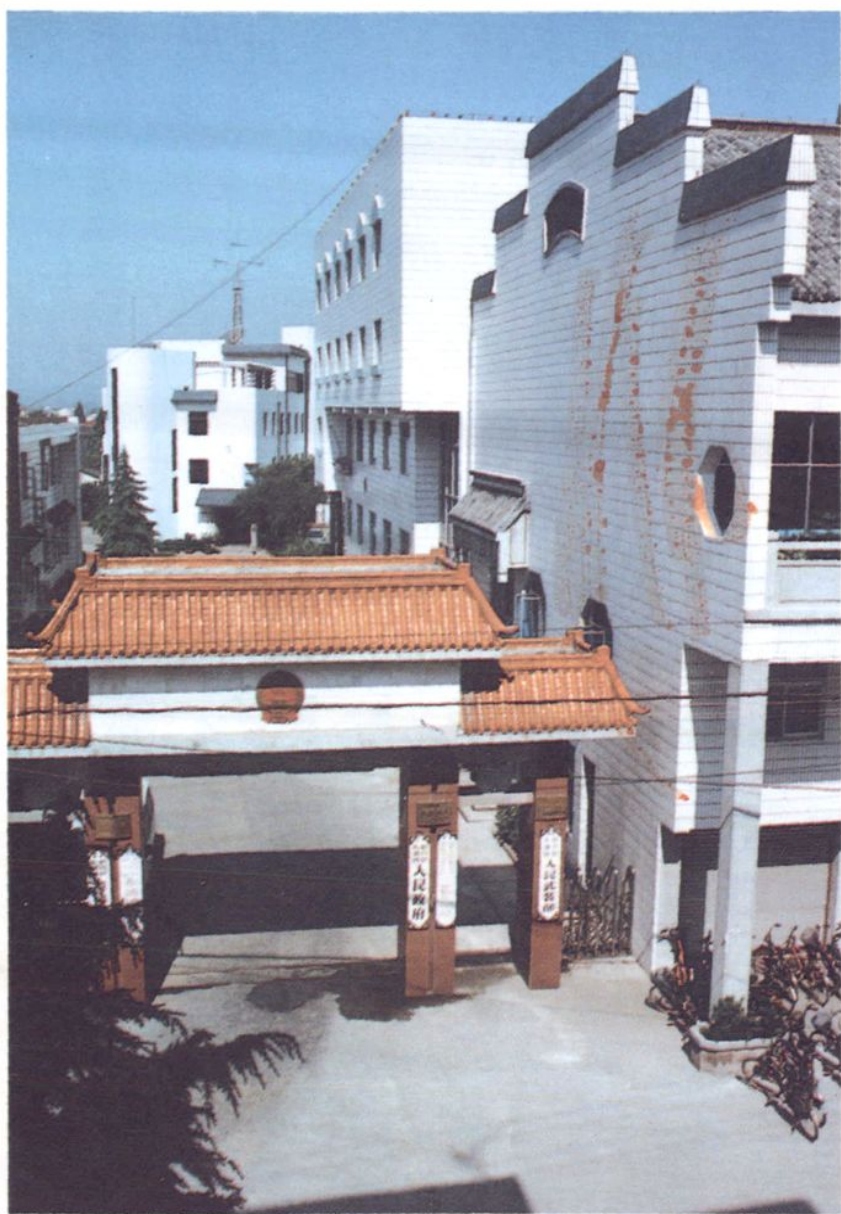
▲ 东浦镇人民政府大院