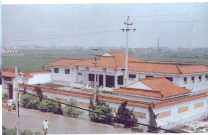
▼ 长安苑 (安息堂)