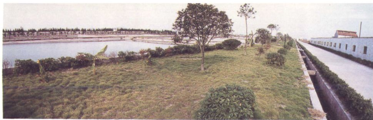
▲ 东浦水产养殖总场