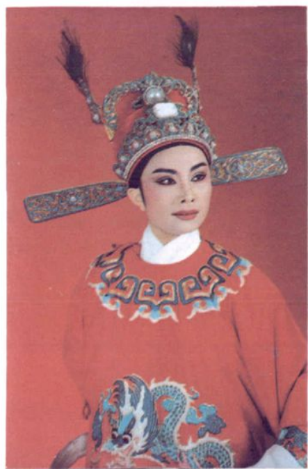
◀ 国家二级越剧演员 吴凤花