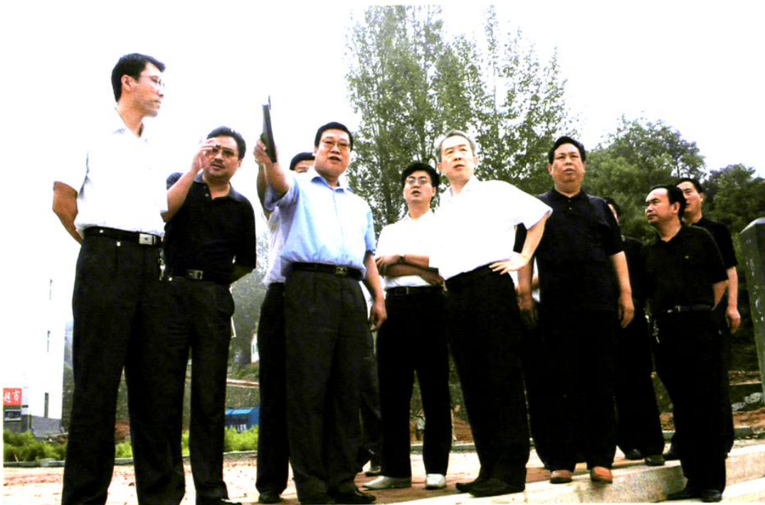
中共阳城县委书记刘爱军（右三）在阳城一中西校区检查财政性工程实施情况