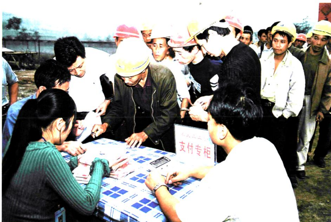
专柜领取 现场发放