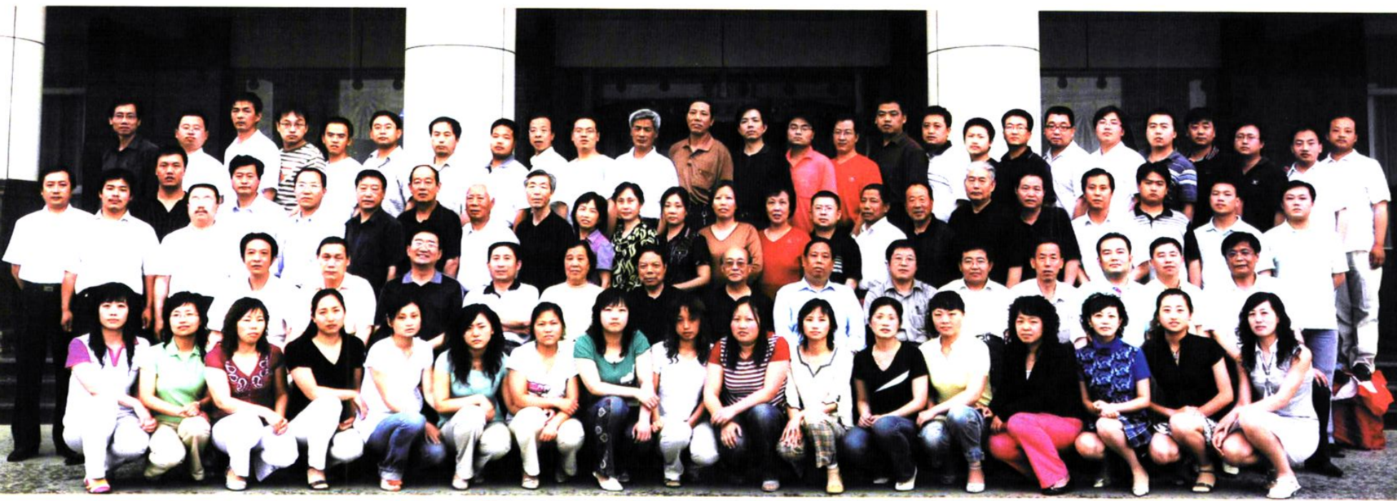
阳城县财政局全体工作人员