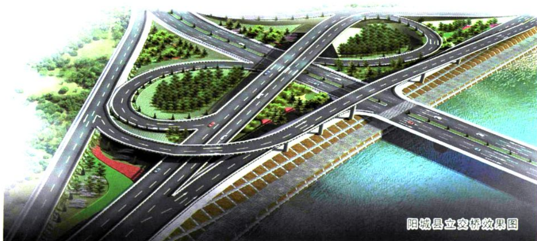
阳城县立交桥效果图