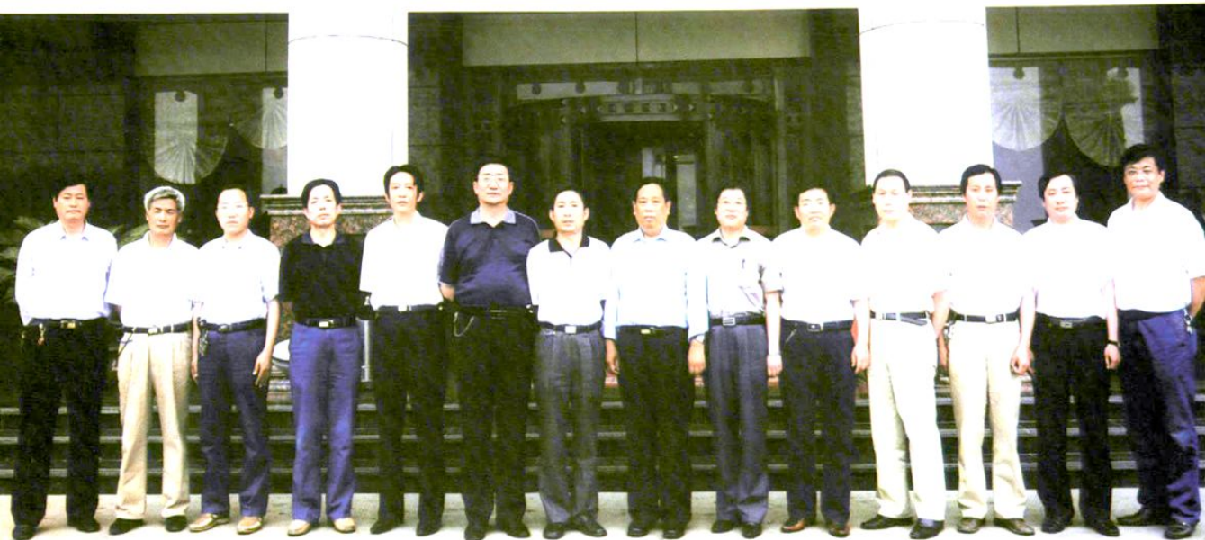
阳城县财政局局务会组成人员