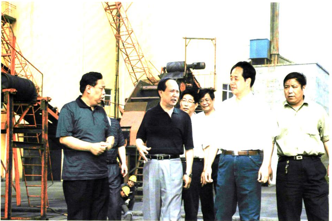
阳城县政协主席张星社（右二）深入煤炭企业调研