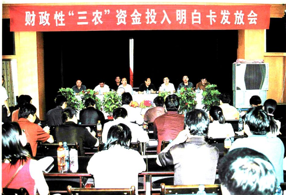
西河乡郭河村发放现场