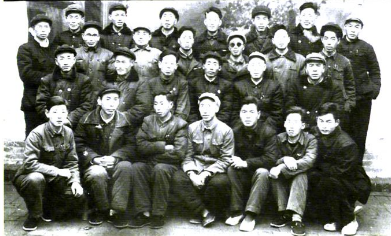
阳城县财政所欢送霍层长合影 59.11.25