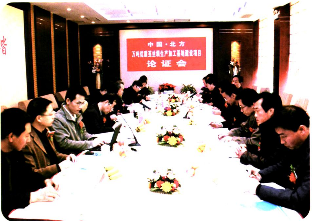
论证会在阳城金凤凰国际大酒店召开