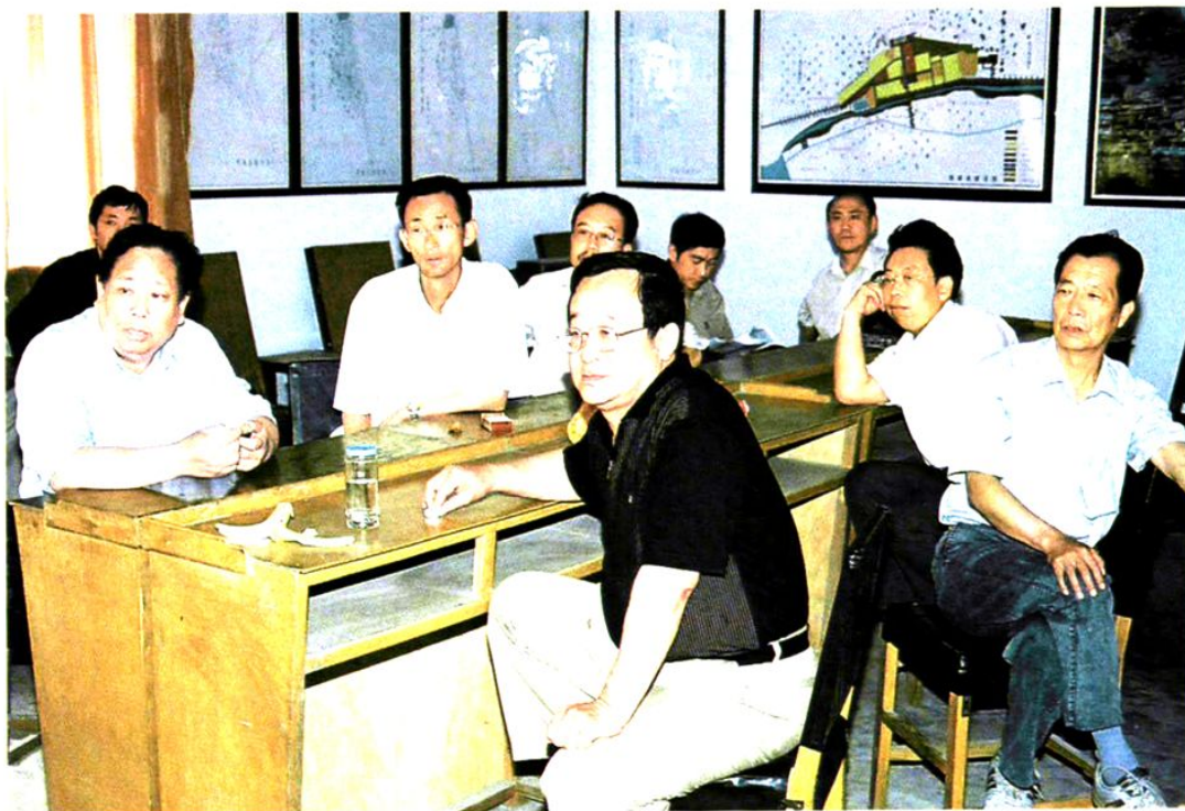
阳城县人大常委会主任郑瑞俊（中）深入乡村考察