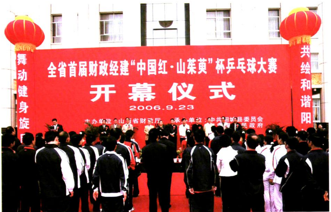
开幕式在阳城金凤凰国际大酒店举行